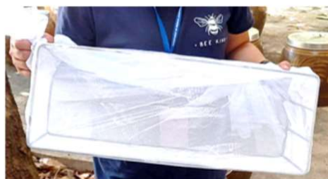
ภาพที่ 2 อุปกรณ์เช็คผล A. กระชังลอยลูกน้ำ และ B. กรงลอยลูกน้ำแบบปล่อยอิสระ