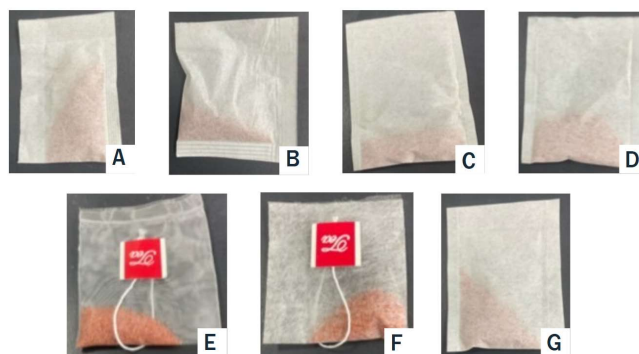
ภาพที่ 1 ของทราย 7 รูปแบบ A. ของพร้อมทรายที่ขายอยู่ในท้องตลาดแบบที่ 1 B. ของพร้อมทรายที่อยู่ในท้องตลาดแบบที่ 2 C. ของเยื่อกระดาษ D. ของเยื่อไผ่ E. ของไนลอน F. ของเยื่อข้าวโพด และ G. ของเยื่อไม้

วัสดุของทรายทั้งหมด 7 ประเภท ดังแสดงในภาพที่ 1 แบ่งเป็น 2 กลุ่ม กลุ่มแรกเป็นของบรรจุทรายที่มีฟอสขนาด 20 กรัมแบบสำเร็จรูปที่วางจำหน่ายในท้องตลาด (วัสดุผลิตขึ้นโดยไม่ได้ผ่านกระบวนการถักทอและใช้เส้นใยสังเคราะห์ที่ผลิตจาก polypropylene, PP) และอีกกลุ่มที่นำมาคัดเลือกมี 5 ประเภทเป็นของที่ทำจากวัสดุอื่นแตกต่างกันโดยซื้อจากร้านขายของสำหรับชงชา ได้แก่ ของเยื่อกระดาษ ของเยื่อไผ่ ของไนลอน ของเยื่อข้าวโพด และของเยื่อไม้