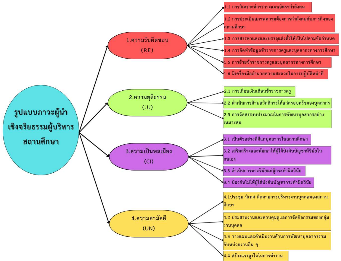
ภาพที่ 2 รูปแบบภาวะผู้นำเชิงจริยธรรมของผู้บริหารสถานศึกษา