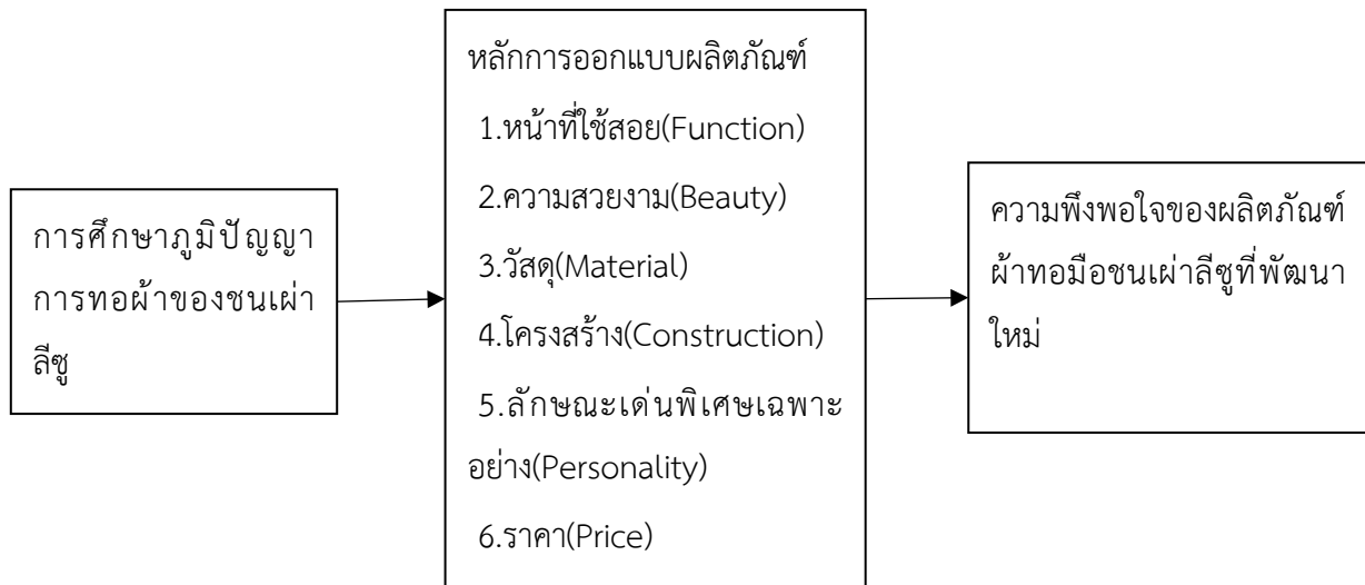
แผนภาพที่ 1 กรอบแนวคิดในการวิจัย

2. ออกแบบและพัฒนาผลิตภัณฑ์ โดยผ่านการมีส่วนร่วมกับทางกลุ่มผ้าทอชนเผ่าเพื่อยังคงไว้ซึ่งอัตลักษณ์