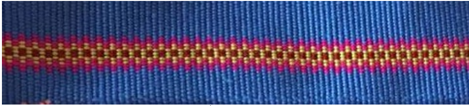
รูปภาพที่ 2 รูปลายก้างปลา

ตำบลคีรีราษฎร์ ผู้หญิงชนเผ่าลีซู ไม่ถนัดด้านการเย็บปัก จึงใช้การทอละลายเข้าไปขณะทอผ้า จากการสัมภาษณ์พบว่า ลายนี้เป็นลายที่สืบทอดกันมาจากบรรพบุรุษที่อาศัยอยู่ในตำบลคีรีราษฎร์ เป็นการดัดแปลงจากลายท้องถิ่นเกี่ยวกับลายเขี้ยวสุนัข หากการทอเกิดความผิดพลาดที่จุดใดจุดหนึ่งก็จะทำให้ทอลายนี้ไม่ได้ ทอละลายจะไม่ปรากฏบนผ้า จึงเป็นอีกทอละลายหนึ่งที่ต้องใช้ฝีมือ และความละเอียดรอบคอบสูง