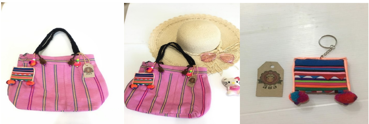
รูปภาพที่ 3 รูปผลิตภัณฑ์กระเป๋าผ้าทอมือชนเผ่าลีซูที่ทำการพัฒนาใหม่

2. การพัฒนาผลิตภัณฑ์ผ้าทอมือชนเผ่าลีซู โดยคำนึงถึงรูปแบบที่เป็นที่นิยมในหมู่บ้านหรือวัยทำงาน จึงได้ออกมาเป็นกระเป๋าถือสตรีทรงสี่เหลี่ยมคางหมูที่มีขนาดเล็ก สามารถพกพาได้สะดวก มีการใช้ด้ายสีชมพู ในการทอ เพื่อต้องการคงความเป็นเอกลักษณ์ด้านสีเส้นที่สดใส สายสะพายเป็นการนำผ้าสีดามาเย็บแล้วดึง ด้านในกลับออกมา เรียกว่า ใส่ไก่ เพื่อนำมาถักเป็นเปีย เพื่อทำให้ได้สายสะพายที่ดูมีมิติ โดยตัดสายสะพายให้มีความยาวพอเหมาะสำหรับการถือ ทำการตกแต่งกระเป๋าด้วยการประดับปอมๆ กระดิ่ง ที่ดัดแปลงมาจากพู่ประดับที่หญิงชนเผ่าลีซู มัดไว้ด้านหลังเอว และเพิ่มพวงกุญแจที่ดัดแปลงมาจากลายอะหน่าฮือ (เขี้ยวสุนัข) กับลายฮู้เพี้ยคว่า (แป้นสี่เหลี่ยมหลังลูกธนู) เพื่อเพิ่มความเป็นเอกลักษณ์และเป็นที่ยึดจำ พร้อมด้วยการใช้กระดิ่งที่เป็นโลโก้ของผลิตภัณฑ์นี้ ทำให้กระเป๋าถือผ้าทอมือมีรูปแบบที่ทันสมัยขึ้นจากเดิม มีการแสดงความเป็นเอกลักษณ์ของชนเผ่าลีซูในองค์ประกอบต่างๆ ของตัวผลิตภัณฑ์ ได้อย่างชัดเจน