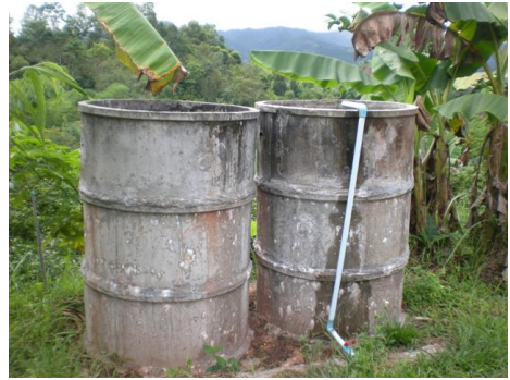
ภาคผนวกที่ ข.2 ถังเก็บน้ำในแปลงเกษตรกร