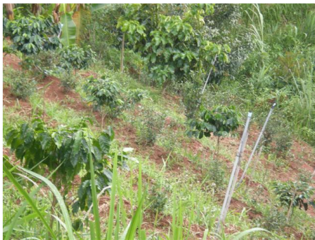
ภาคผนวกที่ ข.3 แปลงปลูกกาแฟของเกษตรกร