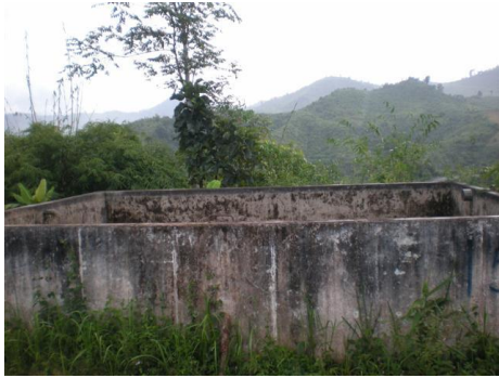
รูปภาคผนวกที่ ข.1 ถังพักน้ำขนาด 100 ลบ.ม.