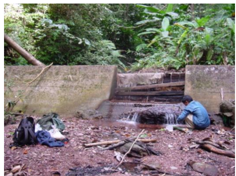
รูปภาคผนวกที่ ข.6 ฝายห้วยสาดี