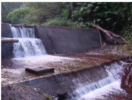
รูปภาคผนวกที่ ข.5 ฝายห้วยแป้น