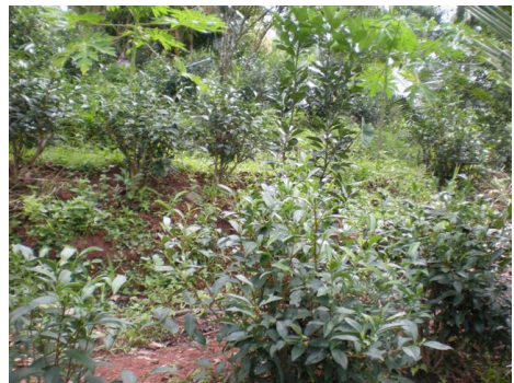
ภาคผนวกที่ ข.4 แปลงปลูกชาของเกษตรกร