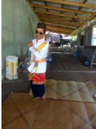
ภาพที่ 3 ทำแขกแดงยกเท้ามือตั้ง

ลักษณะหันทิศหน้าตรง มือปฏิบัติทำกำมือทั้งสองหลวม ๆ โดยมีมือขวาอยู่ระดับเอว มือซ้ายอยู่ระดับอกขวา กดเอวทางซ้าย ก้าวเท้าขวาไปด้านข้าง โดยเริ่มจากด้านขวา ยกเท้าซ้าย วางด้วยจุมกเท้า เอียงศีรษะทางซ้าย และปฏิบัติในท่าติดเท้า ตั้งมืออีก 1 ครั้ง โดยปฏิบัติตรงกันข้าม โดยท่านี้มีลักษณะแสดงถึงความกระฉับกระเฉง คล่องแคล่วของตัวแขกแดงเป็นที่ดึงดูดผู้ชมให้มาชมการแสดง ดังภาพ