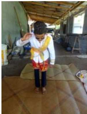
ภาพที่ 2 ท่าแขกแดงทำความเคารพ

ลักษณะวิ่งออกมาจากหลังเวทีทางด้านขวา แล้วยืนลักษณะหันทิศหน้าตรง มือซ้ายปฏิบัติท่ากำมือหลวม ๆ แนบกับลำตัว แขนงอเข้าหาศีรษะระดับหางคิ้ว เท้าทั้งสองปฏิบัติทำยืนเต็มเท้าแยกปลายเท้าห่างกันเล็กน้อย ก้มศีรษะเล็กน้อย พร้อมโน้มตัวไปด้านหน้า โดยทำนี้เป็นการทำความเคารพผู้ชมด้านหน้าเวทีก่อนจะเริ่มปฏิบัติทำต่อไป ดังภาพ