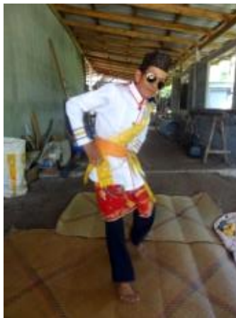
ภาพที่ 4 ทำแขกแดงก้าวเท้าสามเหลี่ยม

ลักษณะหันทิศหน้าตรง มือทั้งสองปฏิบัติทำมือเท้าเอว ก้าวเท้าซ้าย สลับกับเท้าขวา เอียงศีรษะทางซ้าย กดเอวทางซ้ายเดินเป็นสามเหลี่ยมโดยเริ่มจากเท้าขวาตามจังหวะ ดังภาพ