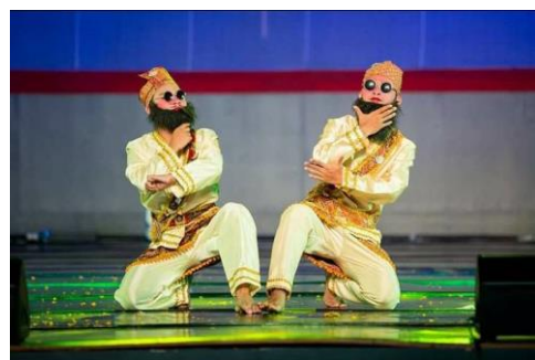
ภาพที่ 11 การแสดงสร้างสรรค์ชุดลีลาบังกาหลี่ วิทยาลัยนาฏศิลป์พัทลุง