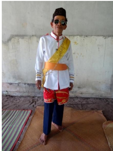
ภาพที่ 8 ลักษณะการแต่งกายของแขกแดง ลิเกป่าคณะ เต็นชัย สวงวนศิลป์ จังหวัดพัทลุง

หรือสีกรมท่าทับอีกที แขนวสร้อยประจำสีดำเส้นใหญ่ 1 - 2 เส้น เสริมจุมูกให้โตแบบแขกส่วนมาก มักทำด้วยไม้ทาสีแดง สวมหมวกแขกเรียกว่า “หมวกหนีบ” และใส่หนวดเครารุงรัง บางคณะ อาจนุ่งผ้าขาวเป็นเชิง สวมเสื้อแขนยาว มีผ้าโพกศีรษะแทนการสวมหมวก จะสวมถุงเท้า หรือไม่สวม ก็ได้เช่นกัน (คล่อง ห้วนแจ่ม, การสื่อสารส่วนบุคคล, 8 ตุลาคม 2563)