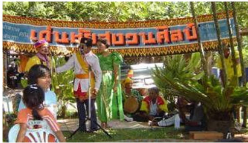
ภาพที่ 1 การแสดงลิเกป่าคณะเด่นชัย สวงศิลป์ จังหวัดพัทลุง

ช่วงที่ 5 ชมธรรมชาติ คือ ระหว่างที่เดินทาง แขกแดง และเหยี่ยวก็ได้ร้องชมธรรมชาติต่าง ๆ เช่น ปู หอย ปลา เกาะ และดาวต่าง ๆ จนเรือเทียบท่า