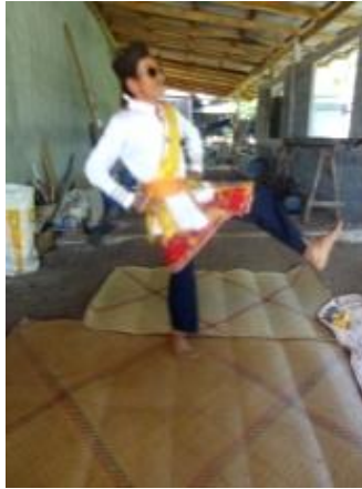
ภาพที่ 5 ทำแขกแดงกระโดดยกเท้า

หันหน้าทางซ้ายลักษณะเฉียง 45 องศา มือทั้งสองปฏิบัติทำมือเท้าเอว ยกเท้าซ้ายไปด้านหน้า พร้อมวาดไปด้านข้างซ้าย เท้าขวาวางเต็มเท้า หน้ามองเท้าที่ยกเอนตัวไปด้านหลัง กระโดดพร้อมสลับเท้าซ้ายขวายู่กับที่ โดยลักษณะทำนี้บอกถึงลักษณะของความสนุกสนานร่าเริง และความแข็งแรงของผู้แสดงในการกระโดดยกเท้า ดังภาพ