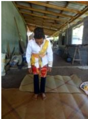
ภาพที่ 6 ทำแขกแดงตัวตรงก้มหน้า

ลักษณะหันทิศหน้าตรง มือทั้งสองปฏิบัติปล่อยมือแนบข้างลำตัว เท้าทั้งสองทำท่ายืนเต็มเท้า แยกปลายเท้าห่างกันเล็กน้อย ก้มศีรษะเล็กน้อย พร้อมโน้มตัวไปด้านหน้า ลักษณะทำนี้เป็นลักษณะท่าคล้ายทำความเคารพผู้ชมอีกครั้งก่อนที่จะถึงท่าสุดท้ายในการเต้นออกแขกแดง ดังภาพ