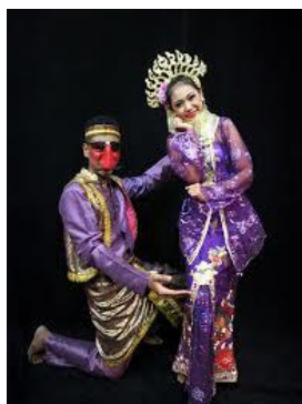
ภาพที่ 10 การแสดงสร้างสรรค์ชุดแขกแดงเกี้ยวพาราสี วิทยาลัยนาฏศิลป์นครศรีธรรมราช

โดยวิทยาลัยนาฏศิลป์นครศรีธรรมราช และวิทยาลัยนาฏศิลป์พัทลุง ซึ่งเป็นสถานศึกษาที่ส่งเสริมอนุรักษ์ และเผยแพร่ศิลปวัฒนธรรมของทางภาคใต้โดยตรง จึงได้เล็งเห็นถึงปัญหาและความสำคัญดังกล่าว จึงได้คิดริเริ่มสร้างสรรค์นำเอาบุคลิก รูปแบบ อัตลักษณ์ และท่าเต้นแบบดั้งเดิม ของคณะลิเกป่าเด่นชัย สวงวนศิลป์ มาเป็นข้อมูลพื้นฐานในการสร้างสรรค์ประดิษฐ์ท่าแบบใหม่ให้มีความน่าตื่นตาตื่นใจ และสร้างความน่าสนใจให้แก่ตัวแขกแดง หรือตลกซูโรงมากยิ่งขึ้น ซึ่งชุดการแสดงดังกล่าวก็คือ การแสดงสร้างสรรค์ชุดแขกแดงเกี้ยวพาราสีโดยวิทยาลัยนาฏศิลป์นครศรีธรรมราช และการแสดงสร้างสรรค์ชุดลีลาบังกาหลี่ โดยวิทยาลัยนาฏศิลป์พัทลุง ดนตรีที่ใช้ประกอบการแสดงทั้งสองชุด ได้มีการสร้างสรรค์โดยใช้ทำนองเพลงผสมผสานกันระหว่างดนตรีพื้นบ้านภาคใต้ตอนบน และภาคใต้ตอนล่าง และได้อนุรักษ์รูปแบบการแต่งกายของผู้แสดงแบบดั้งเดิม เพียงแต่จะมีการตกแต่งสีสันทันเพื่อความสวยงาม ทั้งนี้เพื่อให้เป็นที่น่าสนใจ และความสมบูรณ์แบบในการแสดงสร้างสรรค์นี้ เป็นการสร้างคุณค่าให้แก่ศิลปะการแสดงชนิดนี้ รวมถึงเป็นการต่อยอดให้การแสดงลิเกป่าในจังหวัดพัทลุง คณะเด่นชัย สวงวนศิลป์ ที่ยังคงเอกลักษณ์ของการเต้นแขกแดง หรือตลกซูโรง ให้คนโดยทั่วไปได้รู้จัก ศิลปะการแสดงลิเกป่ามากขึ้น อีกทั้งเป็นการรักษารากเหง้าของวัฒนธรรมของการแสดงแขนงนี้ไว้