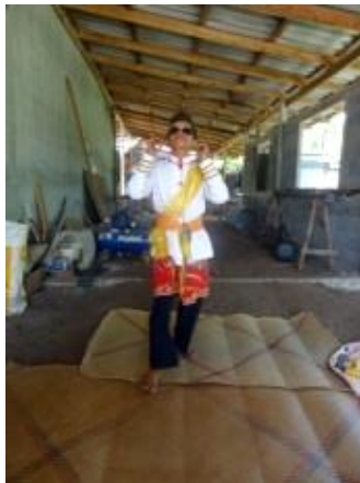
ภาพที่ 7 ทำแขกแดงยกแขนแหงนหน้า

ลักษณะหันทิศหน้าตรง มือทั้งสองปฏิบัติทำกำมือหลวม ๆ งอแขนเข้าหาลำตัวระดับไหล่ ถอนเท้าซ้าย เท้าขวายังคงวางเต็มเท้า เปิดปลายกางแขนหน้าขึ้น พร้อมเอนตัวไปด้านหลัง โดยลักษณะทำนี้บอกถึงความสง่างามของตัวแขกแดง และเป็นท่าลำดับสุดท้ายของการเดินออกแขกแดงก่อนจะกลับเข้าหลังเวที ดังภาพ