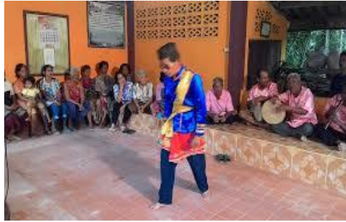
ภาพที่ 9 การสาธิตการออกแขก และการเต้นแขกแดง

ได้แก่ วิทยาลัยนาฏศิลป์พัทลุง โรงเรียนอนุบาลพัทลุง โรงเรียนอุดมวิทยายน โรงเรียนควนขนุน เพื่อสาธิตให้แก่บุคคลในหน่วยงานทางราชการ ครูอาจารย์ นักเรียน นักศึกษา ตลอดจนนักวิชาการ ในท้องถิ่นได้ศึกษาองค์ความรู้ และลักษณะการเต้นแขกแดง ของคณะลิเกป่า เด่นชัย สวงวนศิลป์ จังหวัดพัทลุง (คล่อง ห้วนแจ่ม, การสื่อสารส่วนบุคคล, 8 ตุลาคม 2563)