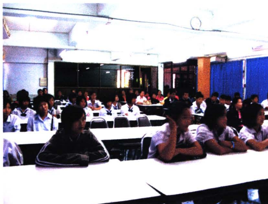
การนำเสนอข้อมูลสู่โรงเรียน