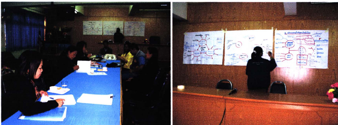
การรวบรวมและวิเคราะห์ข้อมูล

สิ่งที่ได้เรียนรู้ร่วมกันคือ ช่วงของการรวบรวมและวิเคราะห์ข้อมูลทำให้ทีมวิจัยตระหนักและเห็นความสำคัญของข้อมูลมากขึ้น เนื่องจากถ้าข้อมูลไม่ครบถ้วน สมบูรณ์ อาจทำให้ไม่สามารถวิเคราะห์และตอบคำถามการวิจัยได้