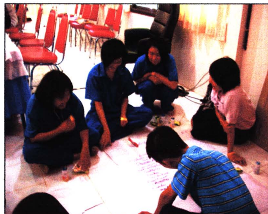
กิจกรรมการรวบรวมและเติมเต็มข้อมูลของกลุ่มนักเรียน