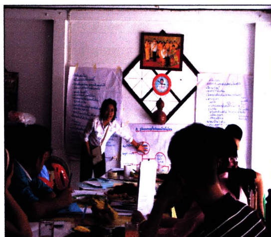
กิจกรรมสร้างเครื่องมือวิจัย