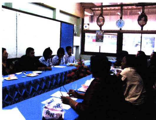
ภาพเวทีสร้างความเข้าใจกับโรงเรียน