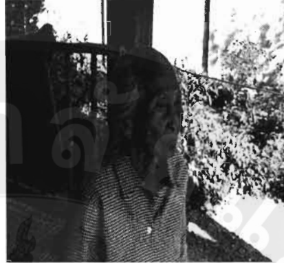
ภาพที่ 23 แม่อุ๊ยฟอง อายุ 71 ปี บ้านเลขที่ 1 บ้านช่อแล ตำบลช่อแล แม่อุ๊ยคำมูล จันทิมา อายุ 90 ปี บ้านสันป่าสัก ตำบลช่อแล

แม่เฒ่าฟอง และแม่อุ๊ยคำมูล ชาวชุมชนช่อแล เล่าถึงประวัติความเป็นมาของคนช่อแลว่าเป็นคนช่อแลโดยกำเนิด พ่อแม่อยู่ที่ช่อแล สมัยก่อนทำงานรับจ้าง เช่น เก็บหอม ตัดหอม ปัจจุบันแก่แล้ว อยู่กับลูกหลาน