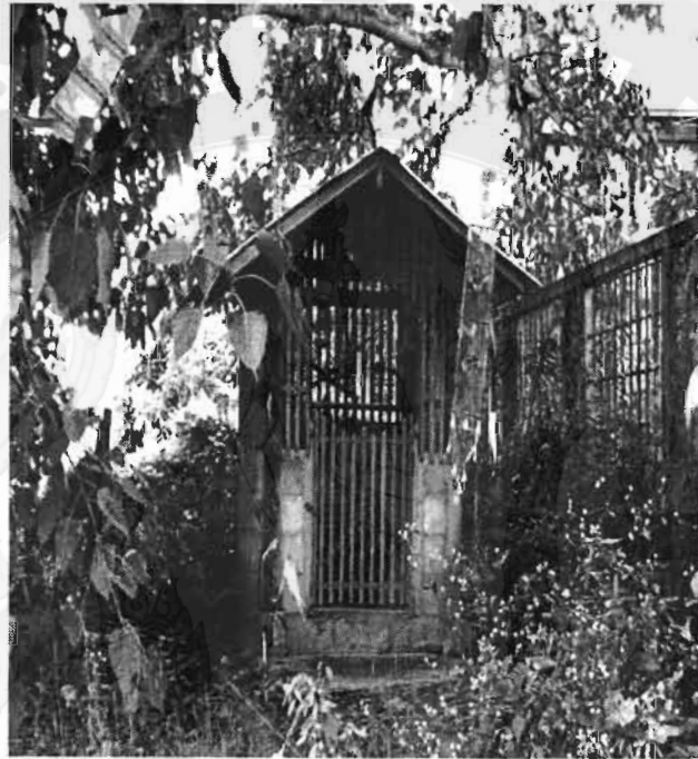
ภาพที่ 20 หอเสื่อบ้านสันป่าตองของชาวลำปาง ที่หัวบ้านสันป่าตอง ตำบลอินทขิล

ที่ทำกินจากชาวบ้านเดิมที่อยู่ที่นี่ รวมทั้งมาบุกเบิกที่ใหม่ และได้นำอาระบบเครือญาติ ผ่านการนับถือผีบ้านผีเมือง ตลอดจนซื้อบ้านนามเมืองมาด้วย เช่น ชุมชนบ้านสันป่าตอง หัวดง หางดง หนองออน มีดกา ทำเคื่อ เป็นต้น ชุมชนเหล่านี้ล้วนอพยพมาจากเชียงใหม่ ลำพูน และลำปางทั้งสิ้น