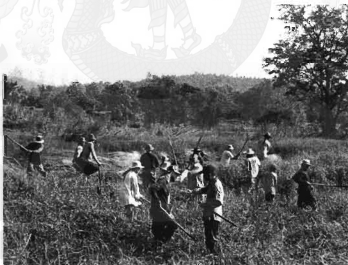
ภาพที่ 31 เขตพื้นที่ล่องเหมืองของชาวบ้านป่าจี้ หมู่ 1

ระบบเหมืองฝายน้ำปิงลูกล่าง มีการจัดการโดยอาศัยชาวบ้านในท้องถิ่นเป็นหลักสำคัญและคงรูปแบบดั้งเดิมได้ในระดับหนึ่ง โดยมีการจัดการอย่างเป็นระบบ ได้แก่ การจัดการเรื่องการเงินและบัญชี การจัดสรรแรงงาน การควบคุมระบบน้ำ การซ่อมบำรุงเหมืองฝาย การแก้ไขปัญหาเรื่องน้ำขาดแคลน รวมถึงการใกล้เคียงกรณีพิพาทต่างๆ ของลูกเหมือง และพิธีกรรมของเหมือง