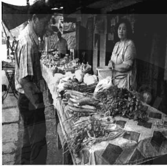
ภาพที่ 34 สภาพตลาดชุมชนและการปลูกผักขายเองในชุมชนบ้านช่อแล อ.แม่แตง จ.เชียงใหม่