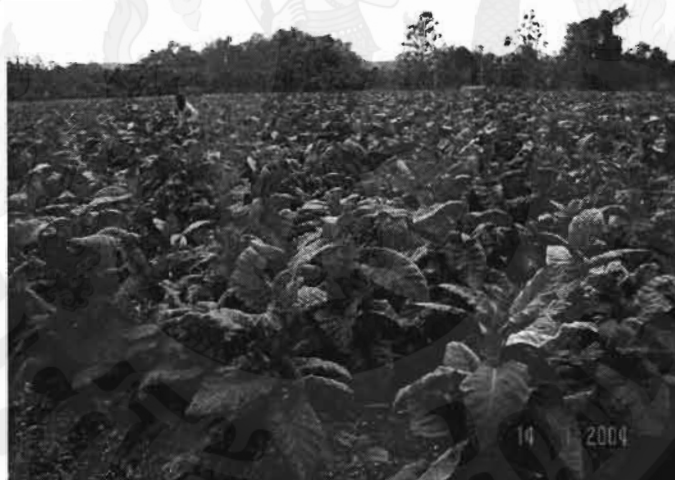
ภาพที่ 32 – 33 การผลิตกระเทียมและยาสูบในบ้านแม่หอพระ อ.แม่แตง จ.เชียงใหม่