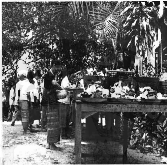
ภาพที่ 19 “พิธีขึ้นธาตุ”: พื้นฐานระบบเครือข่ายความสัมพันธ์ในชุมชนเขตภาคเหนือตอนบน