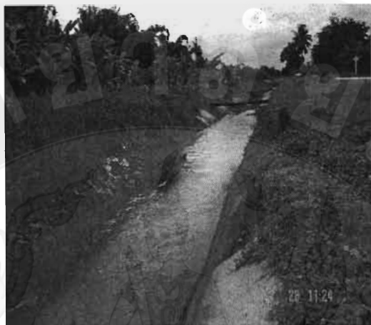
ภาพที่ 30 คลองส่งน้ำชลประทานบริเวณ บ้านเด่น ต.อินทนิล อ.แม่แตง

เปลี่ยนแปลงเมืองส่งน้ำเป็นแบบชลประทานแล้ว ทางปลายน้ำจะประสบปัญหาการขาดแคลนน้ำ เนื่องจากคลองส่งน้ำชลประทานมีขนาดมาตรฐานและค่อนข้างแคบ ไม่เพียงพอต่อการเพาะปลูกในพื้นที่ชุมชนเมืองแกน