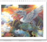
ผ้าบาติก