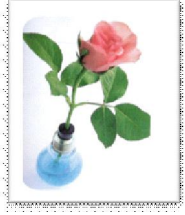
ภาชนะใส่ดอกไม้หน้าเพื่อน