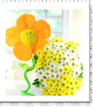
ดอกไม้เกสรหน้าเพื่อน