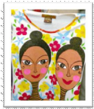
เสืยัดลงสี