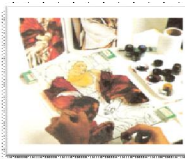
กระจกลงสี