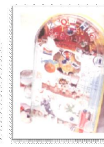
ปาจิงโกหน้าเพื่อน

22 ท่านมีความคิดเห็นเกี่ยวกับสินค้าและบริการของทางร้านอย่างไร