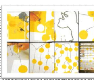
มาลัยโปร่งแสงหน้าเพื่อน