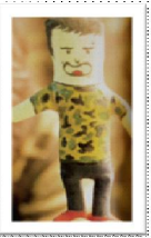
ตุ๊กตาหน้าเพื่อน