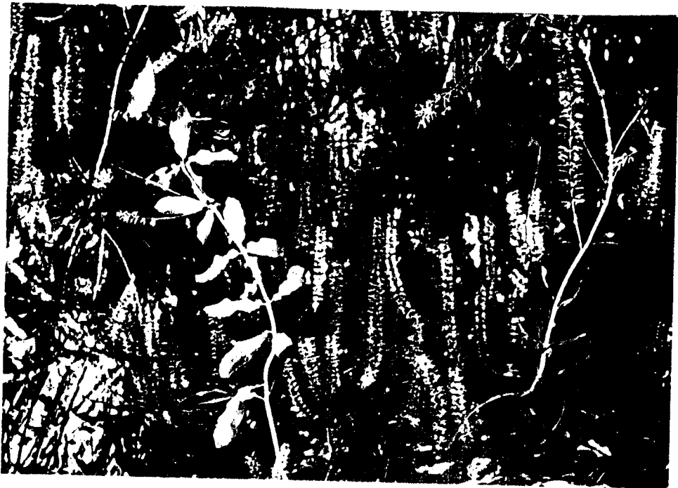
ภาพที่ 3 การออกดอกของมกาดเคเวียท์