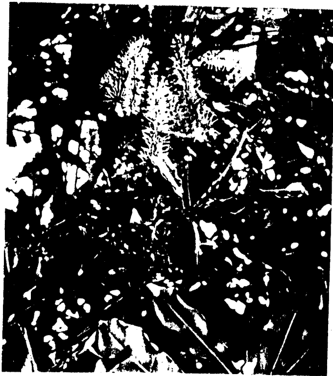
ภาพที่ 4 การติดผลของนากาเดเมีย