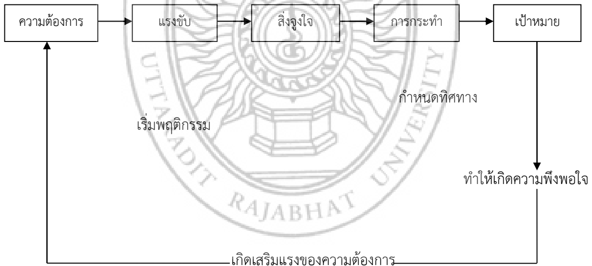
ภาพที่ 3 แผนภาพแสดงที่มาของแรงจูงใจ

2.4 เครื่องล่อใจอื่น ๆ มีสิ่งล่อใจหลายอย่างที่ทำให้เกิดแรงกระตุ้นให้เกิดพฤติกรรมขึ้นเช่น การให้รางวัล (Rewards) อันเป็นเครื่องกระตุ้นให้อยากกระทำหรือการลงโทษ (Punishment) ซึ่งจะกระตุ้นมิให้กระทำในสิ่งที่ไม่ถูกต้อง นอกจากนี้การชมเชย การติเตียน การประหวัด การแข่งขันหรือการทดสอบก็จัดว่าเป็นเครื่องมือที่ทำให้เกิดพฤติกรรมได้ทั้งสิ้น ดังแผนภาพที่แสดงดังต่อไปนี้