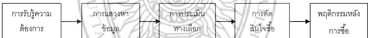
ภาพที่ 2 แผนภาพแสดงกระบวนการในการตัดสินใจซื้อของผู้บริโภค

5. พฤติกรรมภายหลังการซื้อ (Post Purchase Behavior) คือพฤติกรรมของลูกค้ำที่แสดงออกหลังการซื้อสินค้า ผู้บริโภคมีโอกาสจะรู้สึกพึงพอใจหรือไม่พอใจได้ ดังนั้นเกณฑ์การตัดสินว่าลูกค้ำที่มีความพอใจในการซื้อ สามารถพบอยู่ในความสัมพันธ์ระหว่าง ความคาดหวังของผู้บริโภคและประสิทธิภาพของการรับรู้ของลูกค้ำ โดยหากผลิตภัณฑ์มีประโยชน์ไม่ตรงกับความคาดหวังของลูกค้ำจะทำให้เกิดความผิดหวัง แต่หากผลิตภัณฑ์มีประโยชน์ตรงกับสิ่งที่ลูกค้ำหวังไว้ก็จะเกิดความพึงพอใจ และหากผลิตภัณฑ์ให้ประโยชน์เกินความคาดหวังลูกค้ำจะทำให้ รู้สึกยินดี พพอใจมาก โดยยิ่งช่องว่างระหว่างความคาดหวังและประโยชน์จากการใช้งานจริงใหญ่แค่ไหน ความไม่พอใจของลูกค้ำก็จะมากขึ้นเท่านั้น ดังแผนภาพที่แสดงดังต่อไปนี้