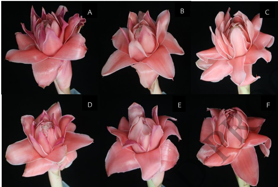
Figure 2 Torch Ginger solution vase life days 5 at 25°C (80% RH).