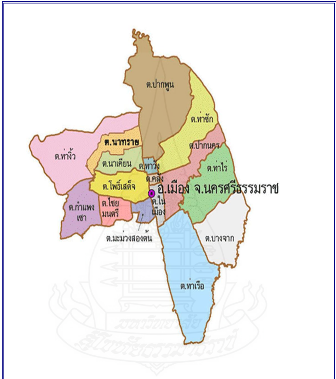
ภาพที่ 2.2 แผนที่อำเภอเมืองนครศรีธรรมราชแบ่งตามเขตตำบล