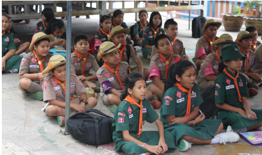
ภาพที่ 4.11 การแต่งชุดลูกเสือ เนตรนารี ของนักเรียน โดยนักเรียนบางคนลืมนำหมวกมา

คณะผู้วิจัยได้กระตุ้นให้ผู้ปกครองกำชับเรื่อง เรื่องการแต่งกายของนักเรียน โดยการสัมภาษณ์ชุดที่นักเรียนแต่งไม่เรียบร้อยที่สุด คือ ชุดลูกเสือ ในวันพฤหัสบดี ผู้วิจัยได้ชี้แจงการแต่งการที่ถูกระเบียบให้แก่ผู้ปกครองได้รับทราบ ผู้ปกครองท่านหนึ่งกล่าวว่า “วันพฤหัสบดีที่เขารับเวลาารถผู้มารอรับหน้าโรงเรียน พอเขารับ ก็ลืมนำหมวกมา ลืมนั่นลืมนี่ ไม่ค่อยเรียบร้อย” ผู้วิจัยจึงแนะนำว่า ให้ผู้ปกครองเตือนนักเรียนให้เตรียมเครื่องแต่งกายและเครื่องหมายต่างๆ ตั้งแต่กลางคืน ไม่ต้องเตรียมตอนเช้า เพราะอาจจะเตรียมไม่ทัน