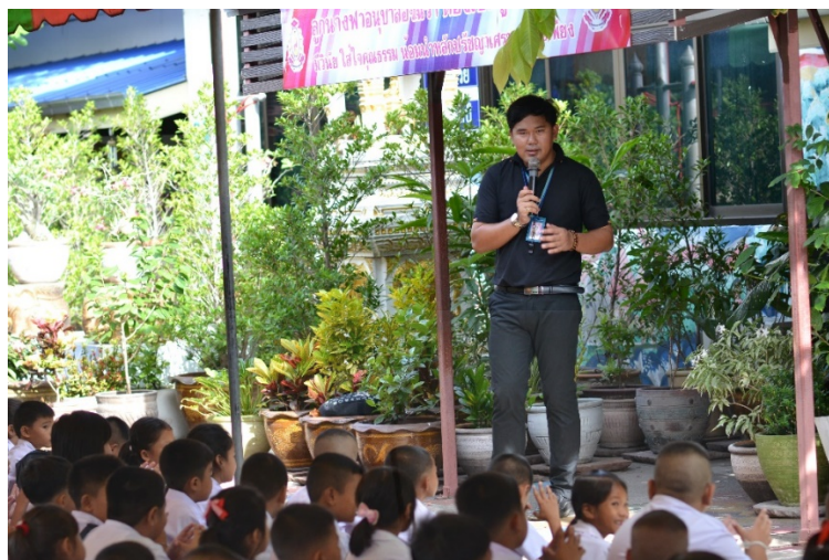
ภาพที่ 4.2 การอบรมนักเรียนหน้าเสาธงทุกวัน จันทร พุศ ศุภร์

จากการทำกิจกรรมอบรมหน้าเสาธงนั้น ครูเวรประจำวันได้ให้ความเห็นว่า “อบรมหน้าเสาธงทุกวัน นักเรียนที่ฟังก็ตั้งใจฟัง ตั้งใจปฏิบัติตาม คนที่ไม่ฟังก็ไม่ฟัง ต้องคอยเตือนให้ฟังทุกวัน บางครั้งก็ต้องเรียกร้องความสนใจบ้าง พูดติดตลกบ้าง ประมอบ้าง เด็กๆจะได้สนใจ จะได้ไม่เครียดเกินไป อย่างน้อยเขาจะได้ฟังเรา” จึงทำให้เห็นว่า กิจกรรมการอบรมนักเรียนหน้าเสาธง คุณครูต้องคอยเตือนและกระตุ้นให้นักเรียนตั้งใจฟังและดึงดูดความสนใจเสมอ เพราะหากพูดเรื่องเดิมๆทุกวันด้วยน้ำเสียงที่ตึงเครียดจนเกินไป อาจจะส่งผลให้นักเรียนไม่รับฟังเนื้อหาการอบรม