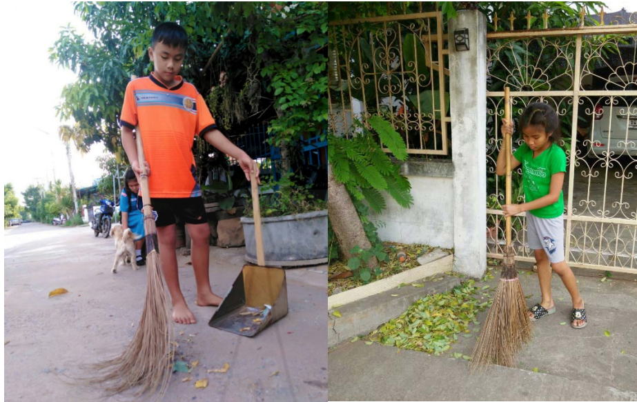
ภาพที่ 4.9 นักเรียนทำความสะอาดบริเวณที่รับผิดชอบ ในบ้านของตนเอง

2.5 กิจกรรมเยี่ยมบ้าน เป็นกิจกรรมที่ทำให้ผู้วิจัย และผู้ปกครองได้พูดคุยกัน สอบถามถึงสภาพความเป็นอยู่ การมีวินัยด้านความรับผิดชอบต่อหน้าที่ของนักเรียนที่มีต่อพื้นที่บริเวณบ้านของตนเอง ผู้วิจัยได้กำหนดขั้นตอนและวิธีการดำเนินงานกิจกรรมการเยี่ยมบ้าน โดยได้ดำเนินกิจกรรม ดังนี้