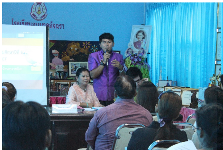
ภาพที่ 4.1 การประชุมผู้ปกครอง ระดมความคิด

ที่ประชุมได้มีการแสดงความคิดเห็นอย่างหลากหลายและมีความเห็นร่วมกันว่าให้ใช้กลยุทธ์ดังกล่าวได้