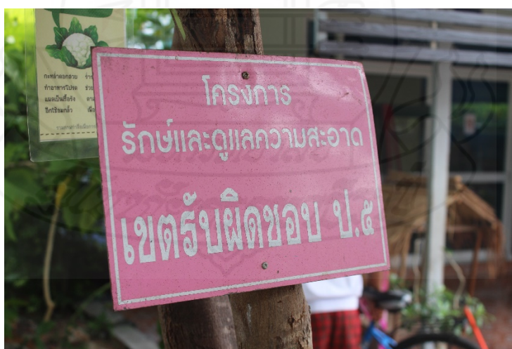
ภาพที่ 4.7 เขตพื้นที่รับผิดชอบ ของนักเรียนชั้นประถมศึกษาปีที่ 5