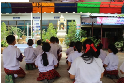
ภาพที่ 4.4 การดำเนินกิจกรรมสัญญาใจ