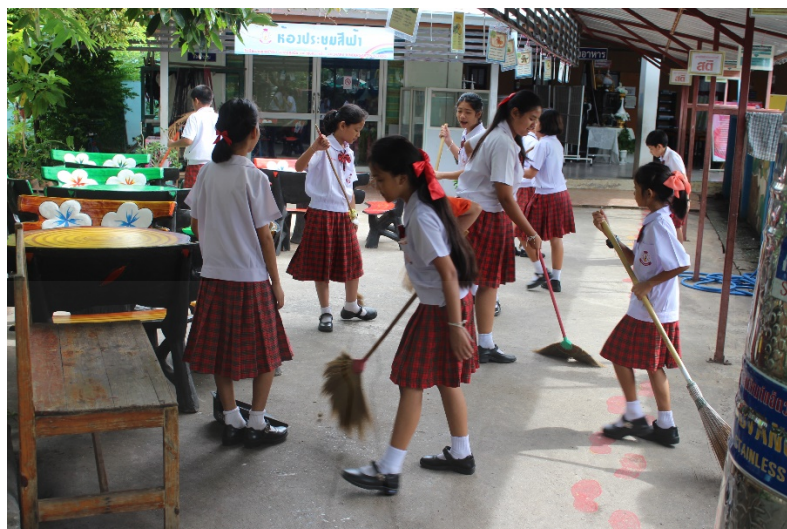
ภาพที่ 4.8 การลงจุดพื้นที่พัฒนา บริเวณเขตรับผิดชอบในโรงเรียน

ผลการดำเนินงานกิจกรรมลงจุดพื้นที่พัฒนา ตั้งแต่วันที่ 25 ธันวาคม 2559 ถึง 29 มกราคม 2560 ปรากฏว่านักเรียนกลุ่มเป้าหมายในช่วงแรก ผู้วิจัย ต้องออกคำสั่งในการให้ลงจุดพื้นที่พัฒนา จากการสอบถามครูประจำชั้น ซึ่งเป็นผู้ร่วมวิจัย ได้กล่าวว่า “ต้องคอยบอกทุกวันนี้แหละจริงๆ เรามีเวลาที่กำหนดให้ไปทำความสะอาด ทั้งตอนเช้า ตอนเที่ยง ตอนเย็น แต่ครูก็ต้องบอกต้องบังคับให้ไปทำความสะอาดกัน” ผู้วิจัยคอยกระตุ้นทุกคนจนนักเรียนมีความกระตือรือร้นในการทำกิจกรรม สามารถปฏิบัติตนให้เป็นผู้มีระเบียบวินัย มีความรับผิดชอบในการทำความสะอาดในเขตพื้นที่ที่ตนเองรับผิดชอบโดยต้องมีการติดตามหรือออกคำสั่งทุกครั้ง มีการพัฒนาวินัยของตนเองในทิศทางที่ดีขึ้น เป็นจำนวน 18 คน จากนักเรียนกลุ่มเป้าหมายทั้งหมด 20 คน คิดเป็นร้อยละ 90 ของนักเรียนกลุ่มเป้าหมายทั้งหมด