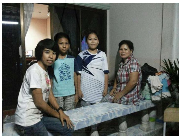
ภาพที่ 4.10 การเยี่ยมบ้านนักเรียน

สารสนเทศของนักเรียนกลุ่มเป้าหมายโดยสรุปผลสภาพความเป็นอยู่ของนักเรียนกลุ่มเป้าหมายได้ ข้อมูลว่า เป็นนักเรียนที่อาศัยอยู่กับญาติเนื่องจากผู้ปกครองไปทำงานต่างจังหวัดคิดเป็นร้อยละ 45 อาศัยอยู่กับญาติเนื่องจากผู้ปกครองหย่าร้างหรือเสียชีวิต คิดเป็นร้อยละ 3 อาศัยอยู่กับบิดามารดา คิดเป็นร้อยละ 40 อาชีพของผู้ปกครองของนักเรียนกลุ่มเป้าหมาย แบ่งออกเป็น รับราชการ คิดเป็นร้อยละ 15 อาชีพค้าขาย คิดเป็นร้อยละ 40 อาชีพรับจ้าง คิดเป็นร้อยละ 45 ของนักเรียนกลุ่มเป้าหมายทั้งหมด รายได้ของผู้ปกครองนักเรียนกลุ่มเป้าหมายแบ่งออกเป็น รายได้มากกว่า 30,000 บาทต่อเดือน คิดเป็นร้อยละ 25 รายได้ 10,000 - 20,000 บาท ต่อเดือน คิดเป็นร้อยละ 35 และรายได้ต่ำกว่า 10,000 บาท คิดเป็นร้อยละ 40 ของนักเรียนกลุ่มตัวอย่างทั้งหมด