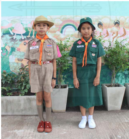
ภาพที่ 4.12 การแต่งกายชุดลูกเสือ เนตรนารี ของนักเรียน

คณะผู้วิจัยได้กระตุ้นให้ผู้ปกครองกำชับเรื่อง เรื่องการแต่งกายของนักเรียน โดยการสัมภาษณ์ชุดที่นักเรียนแต่งไม่เรียบร้อยที่สุด คือ ชุดลูกเสือ ในวันพฤหัสบดี ผู้วิจัยได้ชี้แจงการแต่งการที่ถูกระเบียบให้แก่ผู้ปกครองได้รับทราบ ผู้ปกครองท่านหนึ่งกล่าวว่า “วันพฤหัสบดีที่เขารับเวลาารถผู้มารอรับหน้าโรงเรียน พอเขารับ ก็ลืมนำหมวกมา ลืมนั่นลืมนี่ ไม่ค่อยเรียบร้อย” ผู้วิจัยจึงแนะนำว่า ให้ผู้ปกครองเตือนนักเรียนให้เตรียมเครื่องแต่งกายและเครื่องหมายต่างๆ ตั้งแต่กลางคืน ไม่ต้องเตรียมตอนเช้า เพราะอาจจะเตรียมไม่ทัน