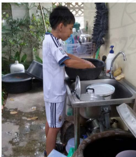
ภาพที่ 4.14 นักเรียนช่วยงานพ่อแม่