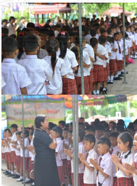
ภาพที่ 4.6 กิจกรรมน้องเคารพพี่ พี่เคารพครู

กิจกรรมนี้ผู้วิจัยได้สังเกตกลุ่มเป้าหมาย 20 คน ทำความเคารพกันระหว่างน้อง พี่ และครู หลังทำกิจกรรมเคารพธงชาติ โดยเริ่มเก็บรวบรวมข้อมูลตั้งแต่ วันที่ 23 พฤศจิกายน 2559 ถึง 20 มกราคม 2560 โดยผู้ร่วมวิจัย 2 คน คือ ครูประจำชั้นประถมศึกษาปีที่ 5 มีนักเรียน กลุ่มเป้าหมาย 20 คน ที่ผ่านการคัดกรองพฤติกรรมวินัยมาแล้ว