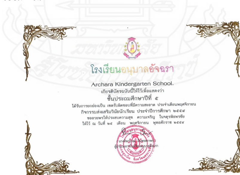
ภาพที่ 4.17 ใบประกาศยกย่องเขตรับผิดชอบที่สะอาด

จากการดำเนินกิจกรรมประชุมระดมสมองเพื่อศึกษาสภาพปัญหาและได้กลยุทธ์ในการจะพัฒนา โดยใช้กิจกรรมอบรมนักเรียนหน้าเสาธงตอนเช้า โดยครูเวรประจำวันได้อบรมเน้นย้ำในการทำทำความสะอาดบริเวณที่รับผิดชอบในโรงเรียนเป็นประจำ และใช้กิจกรรมลงจุดพื้นที่พัฒนาโดยครูประจำชั้นและผู้วิจัยได้นำนักเรียนลงจุดพื้นที่ ทำความสะอาดเป็นประจำ โดยช่วงแรกครูพานักเรียนทำ ในช่วงเวลาต่อมาให้นักเรียนลงจุดพื้นที่ทำเอง โดยครูจะคอยเตือน จากการทำกิจกรรมนักเรียนมีความใส่ใจที่จะทำมากขึ้นเรื่อยๆ เนื่องจากกิจกรรมการนิเทศและเสริมแรงคอยกระตุ้นอยู่เรื่อยๆ นักเรียนเกิดการแข่งขันที่จะได้รับรางวัลความสะอาด จึงตั้งใจและสนใจทำมากขึ้น จากคำพูดของนักเรียนกลุ่มเป้าหมายคนหนึ่งว่า “ต้องทำความสะอาดทุกวันครับ ผมอยากให้ห้องได้รับรางวัลบ้าง กวาดทุกวัน แต่ก็สัปดาห์ทุกวันครับ ไม่รู้ใครทิ้ง แต่ห้องผมก็ทำทุกวันนะครับ” จะเห็นได้ว่าการกระตุ้นนักเรียน การเสริมแรงนักเรียนด้วยการยกย่องชมเชย ทำให้นักเรียนมีความตั้งใจ และมีความรับผิดชอบมากขึ้น