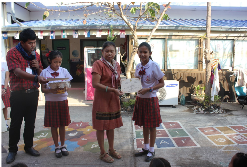
ภาพที่ 4.16 กิจกรรมเสริมแรง มอบเกียรติบัตรให้กับนักเรียน

ตารางที่ 4.3 ปฏิทินการเสริมสร้างวินัยนักเรียนด้านความรับผิดชอบ โรงเรียนอนุบาลอัจฉรา