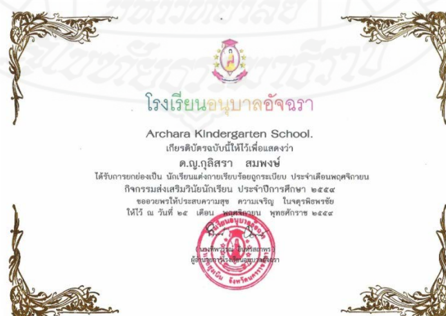
ภาพที่ 4.15 ใบประกาศเกียรติคุณยกย่องนักเรียนที่แต่งกายถูกระเบียบ

ผู้วิจัยได้มีกิจกรรมในการกระตุ้น และสร้างแรงจูงใจ ให้กับนักเรียน โดยนำผลการนิเทศ กำกับ ติดตาม มาวิเคราะห์และจัดกิจกรรมเสริมแรงโดย กล่าวคำชมเชยนักเรียนกลุ่มเป้าหมาย และการมอบเกียรติบัตร ให้เป็นแบบอย่างแก่นักเรียน ในเรื่องการแต่งกาย ที่ถูกระเบียบ การแสดงความเคารพอย่างสม่ำเสมอ จากการสัมภาษณ์ความรู้สึกของนักเรียนที่ได้รับรางวัลคนหนึ่ง กล่าวว่า “รู้สึกดีใจนะที่ได้รับรางวัลแต่งกายถูกระเบียบของเดือนนี้ หนูต้องเป็นแบบอย่างให้น้องๆ ด้วยนะ” และการดูแลความสะอาดบริเวณเขตรับผิดชอบ ผู้วิจัยได้กระตุ้นโดยการมอบรางวัล ให้กับเขตรับผิดชอบที่มีความสะอาดยอดเยี่ยม โดยกำหนดให้เป็นชั้นเรียน และให้หัวหน้าห้องเป็นตัวแทนรับใบประกาศเกียรติคุณ โดยดำเนินกิจกรรม ในระหว่างวันที่ 25 ธันวาคม 2559 – 18 มีนาคม 2560