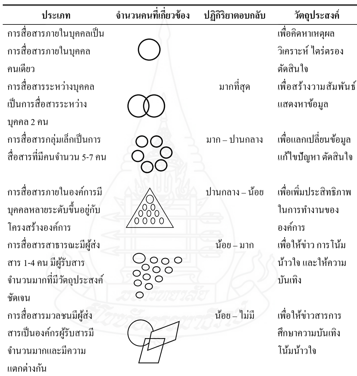
ตารางที่ 2.1 ประเภทการสื่อสาร

ที่มา: ชีวรักษ์ โพธิ์สุวรรณ (2552 น. 142)