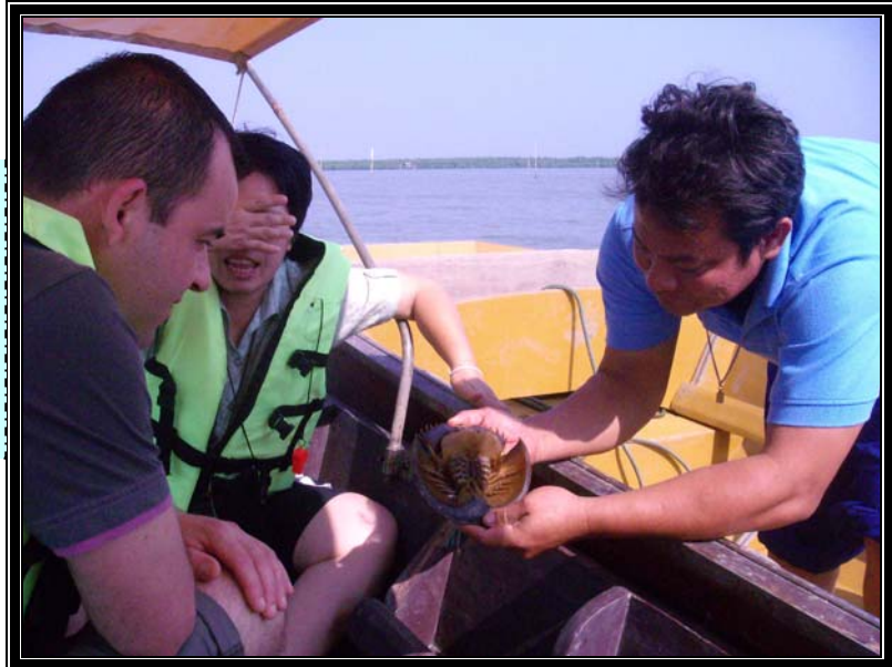
Figure 6. Approche du mode de vie des pêcheurs

Approche du mode de vie des pêcheurs à Bann Khlong Khon.