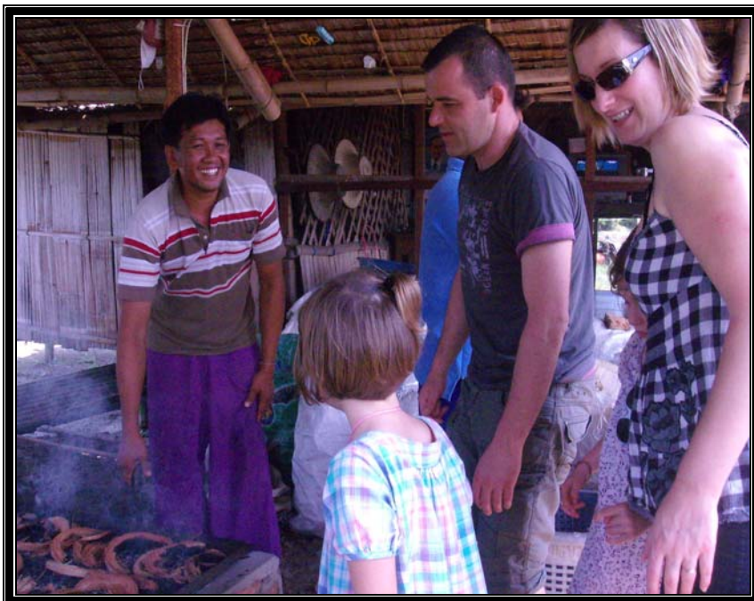
Figure 13. A la maison des desserts traditionnels thaï

La maison des desserts: les touristes assistent à la préparation et à la cuisson de plusieurs desserts thaïs.