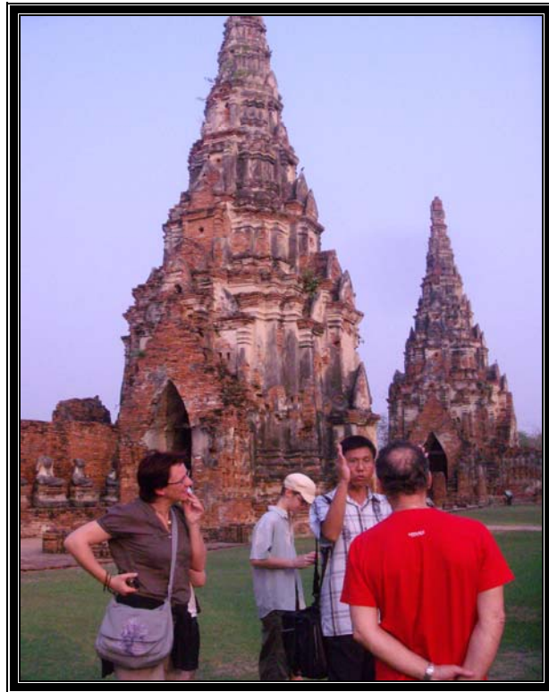
Figure 14. Visite de Wat Chai Wattanaram