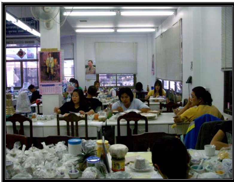
Figure 4. L'usine des porcelaines aux cinq couleurs

L'usine de porcelaine « cinq couleurs » ou « Benjarong », aussi appelé Pinsuwan Benjarong