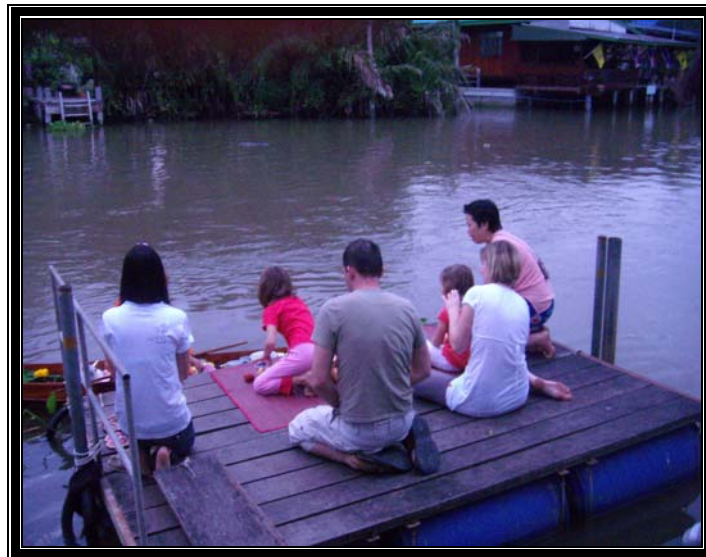
Figure 12. Les offrandes aux moines

Les touristes se sont enthousiasmés pour les offrandes matinales aux moines.