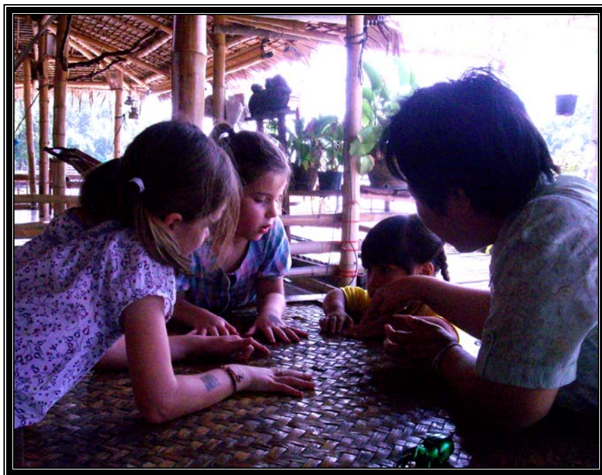
Figure 8. Les enfants apprennent le Jam Jee

Le guide invite les enfants à jouer à un jeu thaï qui consiste à chanter la chanson de Jam Jee , tout en comptant les doigts des joueurs.