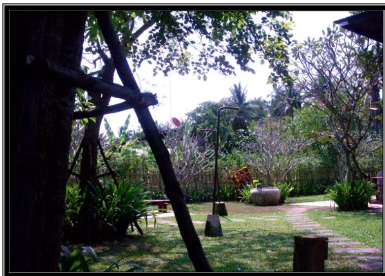
Figure 2. Le jardin du logement

Le petit jardin sert à cultiver des fruits. Il est considéré comme un bien matériel.