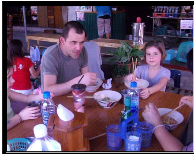
Figure 10. Les clients au restaurant

Difficulté d'adaptation des jeunes enfants à la nourriture locale.