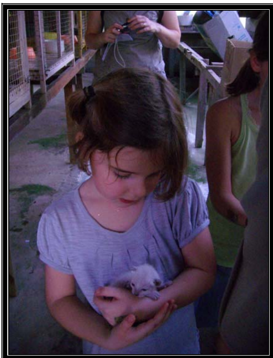
Figure 11. A la maison des chats siamois

Intérêt des enfants pour les chatons siamois de la maison des chats siamois.