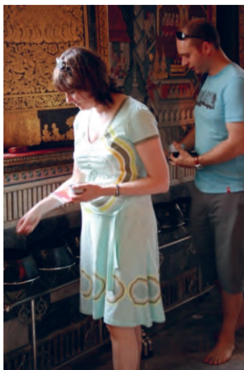
Figure 4 Offrande de pièces de monnaie dans les bols de moines au Wat Pho.