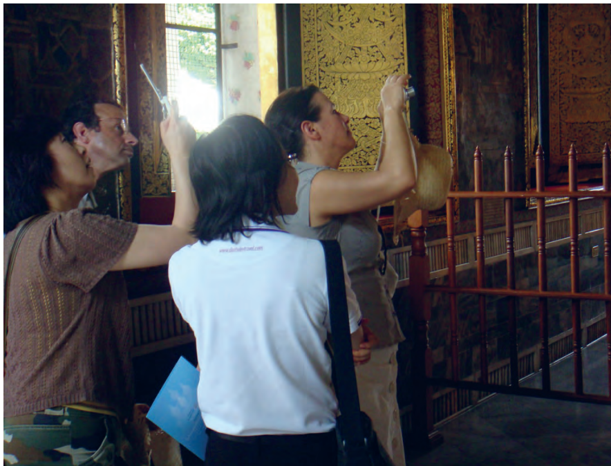
Figure 6 Le guide parle de la statue du Bouddha couché au Wat Pho