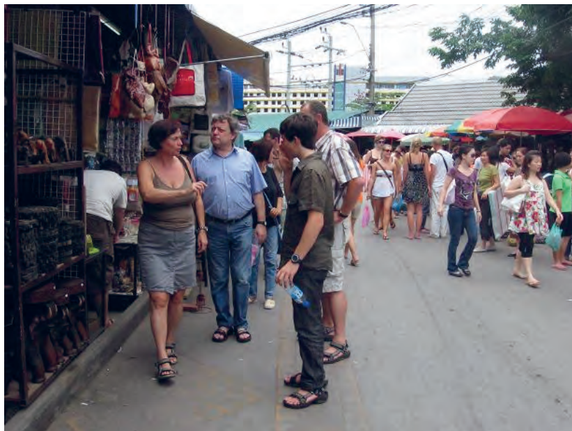
Figure 3 Le marché Chatuchak