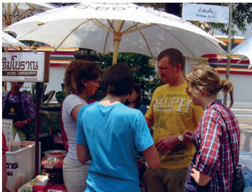
Figure 8 Les touristes ont goûté des boissons d'une base d'herbes au Wat Pho