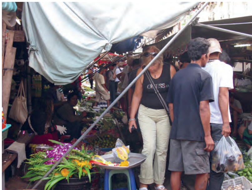
Figure 5 Visite du marché de Mahachai à Samut Sakhon