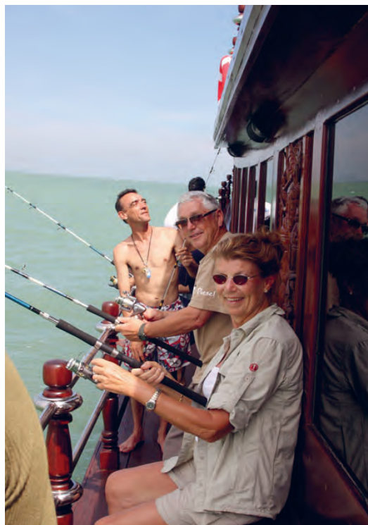
Figure 10 Les touristes se sont bien amusés à pêcher sur le bateau à Prachuab Kirikhan.