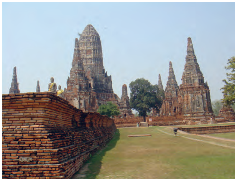
Figure 2 Wat Chai Watthanaram