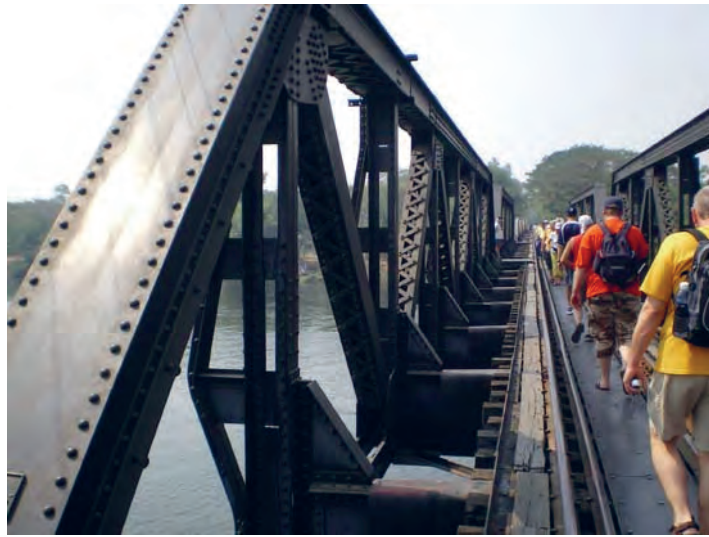
Figure 9 Visite du pont de la rivière Kwai