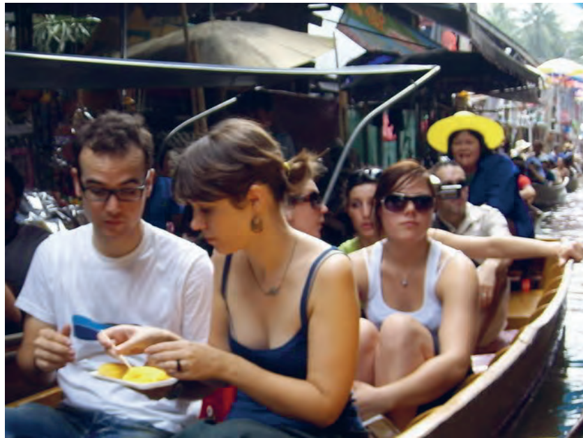
Figure 7 Visite du marché flottant à Damnoen Saduak