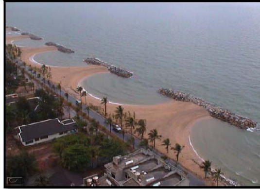
ภาพที่ 2-12 เขื่อนป้องกันคลื่นนอกชายฝั่งแบบพันทันร่วมกับการถมทรายเสริมชายหาด บริเวณหาดแสงจันทร์ จังหวัดระยอง

ปานกลาง โดยเฉลี่ยความยาวของเขื่อน 120 เมตร ระยะห่างระหว่างเขื่อน 80 เมตร และแนวสันเขื่อนอยู่ที่ระดับน้ำ (+) 2 เมตร จากระดับน้ำทะเลปานกลาง ทั้งนี้ การออกแบบที่เหมาะสมจะเป็นอย่างไรขึ้นอยู่กับสภาพภูมิประเทศและหน้าตัดของชายฝั่งทะเล การป้องกันการกัดเซาะชายฝั่งโดยวิธีการสร้างเขื่อนกันคลื่นนอกชายฝั่งแบบพันทันนี้ ควรใช้ร่วมกับการถมทรายเสริมชายหาดเพื่อเพิ่มประสิทธิภาพ ดังรูปที่ 2-12 การใช้เขื่อนป้องกันคลื่นนอกชายฝั่งแบบพันทันมีข้อดีและข้อเสียโดยสรุป ดังตารางที่ 2-11