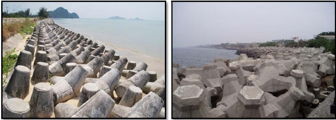
ภาพที่ 2-10 ก้อนคอนกรีตหล่อรูปสี่ขา (Tetra pod) ปูเรียงไว้หน้าชายหาดบริเวณปากน้ำบางนรา จังหวัดนราธิวาส (ซ้าย)

และ ก้อนคอนกรีตหล่อรูปหัวนอตหกเหลี่ยมสี่ขาปูเรียงไว้ด้านกำแพงป้องกันคลื่นริมชายฝั่งในไต้หวัน (ขวา)