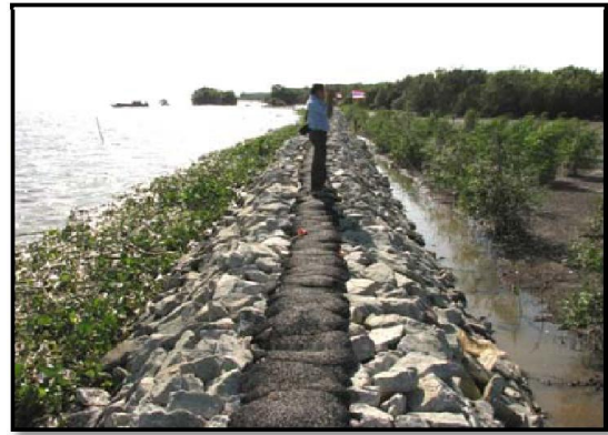
ภาพที่ 2-11 กำแพงป้องกันคลื่นใกล้ชายฝั่งแบบหินทิ้งหรือหินเรียงฐานรากเข็มสน บริเวณ บ้านสีลังตำบลสองคลอง อำเภอบางปะกง จังหวัดฉะเชิงเทรา