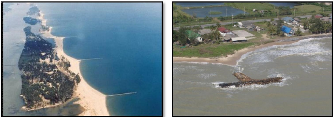
ภาพที่ 2-13 (ซ้าย) รอดักทรายแบบแนวตรงร่วมกับการถมทรายเสริมชายหาดบริเวณอำเภอตากใบจังหวัดนราธิวาส