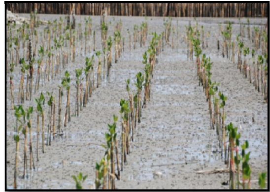
ภาพที่ 2-4 การปักไม้ไผ่ตงชะลอคลิ้นและปลูกป่าชายเลนบริเวณศูนย์อนุรักษ์ทรัพยากรทางทะเลและชายฝั่งที่ 2 (สมุทรสาคร) ตำบลโคกขาม อำเภอเมือง จังหวัดสมุทรสาคร