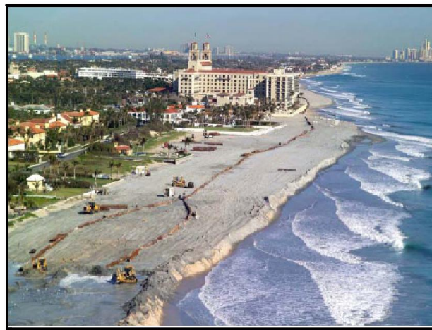
ภาพที่ 2-2 การเติมทรายเสริมชายหาดหรือการบูรณะชายหาดด้วยการเสริมทรายบริเวณชายหาดปาล์มบีช (Palm Beach) มลรัฐฟลอริดา สหรัฐอเมริกา

การเติมทรายเสริมชายหาด(Beach Replenishment) หรือการบูรณะชายหาดด้วยการเสริมทราย (Beach Nourishment) เป็นการนำทรายที่มีขนาดใกล้เคียงกันจากพื้นที่อื่นมาเติมหรือเสริมชายหาดให้อีกพื้นที่หนึ่งที่ชายหาดถูกกัดเซาะและทรายถูกพัดพาหายไป เป็นการปรับปรุงฟื้นฟูสภาพชายหาดที่ถูกกัดเซาะให้ดีขึ้น และเป็นการช่วยป้องกันอาคารและสิ่งปลูกสร้างบริเวณชายหาดไม่ให้ถูกกัดเซาะไปในระยะเวลาอันสั้นในขณะที่ชายฝั่งทะเลยังคงมีชายหาดอยู่ได้ตามธรรมชาติ (รูปที่ 3-1) การบูรณะชายหาดด้วยเสริมทรายต้องดำเนินการ หลายครั้งตามระยะเวลาเหมาะสม และแตกต่างกันในแต่ละสถานที่ เมื่อการเติมทรายเสริมชายหาดหรือการบูรณะชายหาดด้วยการเสริมทรายเสร็จสิ้นแล้ว จำเป็นต้องมีการติดตามตรวจสอบชายหาดดังกล่าวอย่างต่อเนื่องสม่ำเสมอ โดยการสำรวจรูปหน้าตัดชายฝั่งทะเล (Coastal Profile) เป็นระยะ ๆ เพื่อนำไปใช้ในการคำนวณปริมาณทรายที่สูญเสียไป