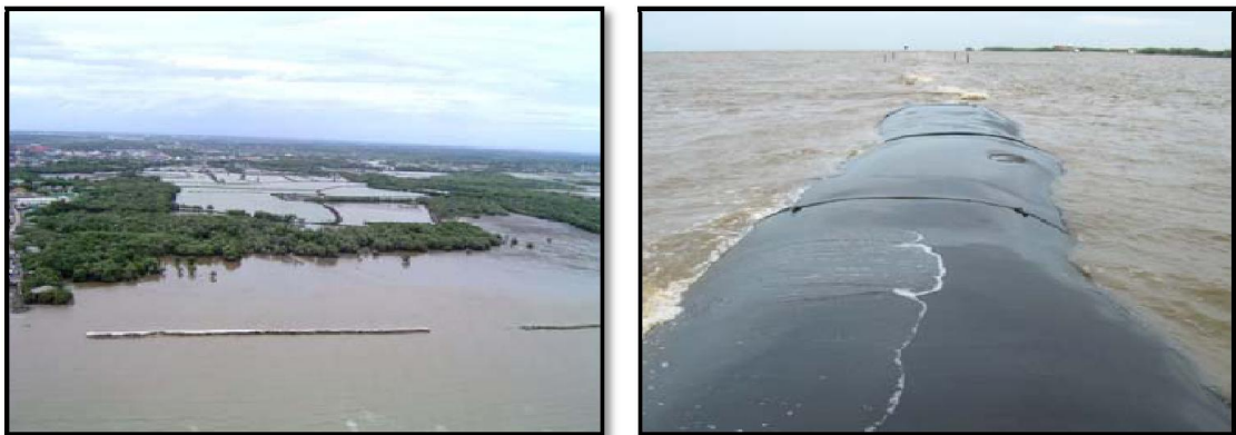
ภาพที่ 2-5 การใช้ไส้กรอกทรายเป็นแนวป้องกันและแก้ไขปัญหาการกัดเซาะบริเวณชายฝั่งทะเล อำเภอลองด่าน จังหวัดสมุทรปราการ

ไส้กรอกทรายท่อหุ้มด้วยใยสังเคราะห์ทางธรณี (Geotextile หรือ Geomembrane) ทำจากวัสดุโพลีโพรพิลีน (Polypropylene) หรือโพลีเอสเตอร์ (Polyester) จึงมีความแข็งแรงและมีความยืดหยุ่นสูง มีความทนทานต่อสารเคมีต่าง ๆ ที่มีอยู่ในดินตามธรรมชาติและมีคุณสมบัติให้น้ำซึมผ่านได้ดี ในทางเทคนิคมีลักษณะคล้าย "ท่อธรณี" (Geotube) แต่ในการใช้งานเมื่อบรรจุทรายไว้ภายในทำให้เมื่อมองจากภายนอกมีลักษณะคล้ายกับไส้กรอก จึงเรียกว่า "ไส้กรอกทราย" (Sand Sausage) โดยไส้กรอกทรายแต่ละตัวมีขนาดเส้นผ่านศูนย์กลางประมาณ 1.8-2.1 เมตร ความยาวประมาณ 100 เมตร การใช้ไส้กรอกทรายเป็นแนวป้องกันและแก้ไขปัญหาการกัดเซาะชายฝั่งทะเล ทำได้โดยการนำไส้กรอกทรายวางเรียงขนานกับแนวชายฝั่งทะเลให้มีช่องว่างห่างกันประมาณ 50 เมตร และห่างจากแนวชายฝั่งทะเล 200-400 เมตร ขึ้นอยู่กับความลึกของท้องทะเล หรือที่ความลึกประมาณ (-)3 เมตร จากระดับน้ำทะเลปานกลาง โดยให้แนวสันบนจมน้ำหรือโผล่พ้นน้ำก็ได้ เนื่องจาก ไส้กรอกทรายไม่ต้องตอกเสาเข็มรองรับหรือปรับปรุงกำลังดินอ่อนด้านล่าง จึงต้องปูรองด้วยพุกใยสังเคราะห์ เดิมทราย (Geomatress) หนาประมาณ 0.05 เมตร เพื่อช่วยลดเสถียรภาพของชั้นดินฐานรากอ่อนและการทรุดตัวของไส้กรอกได้ระดับหนึ่ง (กรมทรัพยากรทางทะเลและชายฝั่ง, 2553) รูปที่ 2-5 การใช้ไส้กรอกทรายมีข้อดีและข้อเสียโดยสรุปดังตารางที่ 2-5