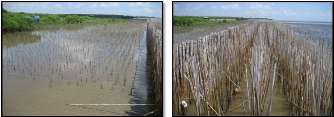
ภาพที่ 2-3 การปักไม้ไผ่รวกชะลอคลื่นและการปลูกป่าชายเลนหลังแนวไม้ไผ่บริเวณสถานตากอากาศบางปู อำเภอเมืองจังหวัดสมุทรปราการ

กรณีที่มีคลื่นลมที่รุนแรงได้ เป็นเพียงแนวชะลอคลื่นเพื่อส่งเสริมให้เกิดการตกตะกอน และเมื่อตะกอนสะสมตัวและมีเสถียรภาพมากพอก็สามารถปลูกป่าชายเลนยึดตะกอนให้ได้ พื้นที่และระบบนิเวศป่าชายเลนกลับคืนมา ไม้ไผ่ที่นำมาใช้อาจเป็นไม้ไผ่รวกหรือไม้ไผ่ตง ก็ได้ตามความเหมาะสม เนื่องจากมีความเหมาะสมในด้านความคงทน อายุการใช้งานและราคาแตกต่างกัน แต่ส่วนใหญ่นิยมใช้ไม้ไผ่ตงมากกว่าเพราะมีความคงทน และอายุการใช้งานมากกว่า ส่วนราคาถึงแม้จะสูงกว่าแต่ในระยะยาวมีความคุ้มค่ามากกว่า ไม้ไผ่รวกที่ใช้อายุการใช้งานประมาณ 1-2 ปี มีขนาดเส้นผ่านศูนย์กลางประมาณ 1-1.5 นิ้ว ความยาว 5-6 เมตร บักลิก 2-2.5 เมตร บักให้ลำชิดติดกันแน่นประมาณ 2-3 แถวต่อแนว จำนวน 3-5 แนว ห่างกันแนวละประมาณ 1-2 เมตร เมื่อมีตะกอนตกสะสมมากพอก็สามารถปลูกป่าชายเลนได้ รูปที่ 2-3