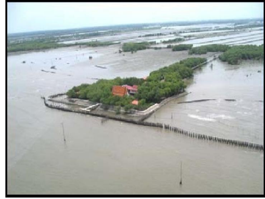
ภาพที่ 2-15 แนวปักเสาเข็มคอนกรีตหล่อแบบสี่เหลี่ยมของวัดขุนสมุทรราชต่อด้วยคอนกรีตหล่อแบบสามเหลี่ยม 49A2 ของจุฬาลงกรณ์มหาวิทยาลัย บริเวณวัดขุนสมุทรราช ตำบลแหลมฟ้า อำเภอพระสมุทรเจดีย์ จังหวัดสมุทรปราการ ตารางที่ 2-15 ข้อดีและข้อเสียของการทำเสาคอนกรีตหรือเสาเข็ม