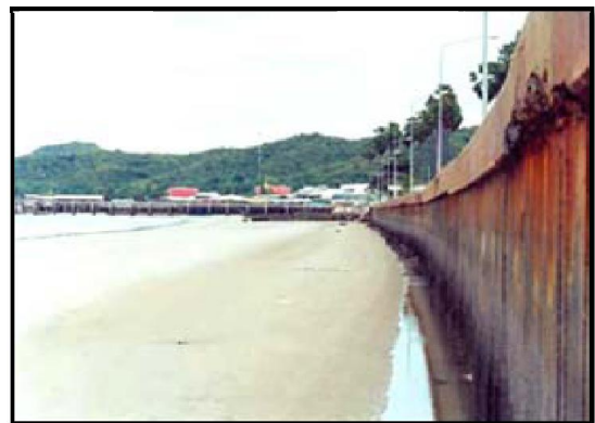
ภาพที่ 2-6 กำแพงป้องกันคลื่นริมชายหาดแบบตั้งตรง อำเภอหัวหิน จังหวัดประจวบคีรีขันธ์ (ซ้าย) และบริเวณอ่าวน้อย ตำบลอ่าวน้อย อำเภอเมือง จังหวัดประจวบคีรีขันธ์ (ขวา)