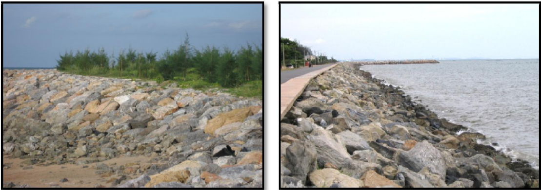
ภาพที่ 2-9 กำแพงป้องกันคลื่นริมชายหาดโดย การปูหรือเรียงก้อนหินบนหน้าหาดโดยตรง บริเวณพระราชินีเวสต์มฤตทายวัน อำเภอชะอำ จังหวัดเพชรบุรี (ซ้าย) และการปูหรือเรียงก้อนหินซ้อนทับไว้หน้ากำแพงป้องกันคลื่นริมชายฝั่งบริเวณหาดทรายทอง อำเภอมาบตาพุด จังหวัดระยอง (ขวา)

กำแพงป้องกันคลื่นริมชายหาดประเภทนี้ สร้างโดยใช้ก้อนหิน (Bolders) หรือก้อนคอนกรีตหล่อรูปแบบต่าง ๆ (Concrete Armour Units) ปูหรือเรียงไว้บริเวณริมชายฝั่งทะเลให้มีลักษณะเป็นกำแพง (Revetment) เพื่อป้องกันคลื่นกัดเซาะชายฝั่งทะเล ก้อนหินหรือก้อนคอนกรีตเหล่านี้ เมื่อนำมาปู หรือวางเรียงซ้อนกันเป็นกำแพงแล้วจะมีช่องว่างระหว่างก้อนในขนาดที่ใหญ่พอที่จะช่วยยึดน้ำจากคลื่นที่พัดเข้าหาฝั่งไว้จำนวนหนึ่งในระยะเวลาหนึ่ง นอกจากนี้ ยังช่วยลดการสะท้อนกลับของคลื่น (Wave Reflection) และลดความรุนแรงของคลื่นถอยกลับ (Backwash) ซึ่งเป็นตัวพัดพาทรายออกจากฝั่ง ก้อนหินหรือก้อนคอนกรีตสามารถนำมาปูหรือเรียงไว้โดยตรงบนหน้าหาดหรือซ้อนทับไว้หน้ากำแพงคอนกรีต รูปที่ 2-9