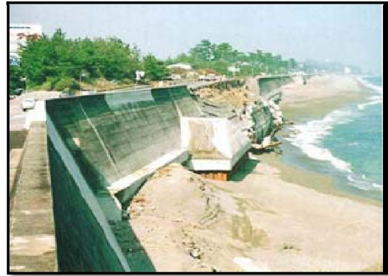
ภาพที่ 2-7 กำแพงป้องกันคลื่นริมชายหาดแบบลาดเอียง ก่อนฐานรากถูกกัดเซาะ (ซ้าย) และ หลังฐานรากถูกกัดเซาะ (ขวา)