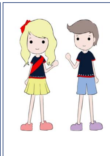
เครื่องแต่งกาย : เสื้อยืดคอกกลมสีขาวย ตกแต่งแถบผ้าพื้นถิ่น, เสื้อยืดผู้ชาย (กีฬา) ตกแต่งแถบผ้าพื้นถิ่น กางเกงผู้ชายตกแต่งแถบด้วยผ้าพื้นถิ่น, ชุดสูทผู้หญิง, เสื้อสำหรับเด็กหญิง, เสื้อสำหรับเด็กชาย