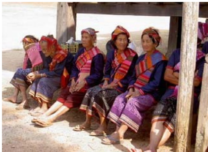
การแต่งกายชาวภูไท

ผลิตภัณฑ์ผ้าพื้นถิ่น ณ ปัจจุบัน ของหมู่บ้านโคกโก่ง จังหวัดกาฬสินธุ์