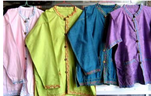
เสื้อผ้าฝ้าย