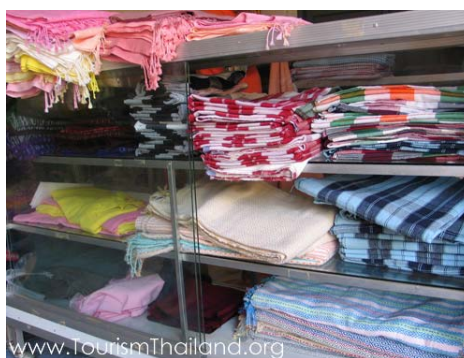
สินค้าแสดงในตู้โชว์