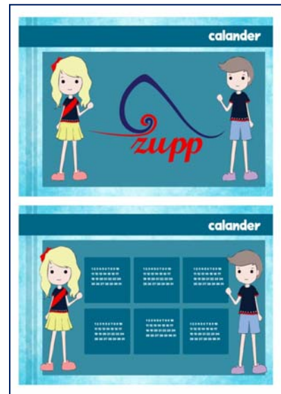
อุปกรณ์สำนักงาน : สมุด, ปฏิทิน