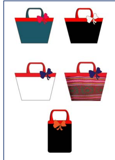
เครื่องประดับตกแต่ง : ถุงผ้า, หมวก, กระเป๋าถือสุภาพสตรี