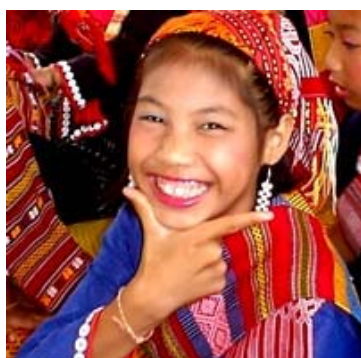
เครื่องแต่งกายที่ทำจากผ้า