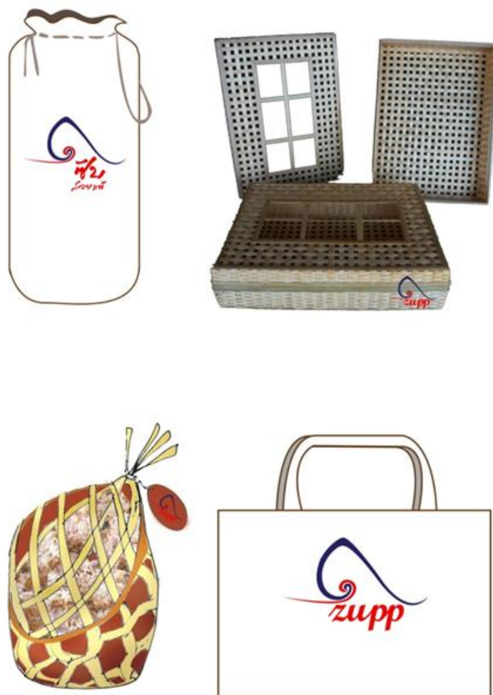
ภาพที่ 4.8 แสดงตัวอย่างบรรจุภัณฑ์ของที่ระลึก