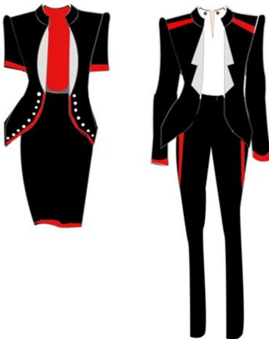
ภาพที่ 4.5 แสดงตัวอย่างของที่ระลึกสำหรับกลุ่มนักท่องเที่ยว

กางเกงยีนส์ที่มีการตกแต่งด้วยลวดลายผ้าฤดูโท ซึ่งอาจทำได้สองลักษณะคือ ทำกางเกงที่มีลวดลายแล้วขายทั้งตัว หรือ นำกางเกงของนักท่องเที่ยวนำมาบริการเพิ่มลวดลายตามความต้องการของนักท่องเที่ยวก็นได้