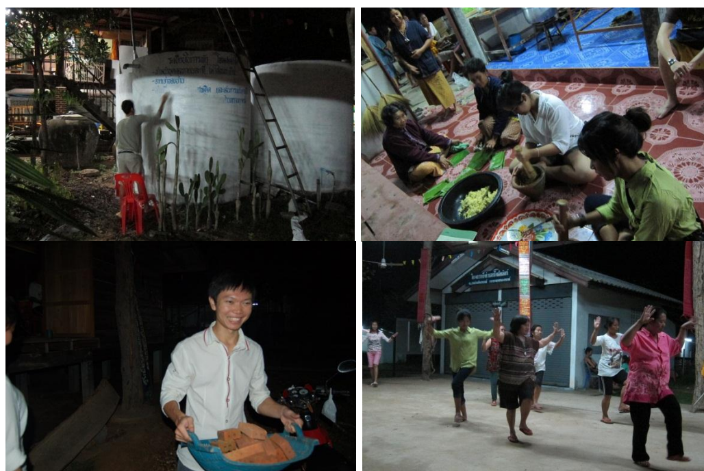
ภาพที่ 4.12 แสดงกิจกรรมที่นักท่องเที่ยวมีส่วนร่วมกับชุมชนเพื่อเตรียม สถานที่ อาหาร การแสดงในวันก่อนการมีเทศกาลงานบุญ

ผลิตรายการการท่องเที่ยวเชิงสร้างสรรค์สำหรับบ้านโคกโก่ง สามารถใช้เทศกาลงานบุญของชุมชนมาปรับใช้เพื่อการท่องเที่ยว โดยปกติชุมชนจะไม่ทำอะไรทำนาในช่วงดังกล่าว แล้วยังสวมใส่ผ้าพื้นถิ่นในช่วงนี้ด้วย ซึ่งนักท่องเที่ยวที่มาในช่วงดังกล่าวสามารถทำกิจกรรมร่วมกับชุมชนเพื่อเตรียมงานบุญ หาเครื่องแต่งการพื้นถิ่นเพื่อสวมใส่ในวันงานบุญ ทำให้นักท่องเที่ยวและชุมชนมีประสบการณ์ร่วมกัน เรียนรู้ซึ่งกันและกัน ในลักษณะนี้จะเป็นเครื่องมือรักษาสมดุลระหว่างการเปลี่ยนแปลงที่จะเกิดขึ้นและผลประโยชน์ของชุมชน