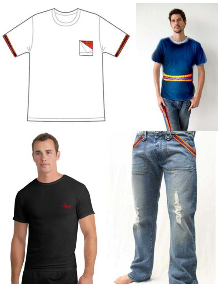
ภาพที่ 4.4 แสดงตัวอย่างของที่ระลึกสำหรับกลุ่มนักท่องเที่ยวชาย

ในส่วนของการของที่ระลึกแบบร่วมสมัยที่ยังคงอัตลักษณ์ของท้องถิ่นไว้ จะต้องมีทั้งส่วนของนักท่องเที่ยวผู้ชาย ผู้หญิง และ เด็ก นอกจากนี้ยังต้องมีขนาดที่ไม่ก่อให้เกิดปัญหาในการเดินทางของนักท่องเที่ยว ตัวอย่างของการของที่ระลึกมีดังต่อไปนี้