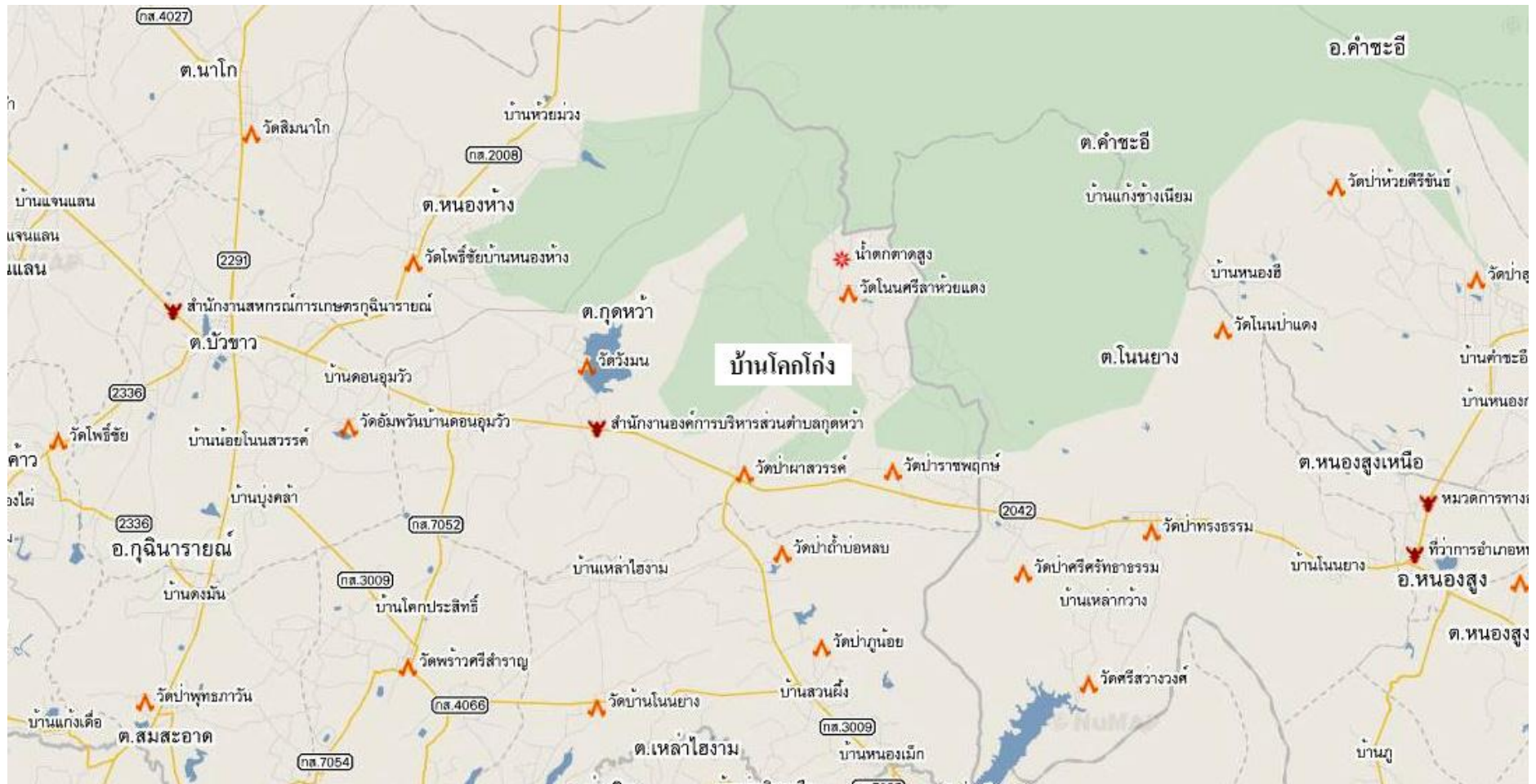
ภาพที่ 4.1 แผนที่หมู่บ้านโคกโก่ง ตำบลลुकหลวง อำเภอกุฉินารายณ์ จังหวัดกาฬสินธุ์