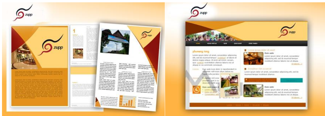
ภาพที่ 4.3 แสดงตราผลิตภัณฑ์บนพื้นสีต่างๆ