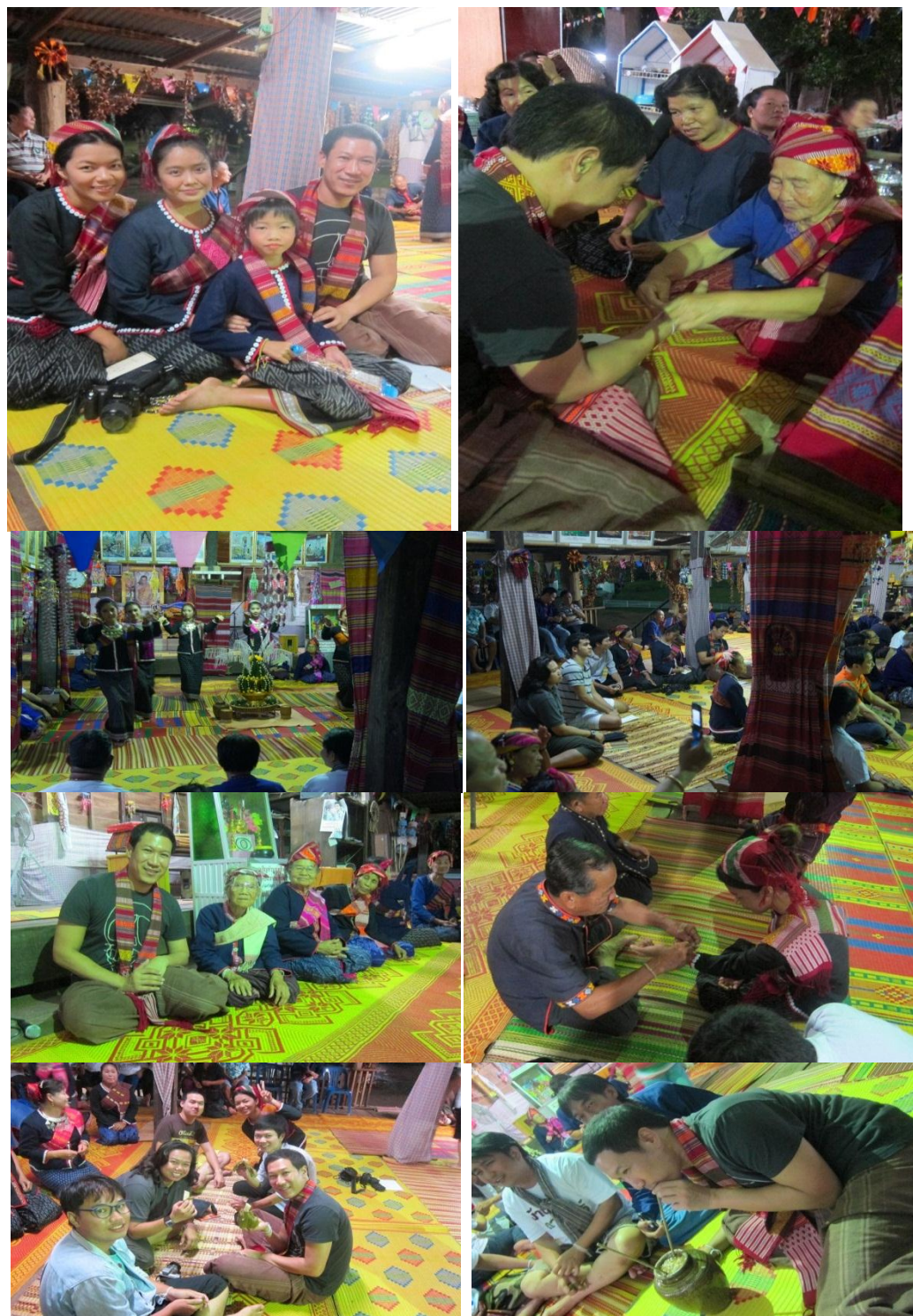
ภาพที่ 4.14 แสดงการรับขวัญนักท่องเที่ยวจากชุมชนในวันเทศกาลงานบุญ ที่มา: คณะผู้วิจัย, ธันวาคม 2555.