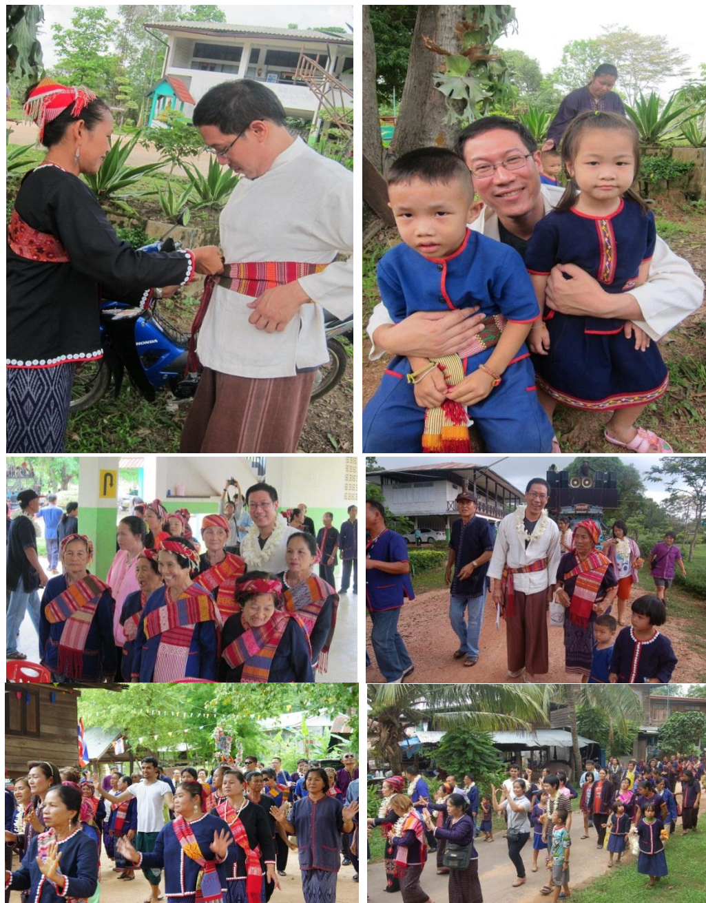
ภาพที่ 4.13 แสดงกิจกรรมที่นักท่องเที่ยวมีส่วนร่วมกับชุมชนในวันเทศกาลงานบุญ ที่มา: คณะผู้วิจัย, ธันวาคม 2555.