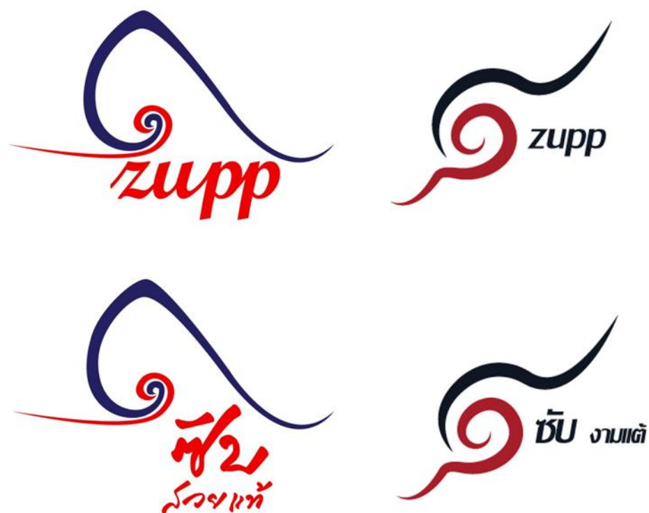
ภาพที่ 4.2 แสดงตัวอย่างตราสินค้าสำหรับผลิตภัณฑ์การท่องเที่ยวและของที่ระลึก

คำว่า “ซัพ” ในภาษาไทยแปลว่า “สวย” เช่น “สาวซัพภูไท” หมายความว่า “สาวสวยชาวภูไท” ซึ่งมีความหมายในทางบวก และ ยังเป็นคำที่บ่งบอกถึงอัตลักษณ์ทางวัฒนธรรมของชาวผู้ไท จึงนำมาปรับใช้เป็นชื่อผลิตภัณฑ์ นอกจากนั้นคำว่า “ซัพ” ยังสามารถทำการตลาดได้ง่าย ค้นหาได้เร็ว อีกทั้งยังพัฒนาสู่ตลาดต่างประเทศได้โดยยังสามารถสื่อถึงอัตลักษณ์ของชุมชนในเวทีโลกได้