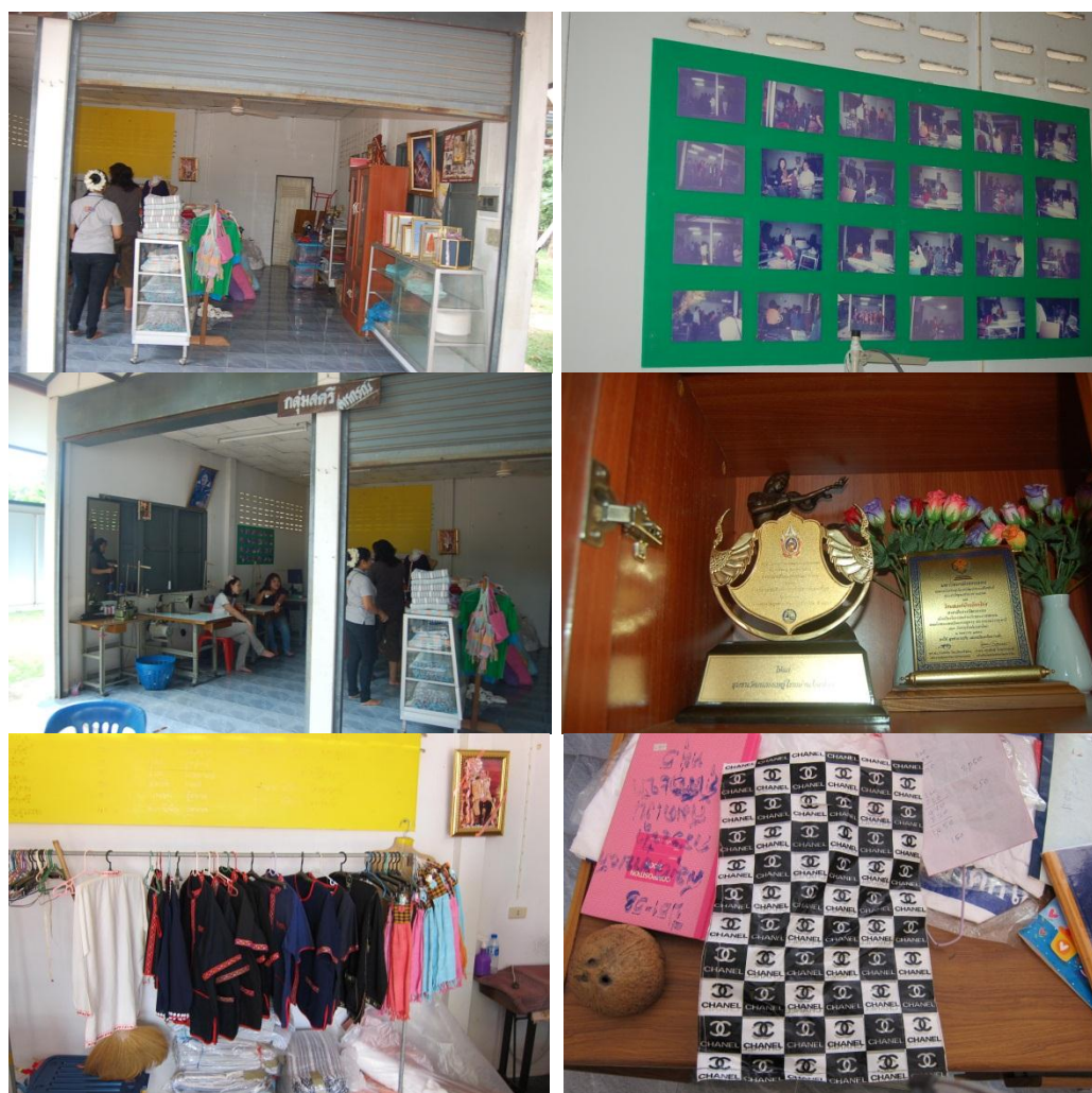
ภาพที่ 4.10 แสดงสภาพปัจจุบันของร้านขายของที่ระลึกอยู่ในบริเวณวัดศรีภูษันธ์ รวมทั้งสินค้าที่ระลึกและบรรจุภัณฑ์

คนในชุมชนมีความต้องการที่จะพัฒนาพื้นที่ดังกล่าวนี้ เป็นพื้นที่เอนกประสงค์เพื่อใช้เป็นศูนย์ข้อมูลการท่องเที่ยว และ ร้านขายของที่ระลึก นอกจากนี้กลุ่มเยาวชนในหมู่บ้านยังเสนอให้เพิ่มร้านขายเครื่องดื่มและอาหารว่าง เข้าไปในพื้นที่นี้ด้วย ซึ่งกลุ่มเยาวชนจะได้จัดเวรกันมาดูแล เป็นที่พบปะกัน รวมทั้งพื้นที่ดังกล่าวเปิดต้อนรับนักท่องเที่ยวได้