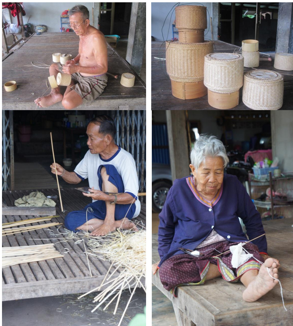
ภาพที่ 4.9 แสดงหัตถกรรมในท้องถิ่นที่สามารถปรับใช้เพื่อเป็นบรรจุภัณฑ์ของที่ระลึกได้