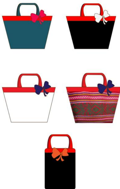
ภาพที่ 4.7 แสดงตัวอย่างของที่ระลึกอื่นๆ