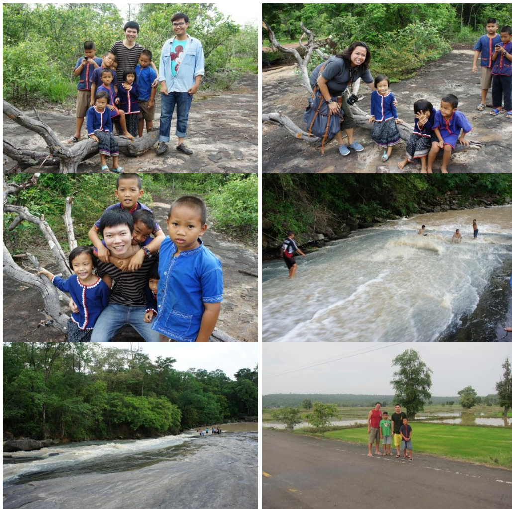
ภาพที่ 4.15 แสดงกิจกรรมการท่องเที่ยวซึ่งนำเที่ยวโดยเด็กๆในชุมชน