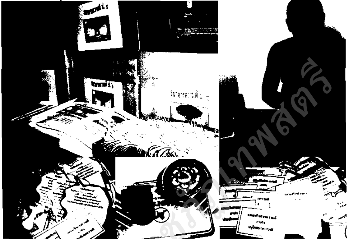
ภาพ ๒๖ ผลิตภัณฑ์อุปกรณ์จัดกิจกรรมธนาคารความดี

หลังจากกลุ่มพระภิกษุสามเณรร่วมกันกำหนดทิศทางในรูปแบบการบันทึกใหม่ และเนื้อหาที่บันทึกความดีแล้ว จึงมีการมอบหมายหน้าที่ให้แกนนำกลุ่มพระภิกษุสามเณรได้ ดำเนินการสร้างนวัตกรรมขึ้นมา อาทิ ไบโพรซ์บันทึกความดี กล่องรับฝากความดี บัตรติดอก คณะกรรมการ ตราประทับความดี ตราดาวความดี เป็นต้น ซึ่งเป็นสื่ออุปกรณ์สำคัญที่ช่วยเสริมแรง ในการทำความดีของเด็ก ดังในภาพปรากฏ