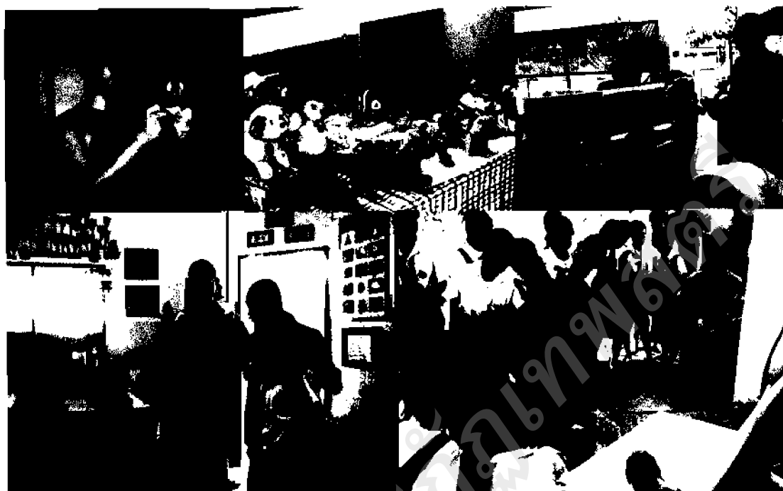
ภาพ ๓๖ กิจกรรมใช้สื่อสำเร็จ (ตุ๊กตา) มาประยุกต์ในการเรียนการสอน

๒.๒.๓ สื่อเทคโนโลยี เช่น สื่อคอมพิวเตอร์ช่วยสอน ซีดี วีดิทัศน์ และเรื่องบันทึกเสียง เป็นต้น เป็นสื่อการเรียนรู้ที่เป็นเทคโนโลยีใหม่ๆ นำมาใช้เพื่อประกอบการเรียนการสอนเรื่องพุทธประวัติ หลักธรรมสำคัญ และการบริหารจัดการและเจริญปัญญา เป็นต้น โดยจำแนกวิธีการใช้สื่อสอนตามลักษณะของเนื้อหาสาระ ดังนี้