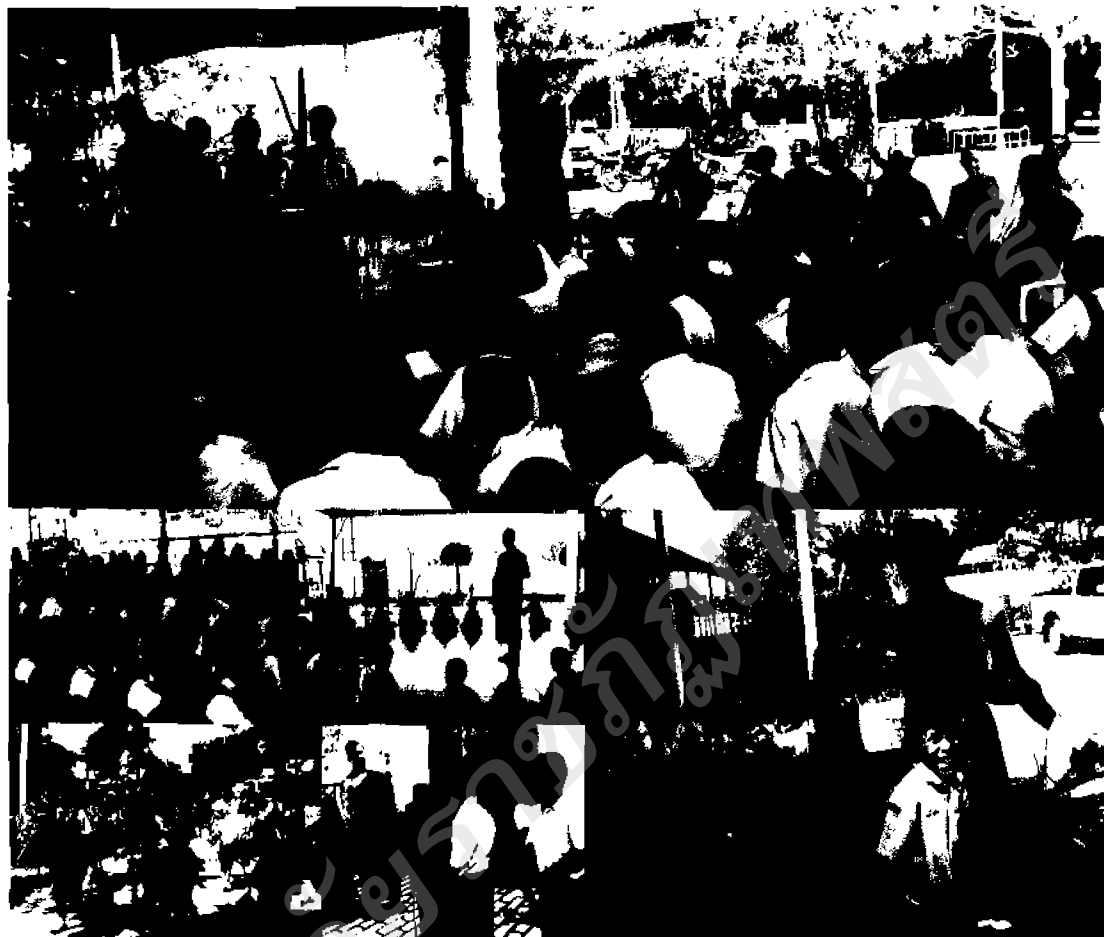
ภาพ ๓๔ กิจกรรมเรียนรู้สร้างการมีส่วนร่วม "ทำดีถวายพ่อหลวง"

๕. วิธีการจัดกระบวนการเรียนรู้ในการดำเนินกิจกรรม มีวิธีการและขั้นตอนดำเนินกิจกรรมเรียนรู้หลายช่วงด้วยกัน ดังนี้