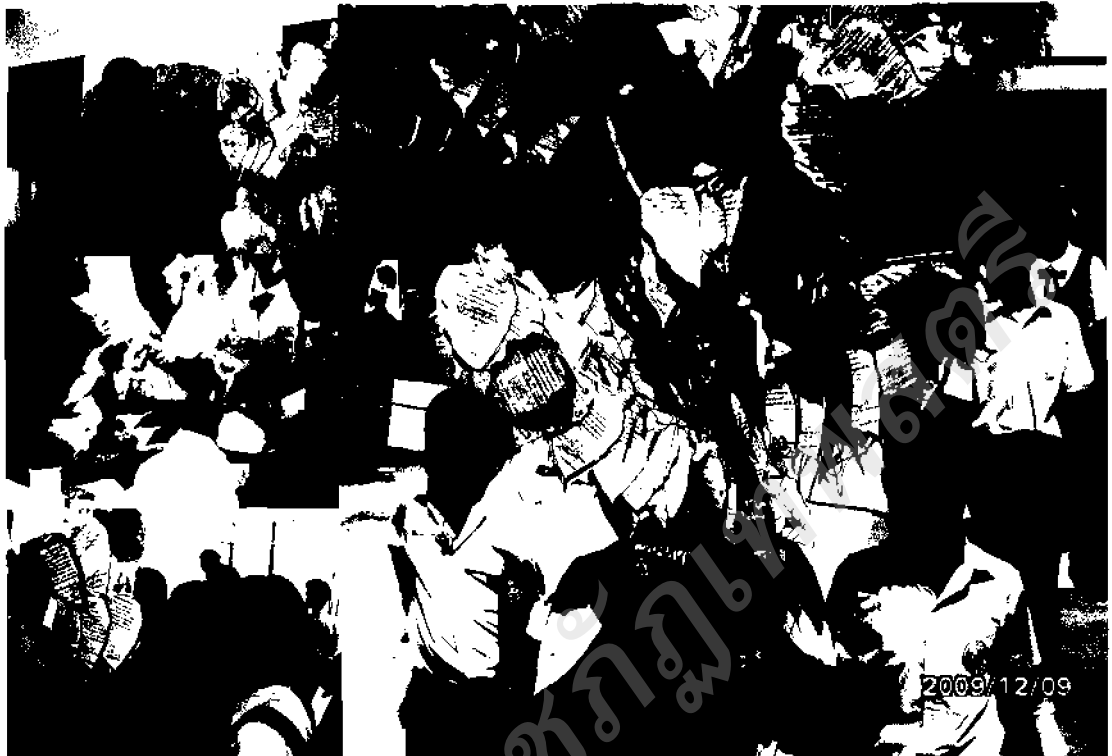
ภาพ ๓๒ บรรยากาศกิจกรรมรับฝากต้นบุญผ้าป่าความดี

ส่วนขั้นตอนในการดำเนินกิจกรรมระยะสุดท้ายได้มีการนำผ้าป่าความดีที่ได้ใช้ระยะเวลาในการเก็บสะสมมาทั้งหมด นำมาจัดทำเป็นต้นบุญผ้าป่าความดี และมีการแห่ผ้าป่าความดีก่อนพิธีกรรมทำถวายแก่พระสงฆ์เพื่อสร้างความศักดิ์สิทธิ์กับความดีที่เด็กได้ทำ