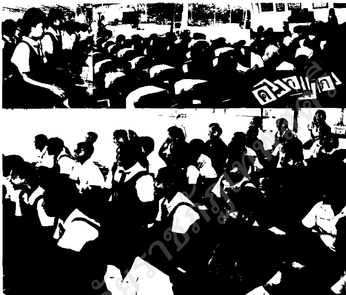
ภาพ ๓๗ กิจกรรมใช้สื่อเทคโนโลยีช่วยสร้างความสุขในการเรียนรู้แก่ผู้เรียน

๓) สื่อสอนเรื่องบริหารจัดการและเจริญปัญญา (สื่อเพลงประกอบของธรรมเสถียร) ผู้สอนจะใช้สื่อทำประกอบการนั่งสมาธิ ให้ผู้เรียนได้ปฏิบัติตาม และสื่อเสียงประกอบการบรรยาย การนั่งสมาธิ เป็นการสร้างบรรยากาศให้กับผู้เรียนเกิดความชอบพร้อมทั้งได้ลงมือปฏิบัติอีกด้วย