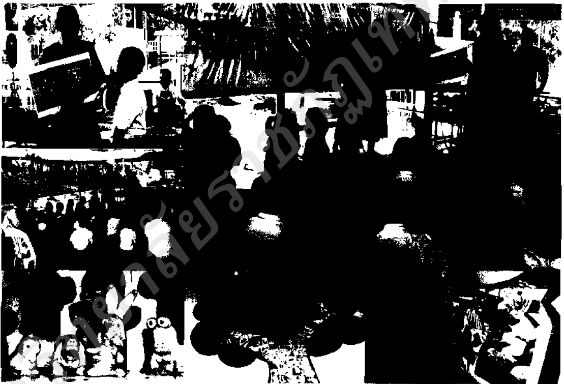
ภาพ ๓๕ กิจกรรมใช้สื่อผลิตขึ้นเองมาประกอบการเรียนการสอน

๒.๒.๑ สื่อหุ่นขี้กิ้ง เป็นสื่อการสอนที่อาศัยวัสดุหาง่ายใกล้ตัว เช่น กระดาษ กาว เส้นเอ็น เข็มหมุด กรรไกร ฯลฯ ได้จัดทำขึ้นเพื่อใช้ประกอบการเรียนการสอนเรื่อง ซาดก (กฎีทุสทซาดก) เนื้อหาสาระเกี่ยวกับการคบมิตร ซึ่งผู้สอนจะใช้วิธีการบรรยายให้ความรู้ควบคู่กับการใช้สื่อหุ่นขี้กิ้งที่แสดงเป็นตัวละครในเรื่องนั้น สร้างโอกาสให้ผู้เรียนได้เข้ามามีส่วนร่วมในการใช้สื่อและกล้าที่จะแสดงออก เช่น ให้เด็กที่เข้ามามีบทบาทในการแสดงเป็นตัวละครร่วมกับการใช้สื่อสอน หรือการให้เด็กได้ใช้สื่อร่วมกับผู้สอน เป็นต้น ซึ่งจะช่วยสร้างความสนุกสนานในการเรียนรู้เป็นอย่างดี จะแตกต่างไปเดิมที่มีใช้การพูดเล่าบรรยายอย่างเดียวไม่ได้ภาพประกอบ จะทำให้ผู้เรียนขาดความสนใจไม่ให้ความสำคัญกับการเรียนรู้เท่าที่ควร