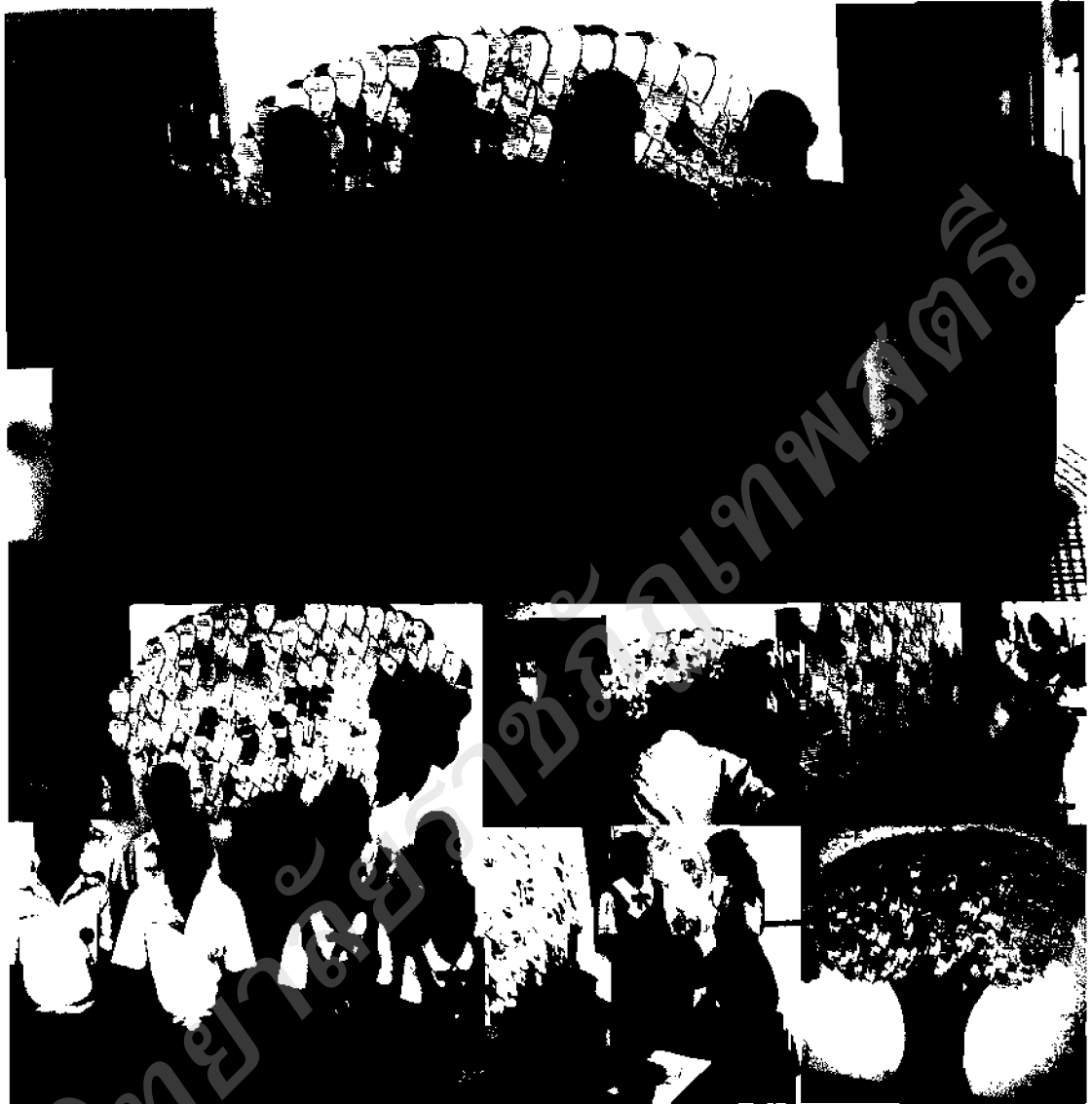
ภาพ ๒๘ คณะกรรมการนักเรียนผู้ทำหน้าที่รับฝากกิจกรรมต้นไม้สัจจะความดี

กิจกรรมต้นไม้สัจจะความดี ได้ประยุกต์พุทธวิธีการสอนที่ว่าด้วย การสอนสิ่งที่มีความหมายและเป็นประโยชน์แก่ผู้เรียน อย่างพระพุทธพจน์ที่ว่า พระองค์ทรงมีพระเมตตา หวังประโยชน์แก่สัตว์ทั้งหลาย สอดคล้องกับกิจกรรมที่เน้นให้ผู้เรียนได้ทำกิจกรรมที่เป็นประโยชน์แก่ตัวผู้เรียนเอง โดยที่ผู้สอนมีความปรารถนาดีต่อผู้เรียน จึงได้มีการจัดกิจกรรมครั้งนี้ขึ้นมา