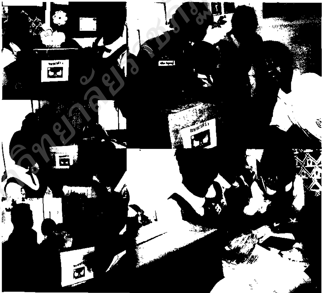
ภาพ ๒๗ บรรยากาศเปิดทำการรับฝากธนาคารความดีเป็นไปอย่างคึกคัก

ส่วนขั้นตอนรับฝากความดีนั้น คณะกรรมการในแต่ละระดับชั้น จะเปิดทำการรับฝากความดีพร้อมกันในวันอังคาร หลังจากทานอาหารเที่ยงเสร็จ ซึ่งได้ปรับเปลี่ยนวิธีการสะสมคะแนนที่แตกต่างไปจากเดิมคือ โบนัสรับฝากความดีล่าสุด จะมีเกณฑ์ประเมินอยู่ ๒ ระดับคือระดับเกรด A ดีเยี่ยม (คือ ทำความดีได้มาก ตั้งแต่ ๕ อย่างขึ้นไป) ได้ ๒ ดาว ระดับเกรด B ดี (คือ ทำความดีได้น้อย ตั้งแต่ ๔ อย่างลงมา) ได้ ๑ ดาว ดังในภาพที่ปรากฏ