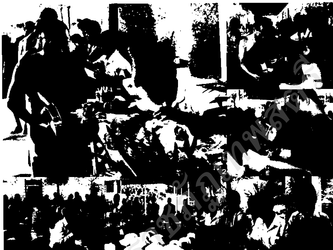
ภาพ ๓๘ กิจกรรมเสริมสร้างประสบการณ์เรียนรู้แก่ผู้เรียนโดยตรง

จากการทดลองการใช้สื่อหลากหลายมาประกอบการสอนวิชาพระพุทธศาสนา นั้นสามารถสรุปได้ดังนี้