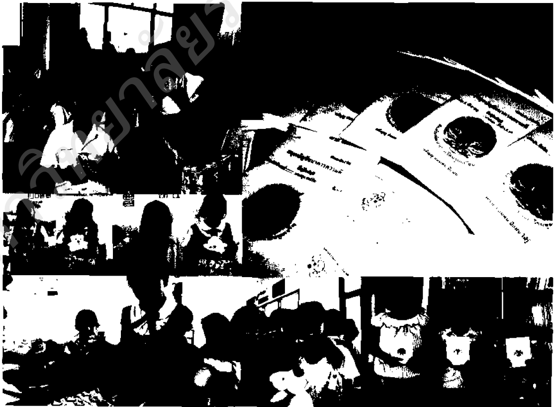
ภาพ ๒๐ ธนาคารความดีปันผล ให้รางวัลเด็กดี ประจำปีการศึกษา ๒๕๕๒

เป็นการดำเนินกิจกรรมที่ต้องการมุ่งเน้นให้กลุ่มเป้าหมายได้แก่ พระภิกษุสามเณร เกิดการเรียนรู้ร่วมกัน และกลุ่มที่มีส่วนเกี่ยวข้อง ได้แก่ ผู้บริหารสถานศึกษา คุณครู นักเรียน และผู้ปกครองนักเรียน ได้เข้ามามีส่วนร่วมในการจัดกิจกรรมเรียนรู้ของพระภิกษุสามเณรเพื่อพัฒนาให้กระบวนการการเรียนการสอนวิชาพระพุทธศาสนาเป็นไปอย่างมีความสุข ซึ่งตัวกิจกรรมที่จัดขึ้นเองได้สร้างโอกาสให้ทุกฝ่ายได้มีส่วนร่วมร่วมกัน กิจกรรมที่จัดขึ้นประกอบด้วย