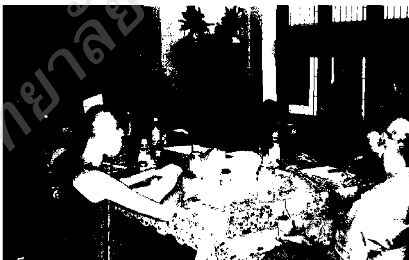
ภาพ ๓๓ บรรยากาศหรือเตรียมการจัดกิจกรรมวันพ้อแห่งชาติ

ดังนั้น เพื่อให้การเรียนการสอนวิชาพระพุทธศาสนาเกิดความสอดคล้องกับนโยบายของภาครัฐ และเป็นการเน้นเรียนการสอนที่สร้างการมีส่วนร่วมเป็นสำคัญ จึงได้มีการดำเนินการจัดกิจกรรมเรียนรู้ขึ้นมา เพื่อสร้างโอกาสให้พระภิกษุสามเณรและเด็กนักเรียนได้ทำกิจกรรมร่วมกัน ซึ่งมีขั้นตอนดังนี้