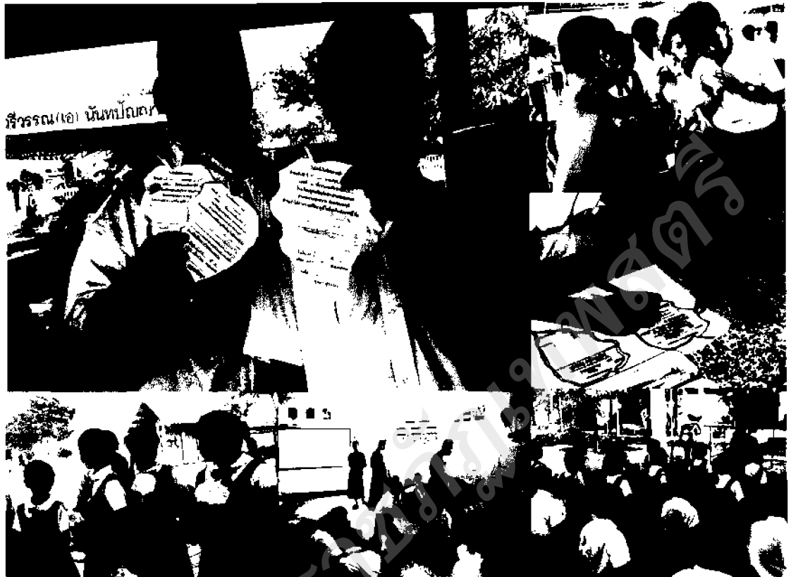
ภาพ ๓๐ บรรยากาศการบันทึกสัจจะความดี เนื่องในวันแม่แห่งชาติ

หลังจากมีการดำเนินกิจกรรมต้นไม้สัจจะความดีได้ระยะแรกหนึ่งแล้ว พบว่าเด็กนักเรียนส่วนใหญ่ยังขาดแรงกระตุ้นในการทำความดีด้านจิตใจ พระภิกษุสามเณรจึงได้ปรึกษาหารือหารือกัน จนได้แนวทางออกในการปฏิบัติได้จริง โดยมีการปรับเปลี่ยนวิธีการไปจากเดิม คือจะเน้นให้เด็กทำความดีหรือลด ละ เลิกในสิ่งที่ไม่ดีในช่วงโอกาสพิเศษต่างๆ ส่วนวิธีการรับฝากก็ทำการรับฝากหรือรับคำปฏิญาณเฉพาะเนื่องในโอกาสพิเศษเท่านั้น เช่น ในวันที่ ๑๒ สิงหาคมหาราชหรือในวันที่ ๕ ธันวาคมหาราช เป็นต้น เพื่อเป็นการสร้างแรงจูงใจให้แก่เด็กได้ทำความดี หรือลด ละ เลิก ความไม่ดีในโอกาสพิเศษต่างๆที่มีความสอดคล้องและเหมาะสมกับเหตุการณ์ที่เกิดขึ้นในปัจจุบันจริง ซึ่งจะเป็นสิ่งเร้าสำคัญที่จะช่วยให้เด็กเกิดการปรับเปลี่ยนพฤติกรรมได้เป็นอย่างดี