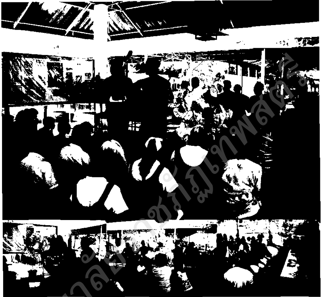
ภาพ ๓๑ ผู้บริหาร คณะครู และนักเรียน ร่วมกันถวายต้นไม้ป่าความดีแก่พระสงฆ์

๑.๓ กิจกรรมต้นไม้ป่าความดี เป็นอีกกิจกรรมหนึ่ง ในการดำเนินการเรียนรู้ของ พระภิกษุสามเณร ซึ่งกิจกรรมที่สามนี้เป็นผลมาจากการที่ตัวแทนของพระภิกษุสามเณรได้ไป ดำเนินการจัดกิจกรรมดังกล่าว จนเกิดเป็นการเรียนรู้ และได้นำมาพูดคุยแลกเปลี่ยนความคิดเห็น ร่วมกันเกี่ยวกับการจัดกิจกรรมทำความดีที่ผ่านมา หลังจากที่ได้ดำเนินการเสร็จสิ้นแล้ว ทำให้เกิด มุมมองของการจัดกิจกรรมอีกรูปแบบหนึ่ง ดังที่ตัวแทนพระภิกษุสามเณรได้ดำเนินกิจกรรมกล่าวไว้ว่า