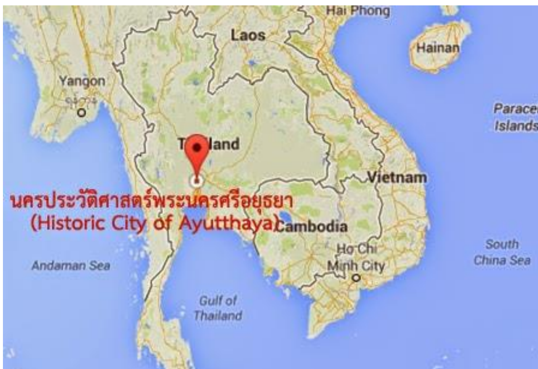
ภาพที่ 2 นครประวัติศาสตร์พระนครศรีอยุธยาและเมืองบรีวาร

ซึ่งกลุ่มเมืองมรดกโลกทางวัฒนธรรมทั้งสองแห่งนี้เป็นแหล่งท่องเที่ยวที่สำคัญของประเทศไทยที่ยังคงรักษาวัฒนธรรมดั้งเดิมทางด้านอาหารท้องถิ่นไว้และอาหารท้องถิ่นนั้นนับได้ว่าเป็นส่วนหนึ่งของสินค้าทางการท่องเที่ยวเชิงสร้าง ซึ่งควรให้ชุมชนได้มีการสืบสาน อนุรักษ์ภูมิปัญญาอาหารท้องถิ่นที่กำลังจะสูญหายไป ซึ่งเป็นผลลัพธ์มาจากการวิจัยโครงการย่อย 1 การสังเคราะห์องค์ความรู้เกี่ยวกับภูมิปัญญาอาหารท้องถิ่นในกลุ่มเมืองมรดกโลกทางวัฒนธรรม (สุโขทัย ศรีสัชชาลัยและกำแพงเพชร, พระนครศรีอยุธยา) และโครงการย่อย 2 การพัฒนาเส้นทางทางการท่องเที่ยววิถีไทยเพื่อเรียนรู้เกี่ยวกับภูมิปัญญาอาหารท้องถิ่นในกลุ่มเมืองมรดกโลกทางวัฒนธรรม (สุโขทัย ศรีสัชชาลัยและกำแพงเพชร, พระนครศรีอยุธยา) ซึ่งได้องค์ความรู้และเส้นทางทางการท่องเที่ยวเชิงสร้างสรรค์อันจะไปสู่การพัฒนา “วิสาหกิจชุมชน” เพื่อเป็นการสร้างรายได้จากการทำอาหารภูมิปัญญาท้องถิ่นที่กำลังจะสูญหายไป ขึ้นมาขายบนเส้นทางทางการท่องเที่ยวที่ได้พัฒนาขึ้นมา เพื่อเป็นการช่วยพัฒนาทรัพยากรทางการท่องเที่ยวทางด้านวัฒนธรรม สนับสนุนการมีส่วนร่วมของชุมชน กระจายรายได้สู่ชุมชน ตลอดจนการสร้างสมดุลของการพัฒนาการท่องเที่ยวต่อความสุขของประชาชนท้องถิ่นเพื่อนำไปสู่การท่องเที่ยวที่มีรูปแบบที่ยั่งยืน