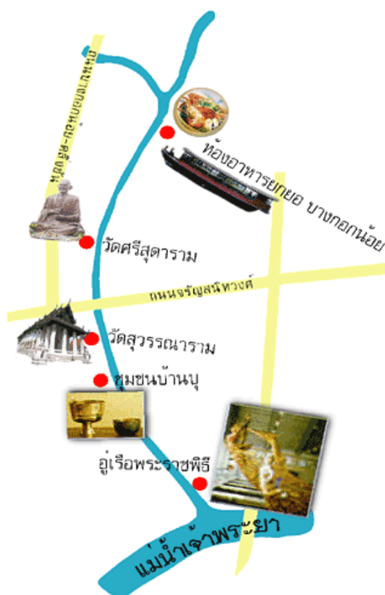
ภาพที่ 1.1 แผนที่เดินทางไปชุมชนบ้านบุ (ภูมิปัญญาไทยในงานศิลปถิ่นเมืองกรุง, 2557)

เครื่องทองลงหินอยู่ ก็พยายามพัฒนารูปแบบผลิตภัณฑ์เพื่อเปิดตลาดให้กว้างขวางยิ่งขึ้น มีการออกแบบและผลิตภาชนะรูปแบบใหม่ ๆ นอกเหนือจากชั้นน้ำพานรอง และจอกลอยอย่างโบราณอีก เป็นจำนวนมาก อาจกล่าวได้ว่า สภาพบ้านเมืองที่เปลี่ยนแปลงมีผลทำให้ศิลปหัตถกรรมการผลิตเครื่องทองลงหินของชุมชนบ้านบุเปลี่ยนแปลงไปตามสภาวะการณ์ใหม่ ๆ ไม่เพียงแต่รูปแบบแปลกใหม่ของภาชนะที่เกิดขึ้นรองรับความแตกต่างทางวัฒนธรรมต่างชาติและเทคโนโลยีการผลิตที่เพิ่มพูนขึ้นเท่านั้น ในทางตรงกันข้าม ความรู้ความสามารถและเทคนิคในการผลิตภาชนะอย่าง โบราณกลับเสื่อมถอยลงด้วยขาดทายผู้รู้ ผู้ทำได้ลงไปทุกขณะ