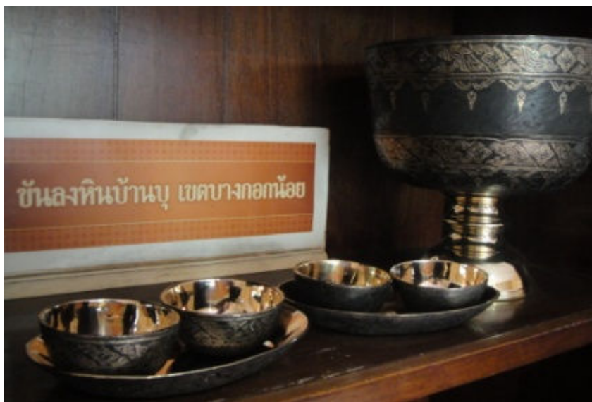
ภาพที่ 1.2 ชั้นลงหินหรือเครื่องทองลงหินของชุมชนบ้านบุ

การจัดการความรู้ภูมิปัญญาท้องถิ่นโดยการรวบรวมความรู้นั้น จำเป็นต้องอาศัยการวิจัยเชิงคุณภาพ เพื่อสามารถย้อนรอย สืบสาว หรือสกัดความรู้เหล่านั้นออกมาได้หลายแนวทาง หรือการเก็บรวบรวมความรู้โดยตรงจากตัวบุคคล และโดยเฉพาะอย่างยิ่งความรู้ที่มีความจำเป็นเร่งด่วนในการเก็บรวบรวมก็คือภูมิปัญญาจากปราชญ์ชาวบ้าน ผู้วิจัยได้เล็งเห็นความสำคัญของภูมิปัญญาท้องถิ่นในการทำชั้นลงหินของชุมชนบ้านบุ ซึ่งเป็นภูมิปัญญาของชาวบ้านที่แสดงถึงศิลปวัฒนธรรมที่สืบทอดกันมาแต่กำลังจะถูกกลืนหายไปจากคนรุ่นหลัง รวมทั้งเพื่อเป็นการปลูกฝังให้เยาวชนในท้องถิ่นรักและมีส่วนร่วมในการสืบทอดภูมิปัญญาท้องถิ่น ดังนั้น การศึกษาแนวทางในการจัดการความรู้ภูมิปัญญาท้องถิ่นในการทำชั้นลงหินของชุมชนบ้านบุ เขตบางกอกน้อย กรุงเทพมหานคร จึงเป็นสิ่งที่จำเป็นอย่างยิ่ง