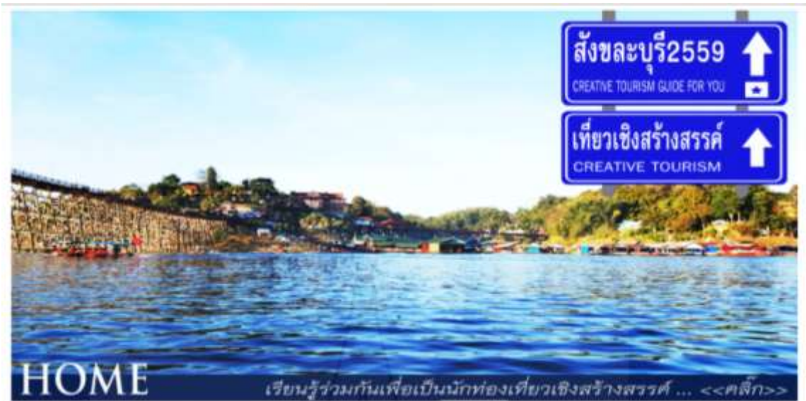
ภาพที่ 3.2 ตัวอย่างรูปแบบส่วนหัวของเว็บไซต์

2.5.3 กำหนดรูปแบบแถบเมนูในแนวนอน กำหนดรูปแบบแถบเมนูในแนวนอนในรูปลักษณะของป้ายบอกทางเวลาเพื่อเพิ่มความน่าสนใจให้เว็บไซต์ โดยแบ่งแยกหมวดหมู่เนื้อหาหลักออกเป็น 5 หมวดหมู่ ดังภาพที่ 2.3 ตัวอย่างแถบเมนูในแนวนอนของเว็บไซต์