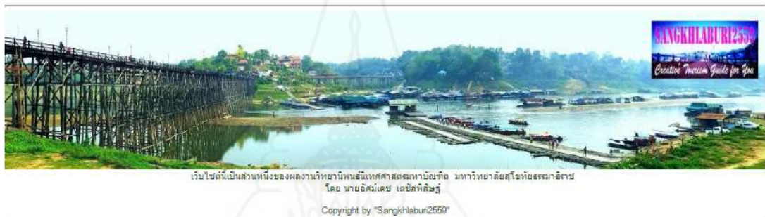
ภาพที่ 3.5 ตัวอย่างรูปแบบส่วนล่างของเว็บไซต์

2.5.9 กำหนดรูปแบบส่วนล่างของเว็บไซต์ (Page Footer) ประกอบด้วย การแสดงข้อมูลผู้เขียนและอธิบายรายละเอียดจุดประสงค์ในการจัดทำเว็บไซต์ ระบุข้อความเพื่อแสดงการเป็นเจ้าของลิขสิทธิ์อย่างชัดเจน ดังภาพที่ 2.5 ตัวอย่างรูปแบบส่วนล่างของเว็บไซต์