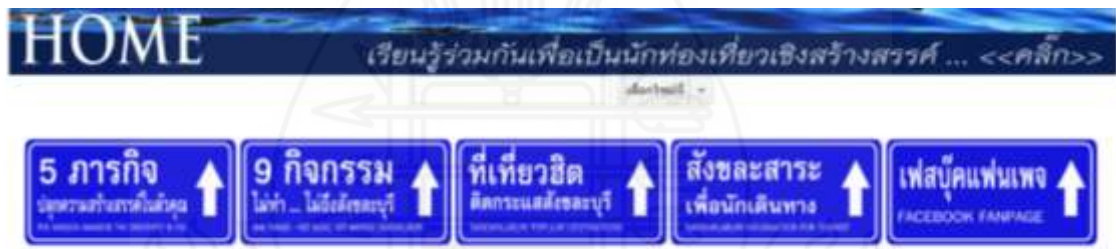
ภาพที่ 3.3 ตัวอย่างแถบเมนูในแนวนอนของเว็บไซต์

2.5.3 กำหนดรูปแบบแถบเมนูในแนวนอน กำหนดรูปแบบแถบเมนูในแนวนอนในรูปลักษณะของป้ายบอกทางเวลาเพื่อเพิ่มความน่าสนใจให้เว็บไซต์ โดยแบ่งแยกหมวดหมู่เนื้อหาหลักออกเป็น 5 หมวดหมู่ ดังภาพที่ 2.3 ตัวอย่างแถบเมนูในแนวนอนของเว็บไซต์