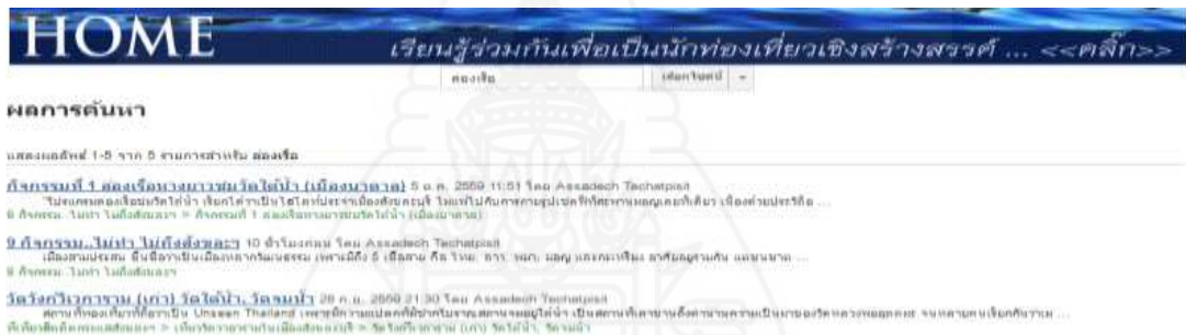
ภาพที่ 3.4 ตัวอย่างรูปแบบเครื่องมือสืบค้น (Search Engine)

2.5.7 กำหนดรูปแบบเครื่องมือการสืบค้น (Search Engine) ไว้บริเวณด้านล่างของส่วนหัว เพื่อให้ง่ายต่อการใช้งาน โดยเนื้อหาที่สืบค้นจะอยู่ภายในเว็บไซต์เป็นหลัก และสามารถเลือกเนื้อหาภายนอกเว็บไซต์ได้ที่ปุ่ม “เลือกไซต์นี้” ให้เปลี่ยนเป็น “ค้นหาเว็บ” ดังภาพที่ 2.4 ตัวอย่างรูปแบบเครื่องมือสืบค้น (Search Engine)