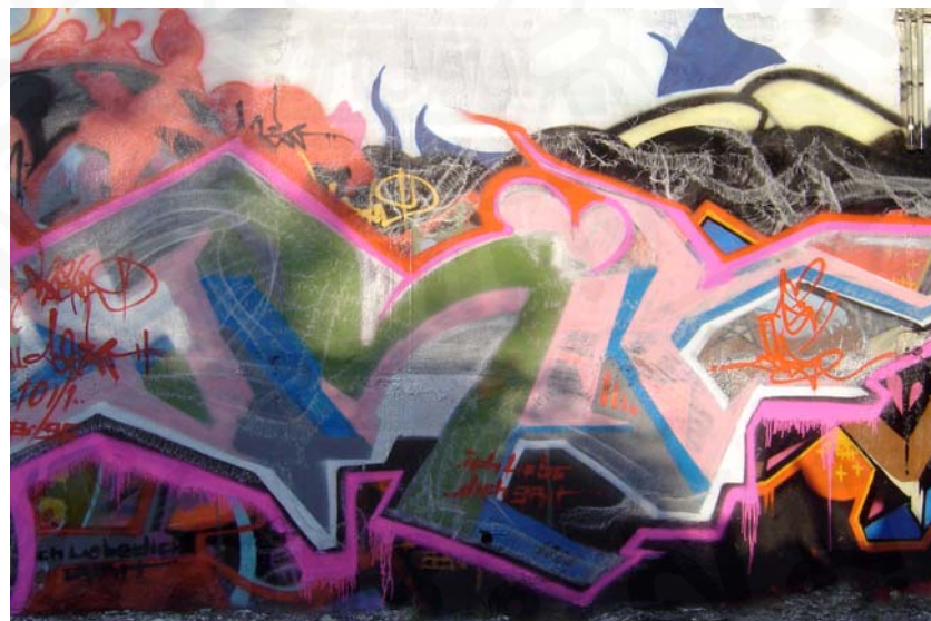
ที่มา: บนกำแพงร้างของร้าน บ้านสาโท ย่านสุขุมวิท