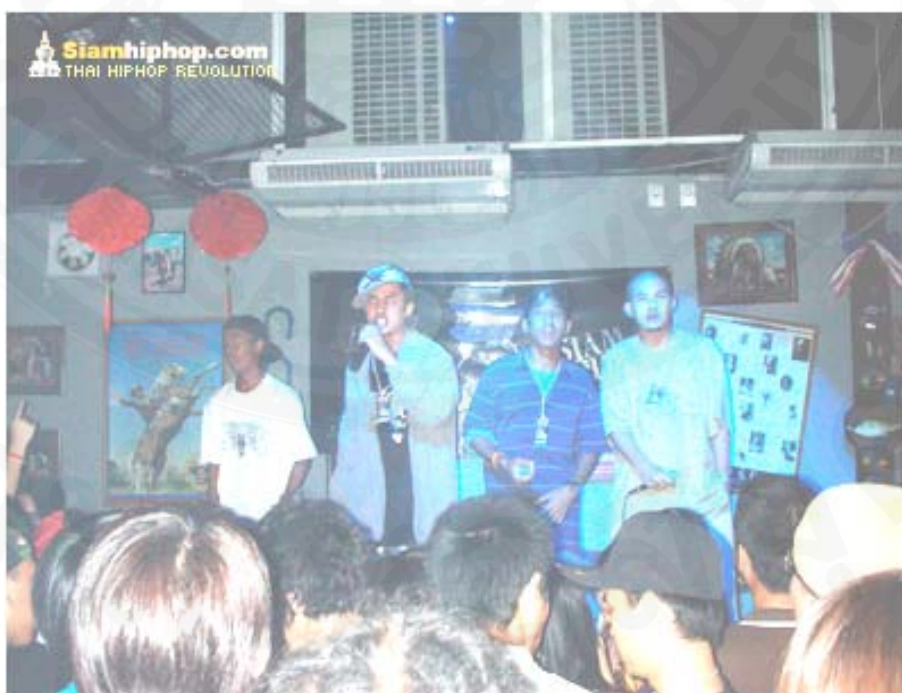
ภาพที่ 40 เด็กฮิปฮอปที่เป็นเอ็มซี