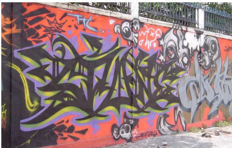
ที่มา: บนก้าแพงร้างของร้าน บ้านสาโท ย่านสุขุมวิท