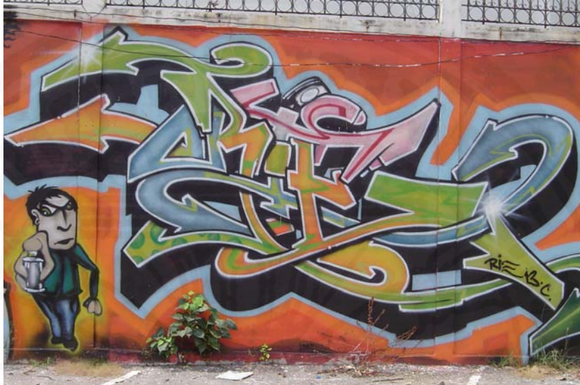
ที่มา: บนกำแพงร้างของร้าน บ้านสาโท ย่านสุขุมวิท