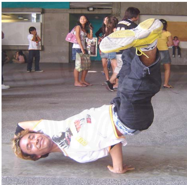
ภาพที่ 38 กิจกรรมการเต้น B-boys