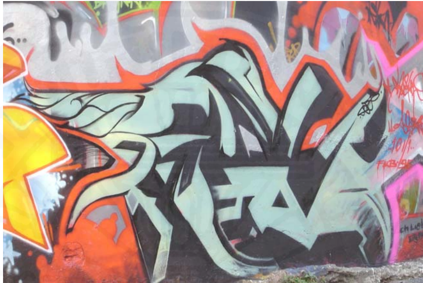
ภาพที่ 15 กราฟฟิตีแสดงความเป็นไทย