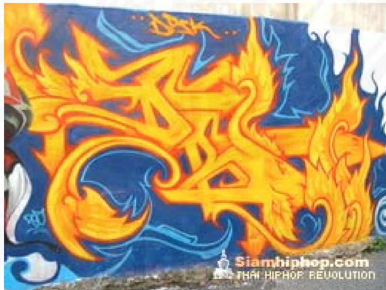
ภาพที่ 16 กราฟฟิตีแสดงความเป็นไทย