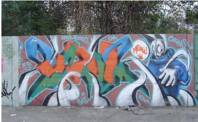
ที่มา: บนกำแพงร้างของร้าน บ้านสาโท ย่านสุขุมวิท