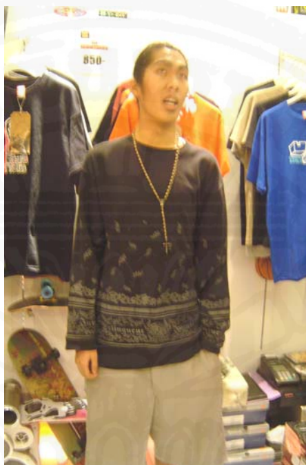
ภาพที่ 31 การแต่งกายแบบ สตรีทแวร์สไตล์