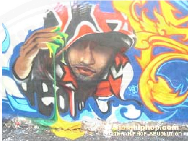
ภาพที่ 45 งานกราฟฟิตีแบบพีช ที่เน้นเรื่องการใช้สี

ที่มา: www.siamhiphop.com กำแพงร้างแห่งหนึ่งย่านสุขุมวิท