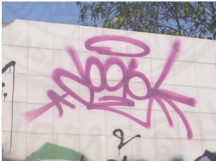
ภาพที่ 46 งานกราฟฟิตีแบบแทค ที่ไม่เน้นเรื่องการใช้สี