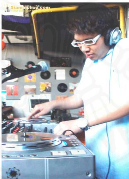
ภาพที่ 42 เด็กฮิปฮอปที่เป็นดีเจ