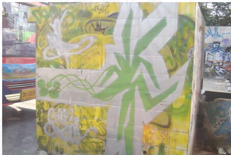
ที่มา: ผนังของปั๊มน้ำมันร้าง ย่านบางเขน