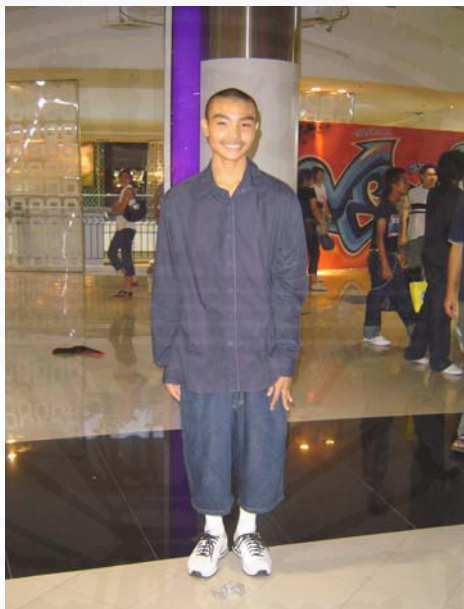
ภาพที่ 29 การแต่งกายแบบ เม็กซิกันสไตล์