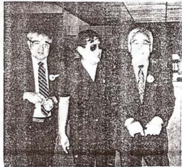
ส่ง อำนาจ สอนอิมศาสตร์ ประสาน ศิลปินอาวุโส ไปจีนแดง