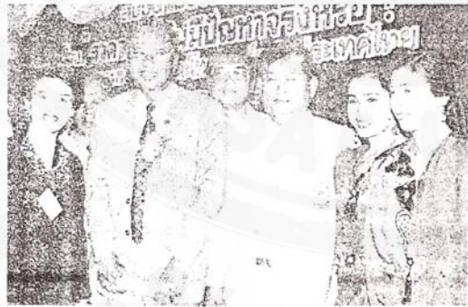
งานนิมิต พิธีกร พิธีกร