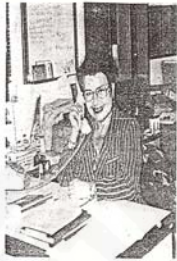
พ้องศรี เอี่ยมสนธิ นางเอกตลอดกาล