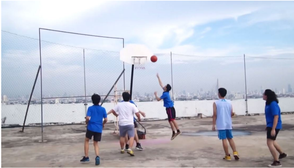
ภาพที่ 4.10 การมีน้ำใจนักกีฬา