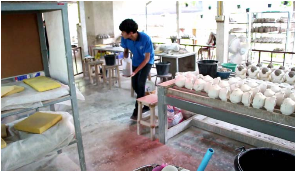
ภาพที่ 4.12 การไม่มีน้ำใจนักกีฬา