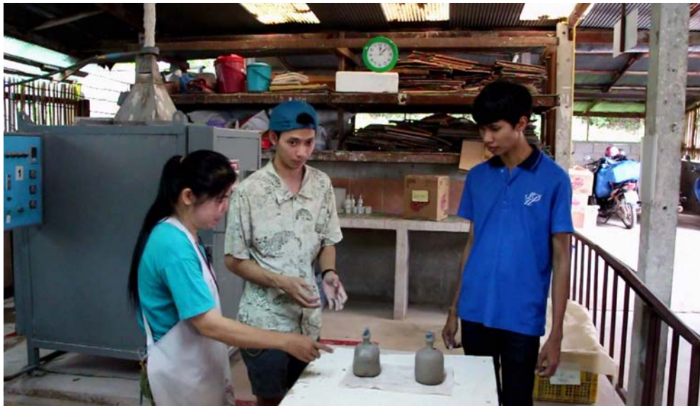
ภาพที่ 4.14 การตัดสินการแข่งขัน