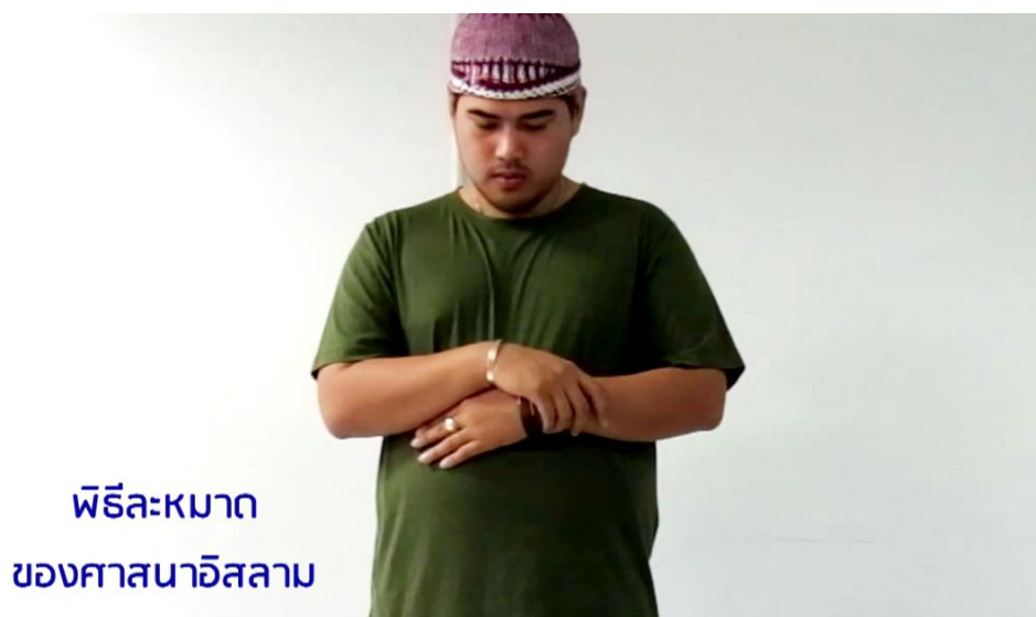
ภาพที่ 4.6 การละหมาด