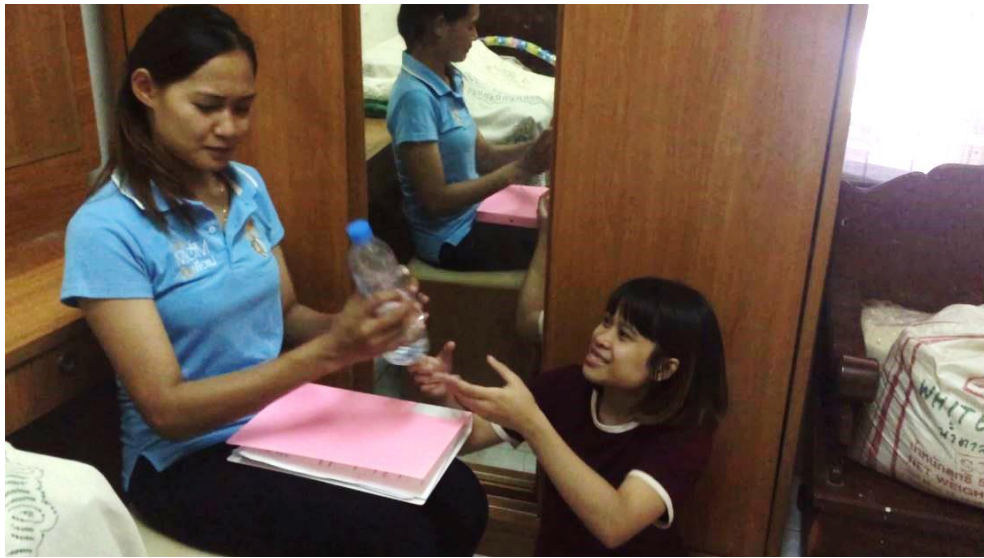
ภาพที่ 4.18 ความกตัญญูต่อมารดา