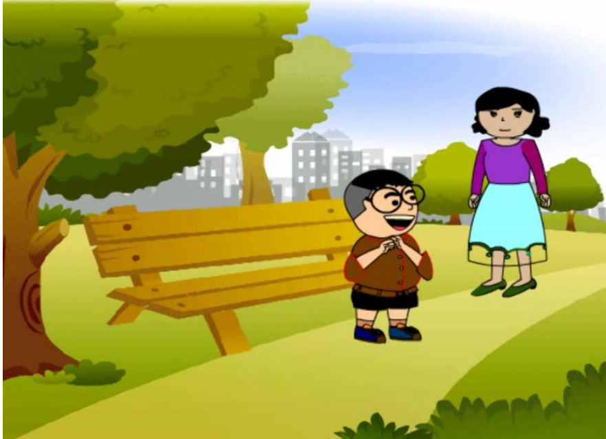
ภาพที่ 4.2 ตอนรักษาธรรมเนียมมัน

2. ชุดการเรียนรู้เพื่อส่งเสริมคุณธรรมจริยธรรมของเยาวชนภาคกลางในรูปแบบการ์ตูนแอนิเมชัน มีตัวอย่างฉากประกอบในแต่ละตอนดังนี้