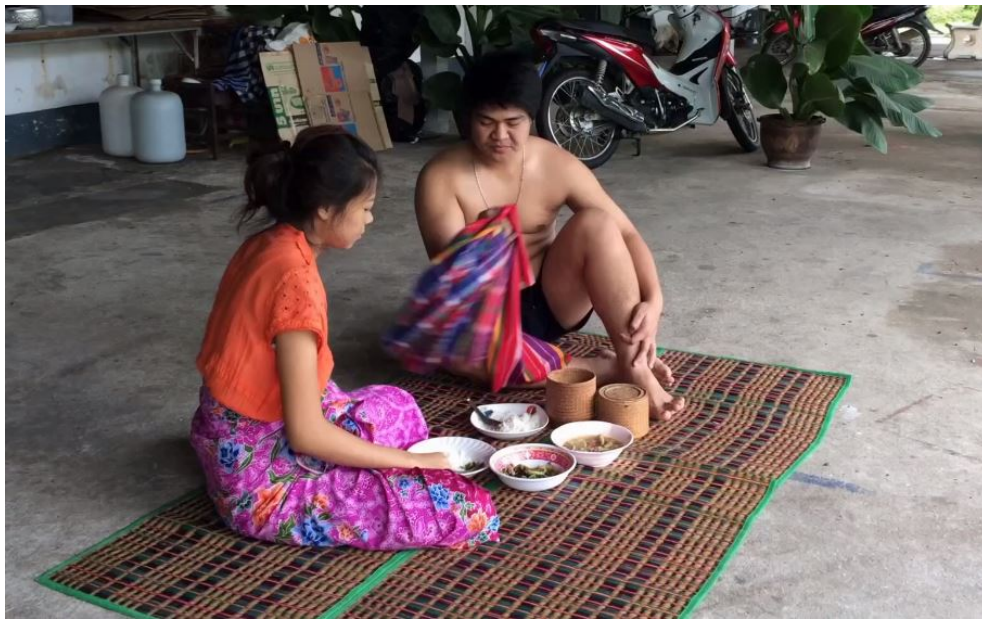
ภาพที่ 4.16 การรับประทานอาหารของภาคตะวันออกเฉียงเหนือ