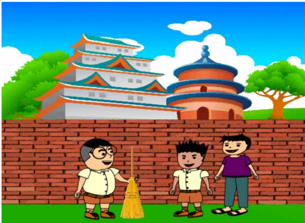
ภาพที่ 4.5 การทำตนให้เป็นประโยชน์