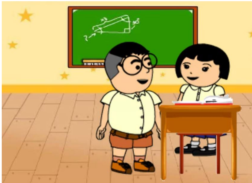
ภาพที่ 4.3 การศึกษาให้เชี่ยวชาญ