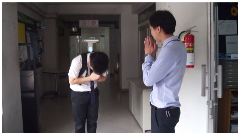
ภาพที่ 4.7 การไหว้