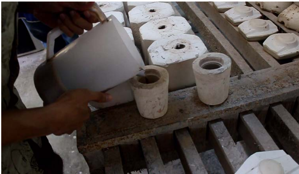
ภาพที่ 4.13 การโกงการแข่งขันปั้นเซรามิค