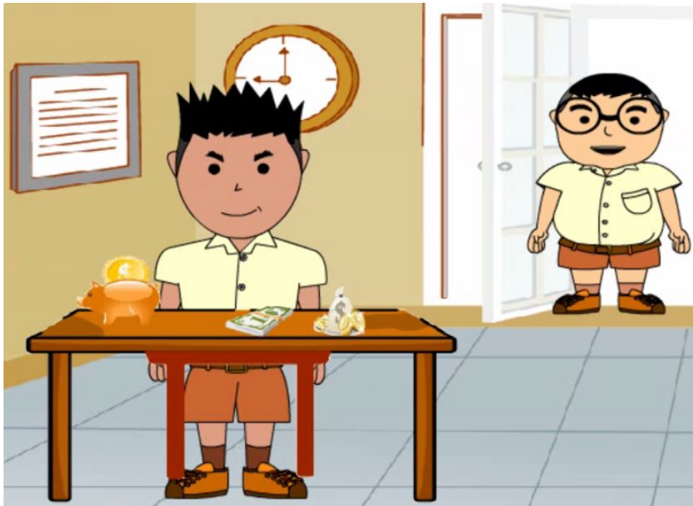
ภาพที่ 4.4 การประหยัดดอดออม