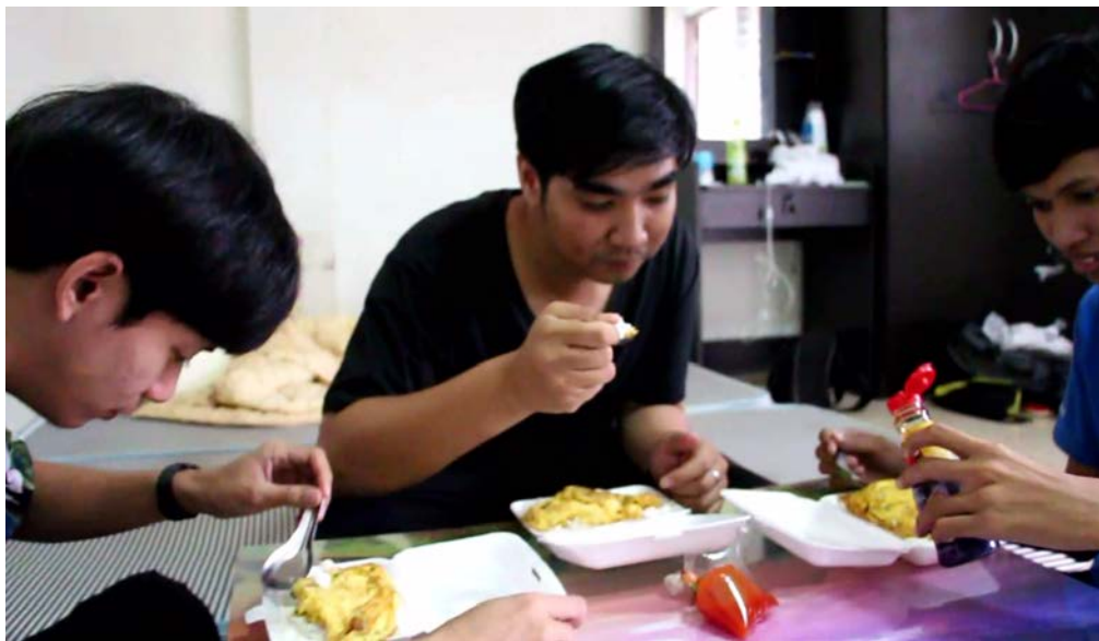
ภาพที่ 4.15 การมีน้ำใจนักกีฬาทำให้เกิดมิตรภาพ