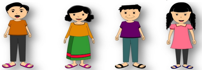
พ่อ (นิมนต์)