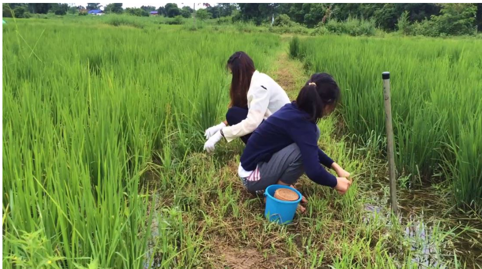
ภาพที่ 4.17 รู้รักการทำงานช่วยพ่อแม่ทำงาน