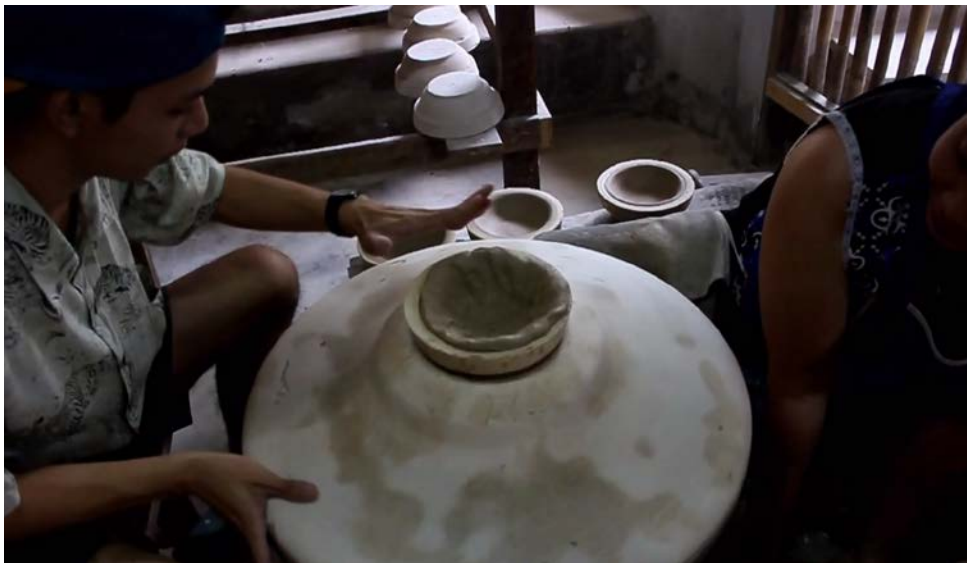
ภาพที่ 4.11 การแข่งขันปั้นเซรามิค