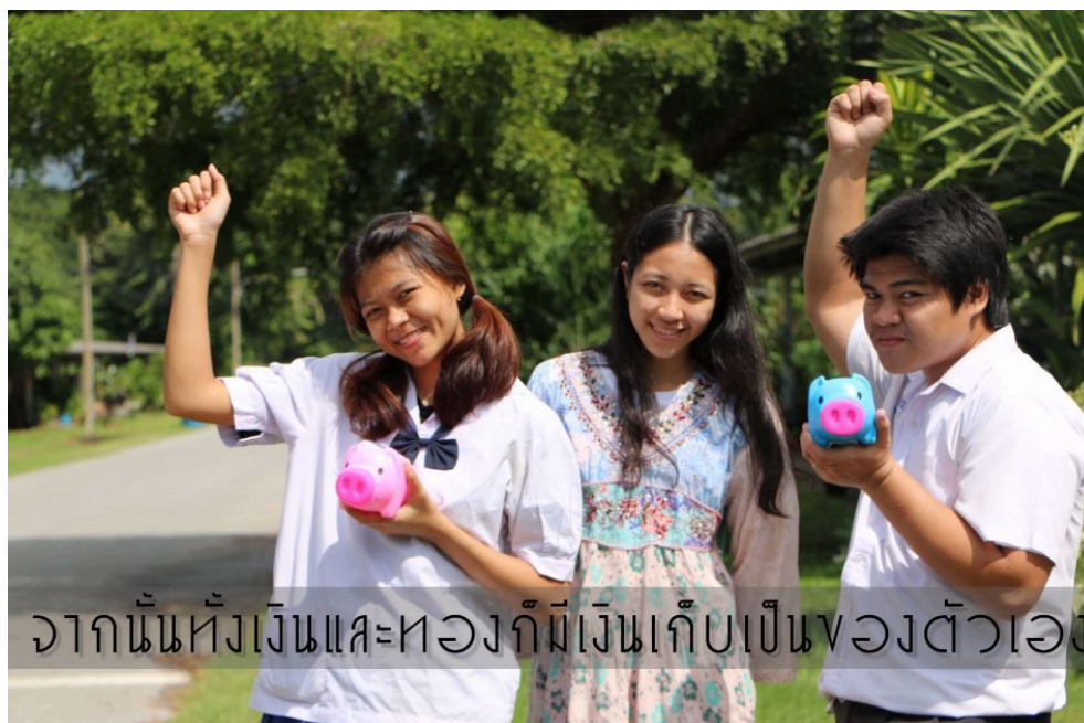
ภาพที่ 4.20 การออมเงิน