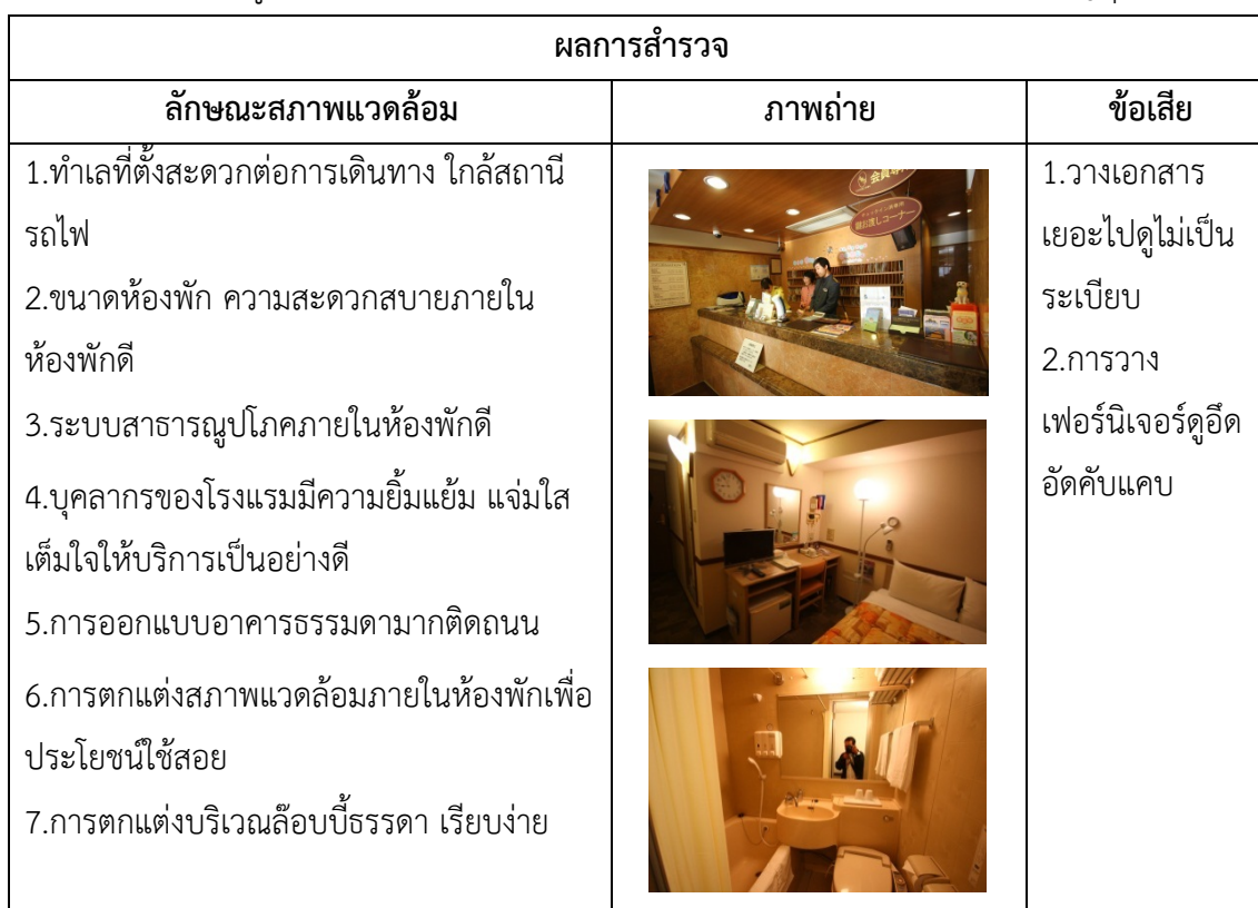
ตารางที่ 4.36 ข้อมูลสภาพแวดล้อมภายในพร้อมภาพถ่าย ซัปโปโร ฮอกไกโด ประเทศญี่ปุ่น

สำรวจจากโรงแรม ซัปโปโร ฮอกไกโด ประเทศญี่ปุ่น พบว่า โดยภาพรวมทั้งสองโรงแรมมีการออกแบบที่ดูสะอาดตา การตกแต่งลือบบีและการเลือกใช้เฟอร์นิเจอร์สวยงาม แต่ยังไม่สะท้อนเอกลักษณ์เฉพาะตัว การออกแบบพื้นที่ใช้สอยไม่ลงตัว และขนาดพื้นที่กิจกรรมบางส่วนน้อยเกินไป สรุปลักษณะสภาพแวดล้อมแยกตามโรงแรมได้ดังตารางที่ 4.36