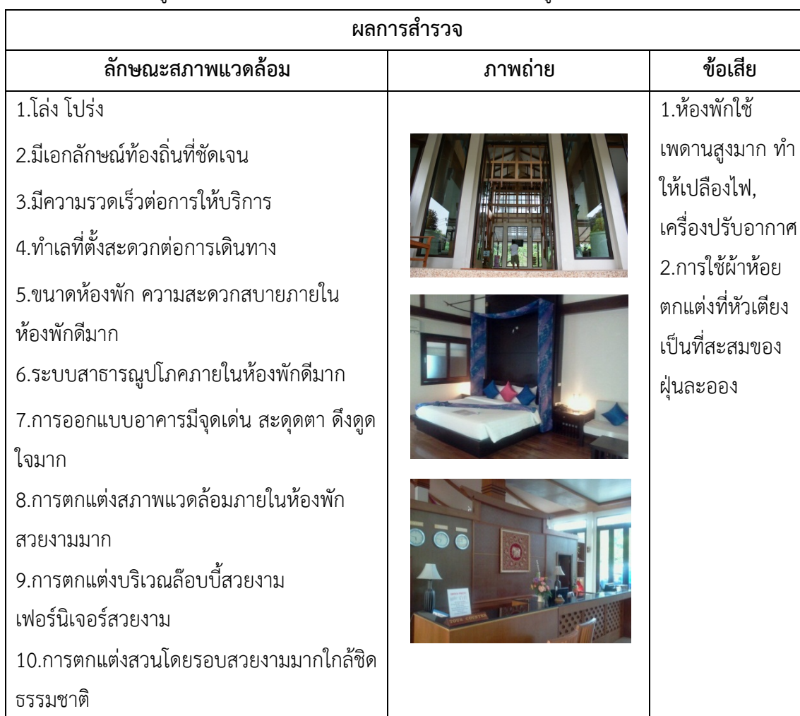
ตารางที่ 4.30 ข้อมูลสภาพแวดล้อมภายในพร้อมภาพถ่าย อ่าวนาง ภูเก็ตรา รีสอร์ท จ.กระบี่

สำรวจจากโรงแรม อ่าวนาง ภูเก็ตรา รีสอร์ท จ.กระบี่ และ Sea cono Hotel จ.ภูเก็ต พบว่า โดยภาพรวมทั้งสองโรงแรมมีขนาดห้องพักที่สะดวกสบาย ระบบการให้บริการและสิ่งอำนวยความสะดวกดี มีการออกแบบที่สื่อถึงเอกลักษณ์ท้องถิ่น แต่พบว่ามีการใช้วัสดุที่ดูแลรักษา ยากและไม่เข้ากับวัฒนธรรมท้องถิ่น สรุปลักษณะสภาพแวดล้อมแยกตามโรงแรมได้ดังตารางที่ 4.30 และ 4.31