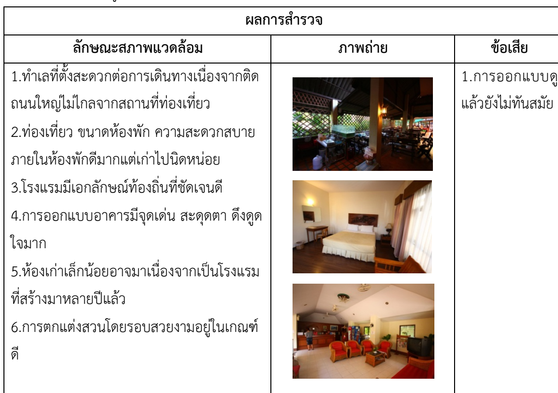
ตารางที่ 4.26 ข้อมูลสภาพแวดล้อมภายในพร้อมภาพถ่าย BaanLanna Hotel จ.เชียงราย

สำรวจจากโรงแรม The Pacific Cool Chic Hotel จ.เชียงใหม่ และ Bann Lanna Hotel จ.เชียงราย พบว่า โรงแรม Bann Lanna Hotel มีการออกแบบที่มีเอกลักษณ์ของท้องถิ่นที่ชัดเจน ในขณะที่ The Pacific Cool Chic Hotel นั้นการออกแบบยังไม่มีจุดเด่นที่น่าสะดุดตามากนัก สรุปลักษณะสภาพแวดล้อมแยกตามโรงแรมได้ดังตารางที่ 4.26 และ 4.27