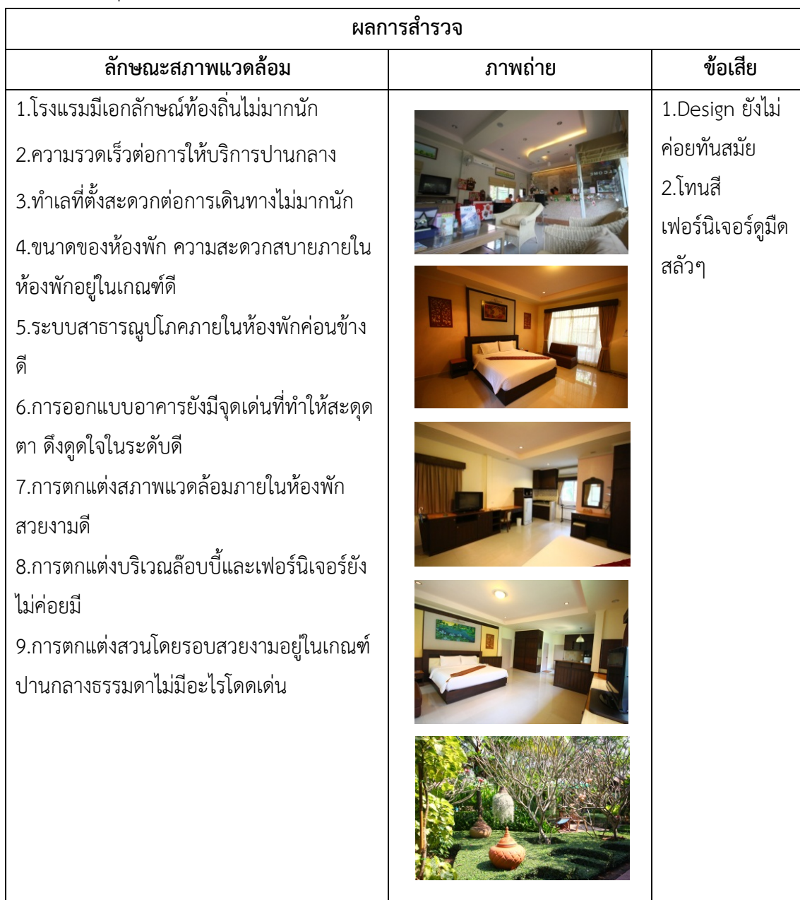
ตารางที่ 4.32 ข้อมูลสภาพแวดล้อมภายในพร้อมภาพถ่าย Villa Wanida Garden Resort พืทยา จ.ชลบุรี