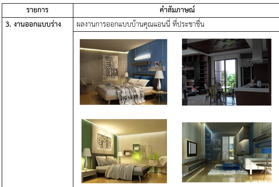
ตารางที่ 4.38 ข้อมูลแนวคิดในการออกแบบโรงแรมขนาดเล็กจากสถาปนิกและมัณฑนากร คนที่ 2