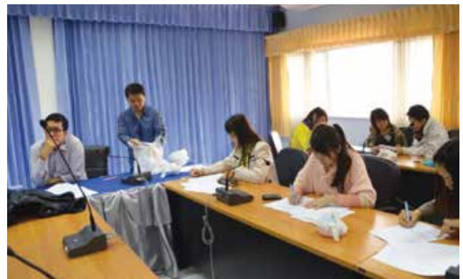
ภาพที่ 3-5 เก็บตัวอย่างเลือดและปัสสาวะ พร้อมทั้งสำรวจและสัมภาษณ์ กลุ่มอาสาสมัครในแต่ละอำเภอของจังหวัดเชียงราย ระหว่างวันที่ 16-26 ธันวาคม 2557