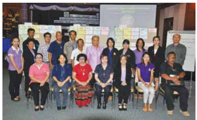
ภาพที่ 3-10 จัดประชุมสรุปผลโครงการวิจัย วันที่ 21 กรกฎาคม 2558 ณ ห้องประชุมเทศบาลเมืองน่าน อำเภอเมืองน่าน จังหวัดน่าน