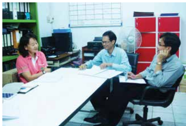
ภาพที่ 3-1 ประสานงานในพื้นที่จังหวัดเชียงรายและจังหวัดน่านระหว่างวันที่ 14-17 ตุลาคม 2557