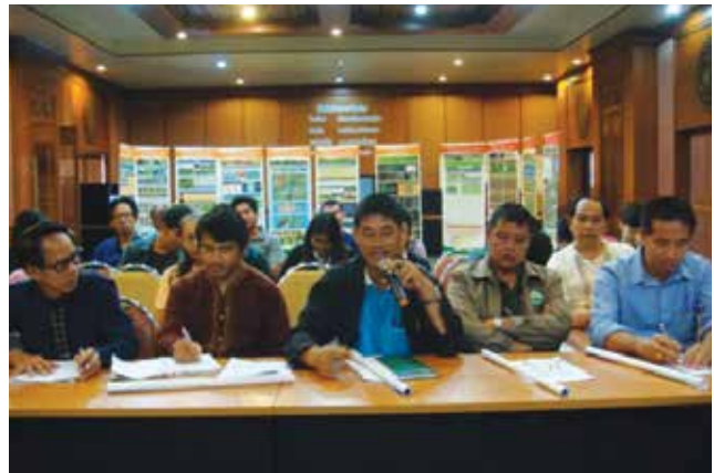
ภาพที่ 3-2 ประชุมชี้แจงรายละเอียดโครงการวิจัยวันที่ 14 พฤศจิกายน 2557 ณ ห้องประชุมเทศบาลเมืองน่าน อำเภอเมืองน่าน จังหวัดน่าน