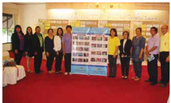
ภาพที่ 3-11 จัดประชุมสรุปผลโครงการวิจัย วันที่ 28 กรกฎาคม 2558 ณ ห้องประชุมสี่ป้อ โรงแรมริมกก อำเภอเมือง จังหวัดเชียงราย