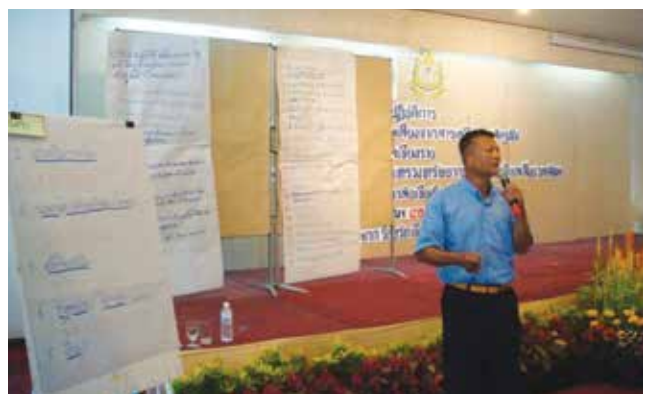
ภาพที่ 3-8 จัดประชุมระดมความคิดเห็นแนวทางการจัดการความเสี่ยงจากสารเคมีกำจัดศัตรูพืชจังหวัดเชียงราย โดยใช้กระบวนการมีส่วนร่วม วันที่ 19 พฤษภาคม 2558 ณ ห้องประชุมสี่ป้อ โรงแรมริมกก อำเภอเมือง จังหวัดเชียงราย