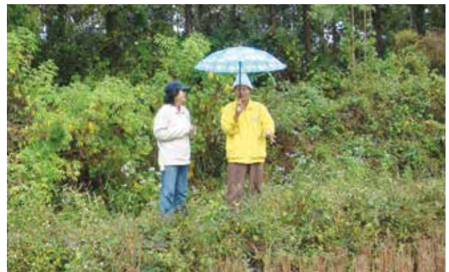
ภาพที่ 3-7 การเก็บตัวอย่างดิน น้ำ และพืช ในพื้นที่เกษตรกรรม และสำรวจ สัมภาษณ์วิถีปฏิบัติในการเกษตรจังหวัดเชียงราย ระหว่างเดือนมกราคม - กุมภาพันธ์ 2558