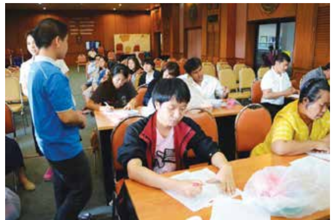
ภาพที่ 3-4 เก็บตัวอย่างเลือดและปัสสาวะ พร้อมทั้งสำรวจและสัมภาษณ์ กลุ่มอาสาสมัครในแต่ละอำเภอของจังหวัดน่าน ระหว่างวันที่ 1-12 ธันวาคม 2557