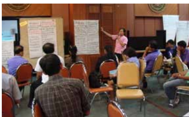
ภาพที่ 3-9 จัดประชุมระดมความคิดแนวทางการจัดการความเสี่ยงจากสารเคมีกำจัดศัตรูพืชจังหวัดน่าน โดยใช้กระบวนการมีส่วนร่วม วันที่ 26 พฤษภาคม 2558 ณ ห้องประชุมเทศบาลเมืองน่าน อำเภอเมืองน่าน จังหวัดน่าน