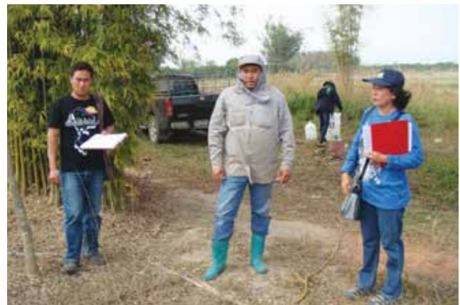
ภาพที่ 3-6 การเก็บตัวอย่างดิน น้ำ และพืช ในพื้นที่เกษตรกรรม และสำรวจ สัมภาษณ์วิถีปฏิบัติในการเกษตรจังหวัดน่าน ระหว่างเดือนธันวาคม 2557 – มกราคม 2558