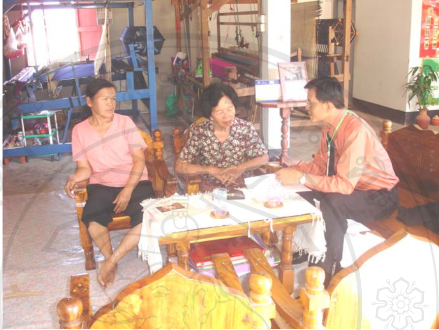
รูปสัมภาษณ์ กรณีศึกษาที่ 1 กลุ่มทอผ้าไทลื้อบ้านทุ่งมอก