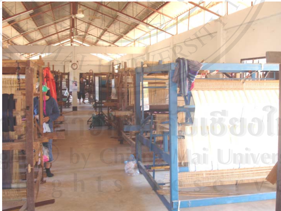
รูปโรงงานทอผ้า กลุ่มทอผ้าไทลื้อบ้านทุ่งมอก