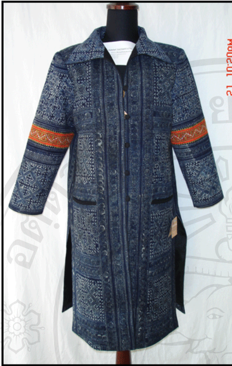
ชื่อผลิตภัณฑ์ : เสื้อลำเรือรูป (ผ้าฝ้ายเขียนเทียนลายโบราณ) ชื่อผู้ผลิต : กลุ่มผลิตภัณฑ์ชาวเขาแปรรูป