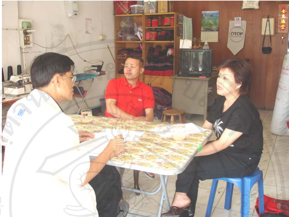
รูปสัมภาษณ์ กรณีศึกษาที่ 4 กลุ่มผลิตภัณฑ์ชาวเขาแปรรูป