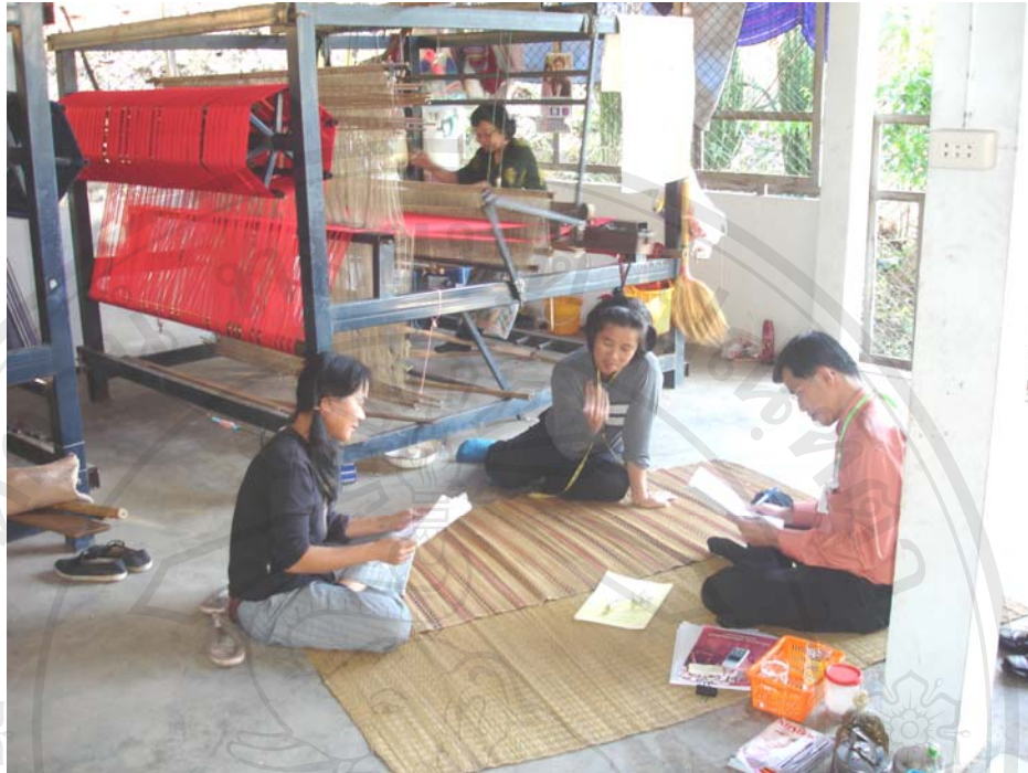
รูปสัมภาษณ์ กรณีศึกษาที่ 2 กลุ่มทอผ้าไทลื้อบ้านต้นปูเลย