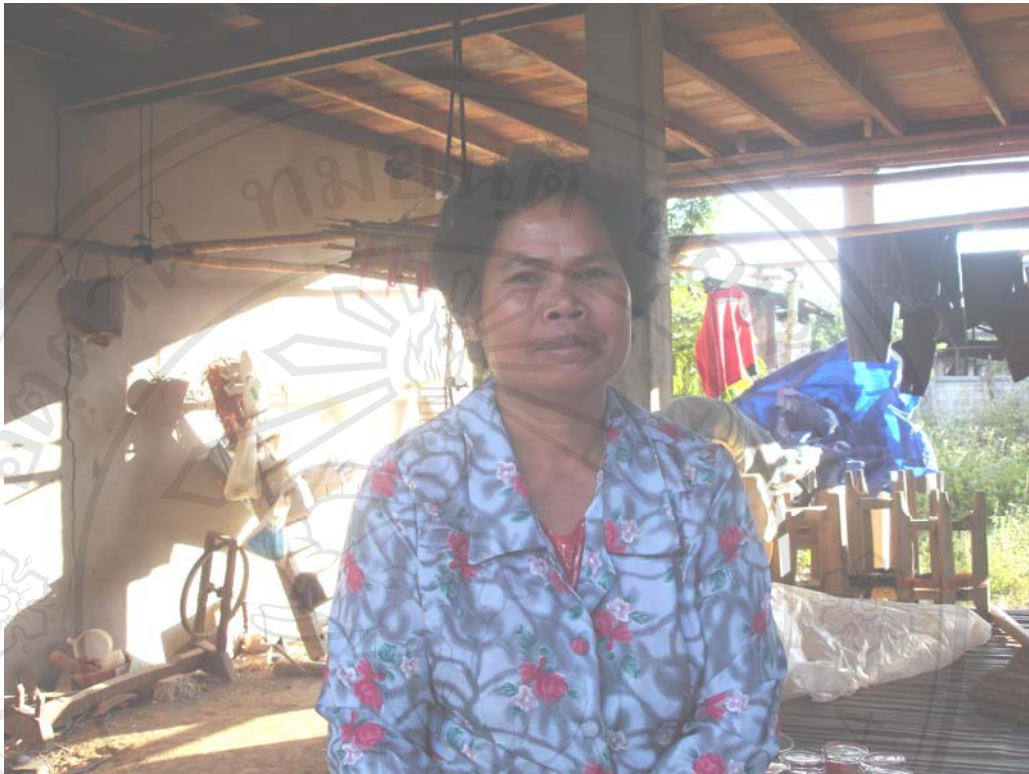
รูปสัมภาษณ์ กรณีศึกษาที่ 3 กลุ่มสตรีสหกรณ์ทอผ้าบ้านวังขอนแดง