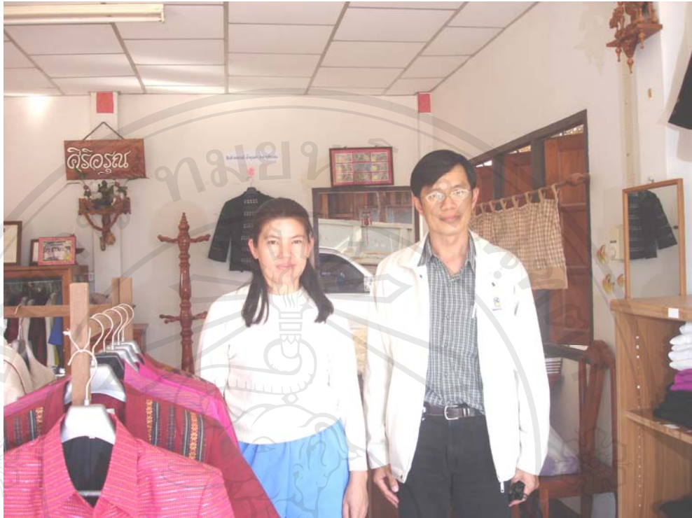
รูปสัมภาษณ์ กรณีศึกษาที่ 5 กลุ่มตัดเย็บสหกรณ์สตรีแม่ใจ