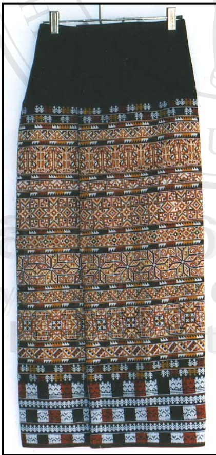
ชื่อผลิตภัณฑ์ : กางเกงป้าย ชื่อผู้ผลิต : กลุ่มผลิตภัณฑ์ชาวเขาแปรรูป