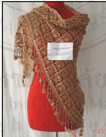
ชื่อผลิตภัณฑ์ : ผ้าคลุมไหล่ลายแมงมุม ชื่อผู้ผลิต : กลุ่มถักโครเชต์บ้านชาตฤๅชาง