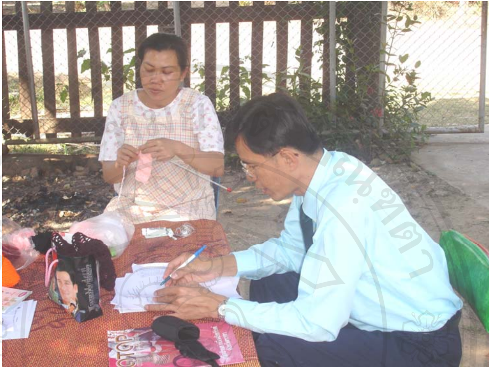
รูปสัมภาษณ์ กรณีศึกษาที่ 7 กลุ่มอัครโครเซตบ้านธาตุภูซาง