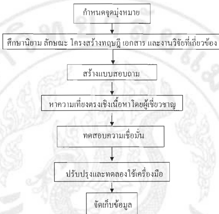
ภาพ 3 ลำดับขั้นตอนการสร้างแบบสอบถามภาวะหนี้สินและความต้องการประกอบอาชีพเสริมรายได้

แบบสอบถามภาวะหนี้สินและความต้องการประกอบอาชีพเสริมรายได้ ผู้วิจัย ได้ดำเนินการ เป็นลำดับขั้น ดังแสดงในภาพ 3 ต่อไปนี้