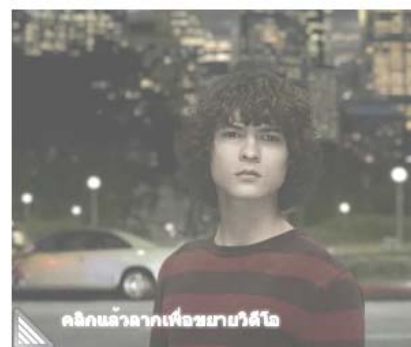
พื้นที่โฆษณา