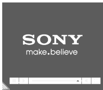
ในทีวีโฆษณา