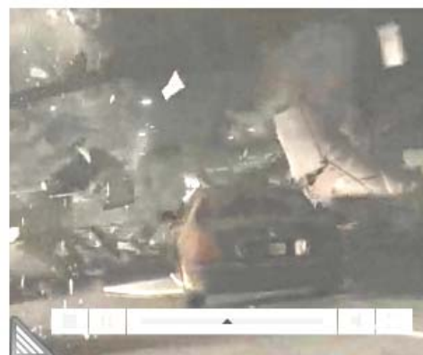
พื้นที่โฆษณา