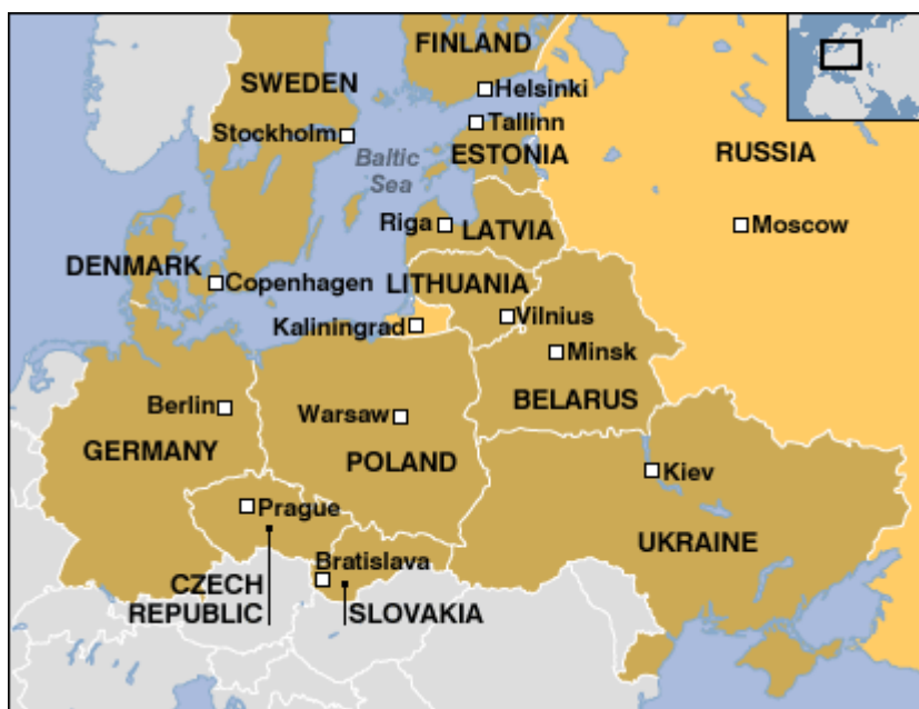
รูปภาพที่ 4.1 แผนที่เมืองคาลินินกราด ประเทศรัสเซีย