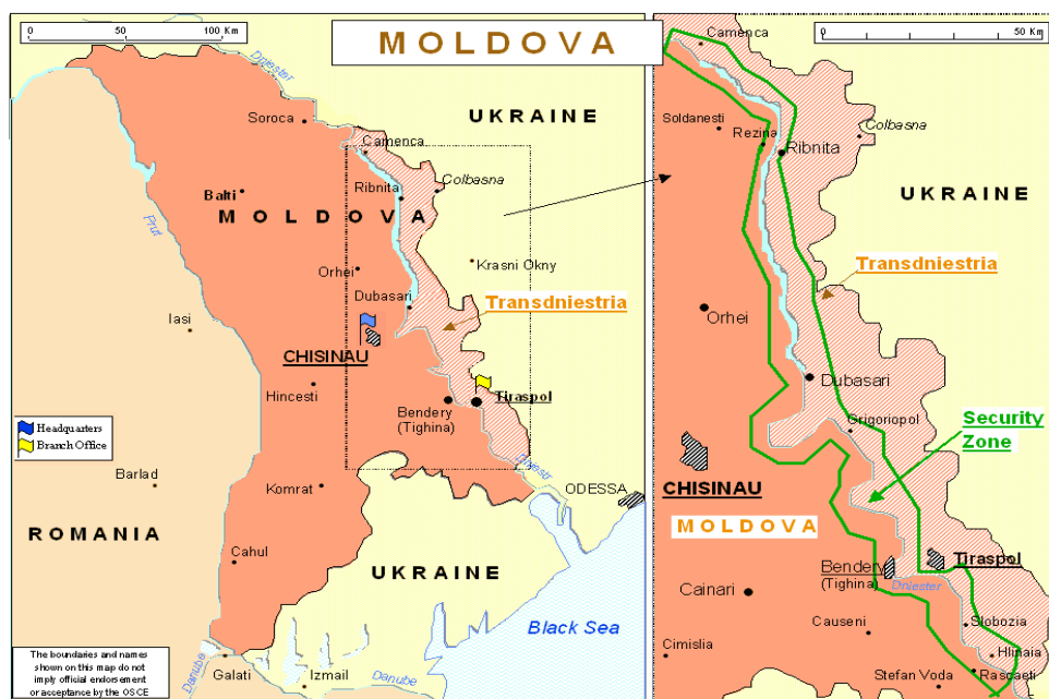
รูปภาพที่ 4.6 แผนที่มอลโดวา และทรานนิสเทรีย