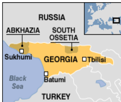
รูปภาพที่ 4.5 แผนที่แสดงฐานทัพของรัสเซียในจอร์เจีย