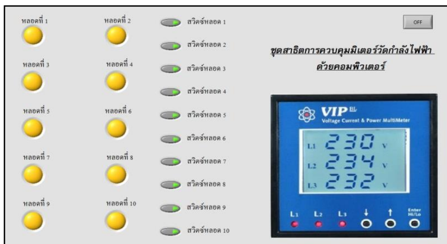
รูปที่ 3.1 โครงสร้างของชุดทดลอง