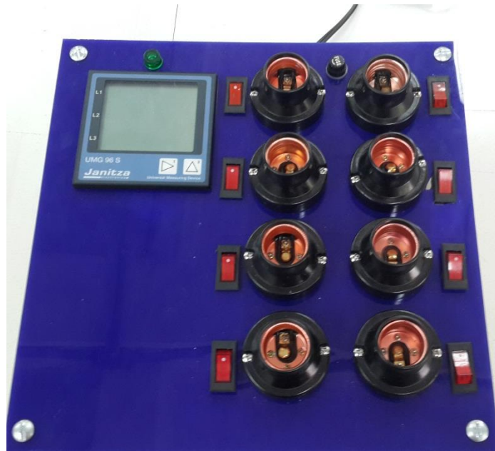
รูปที่ 3.2 โครงสร้างของอุปกรณ์เมื่อติดตั้งอุปกรณ์แล้ว

2. เมื่อออกแบบเสร็จแล้วทำการติดตั้งอุปกรณ์ที่จัดเตรียมไว้ลงในแผ่นอะคริลิกที่เตรียมไว้