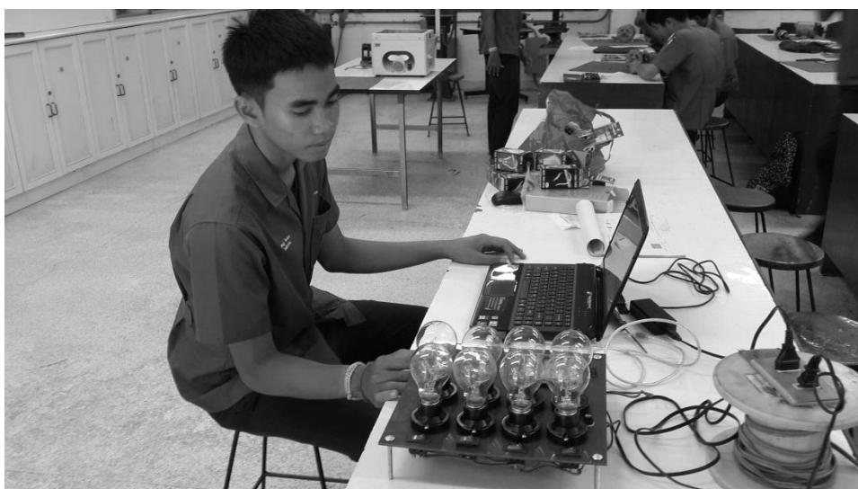
รูปที่ 3.5 นักเรียนกลุ่มตัวอย่างกำลังต่อใช้งานชุดทดลองเพื่อหาประสิทธิภาพ