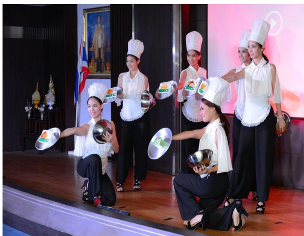
นิทรรศการอาหารไทยเพื่อสุขภาพเชิงพาณิชย์ (อาหารลดพลังงาน)