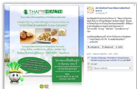
การประชาสัมพันธ์ผ่าน Facebook