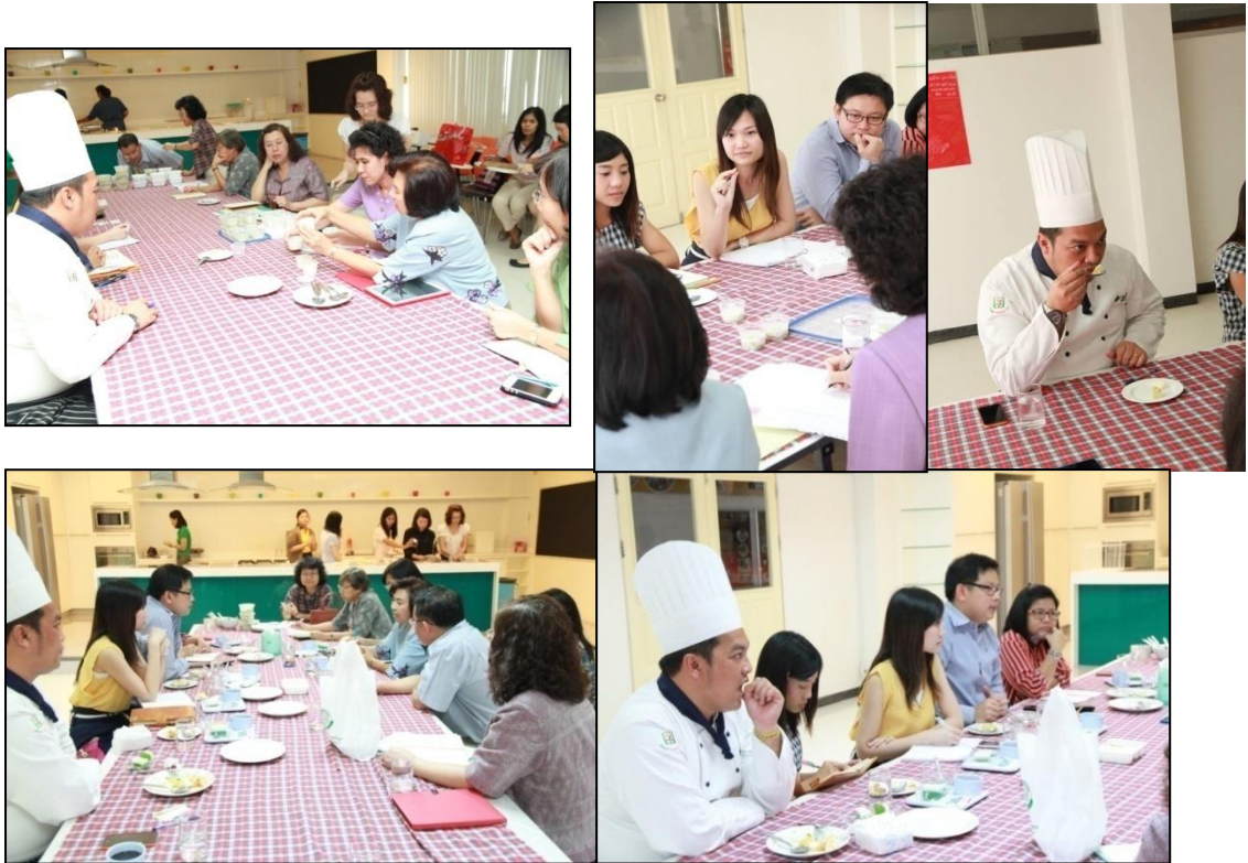
การชิมผลิตภัณฑ์อาหารไทยเพื่อสุขภาพ (ต้นแบบ)