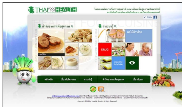
การประชาสัมพันธ์ผ่าน Website

- Website ได้แก่ http://www.ifrpd.ku.ac.th และ http://www.thaifoodforhealth.com