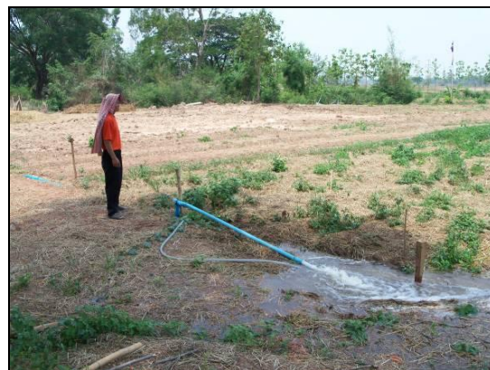
แปลงผักของกลุ่มที่เตรียมสำหรับการปลูกผักผสมผสานตามแนวเศรษฐกิจพอเพียง