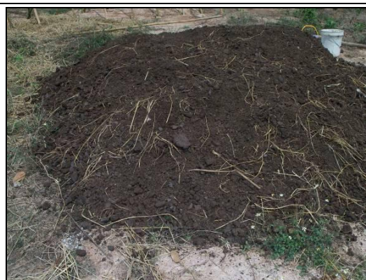
วัตถุดิบในการทำปุ๋ยหมักได้แก่ฟางข้าวและมูลโค