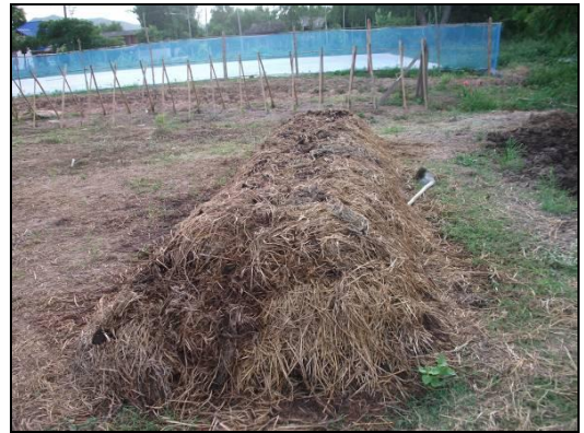
กองปุ๋ยหมักรุ่นที่ 2 ที่ทางกลุ่มได้ทำขนาด 2 ตัน จำนวน 1 กอง