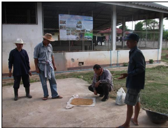
การเตรียมเมล็ดพันธุ์ข้าวของกลุ่ม