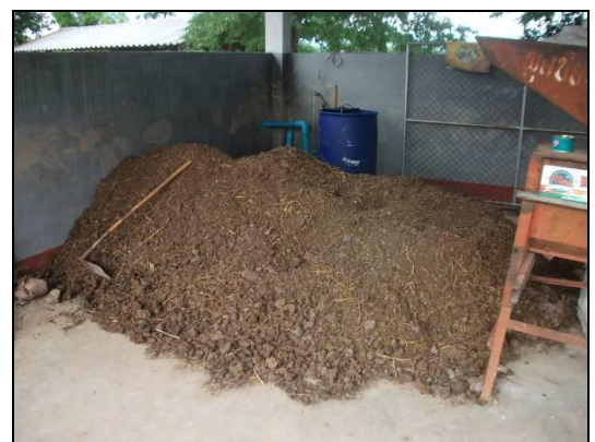
ฟางข้าวและมูลโคที่ทางกลุ่มได้เตรียมสำหรับการทำปุ๋ยหมัก