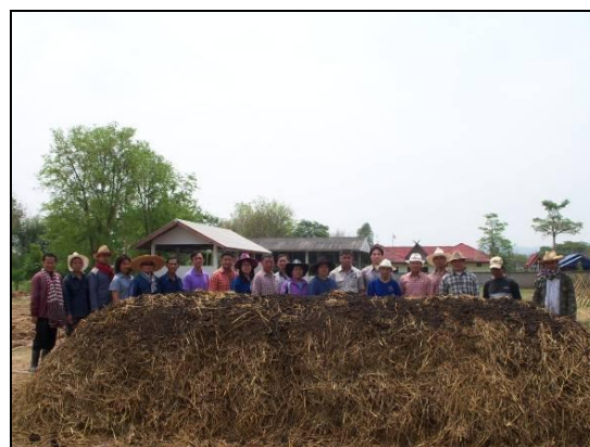
ลงมือปฏิบัติทำกองปุ๋ยสาธิต