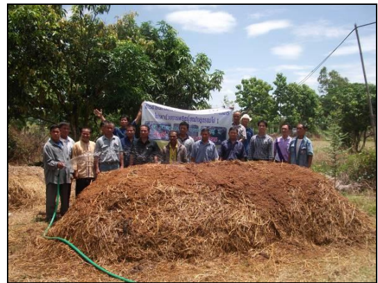
การสาธิตการทำปุ๋ยหมักวิธีวิศวกรรมแม่โจ้ 1 ให้กับเกษตรกรผู้เข้ารับการฝึกอบรม