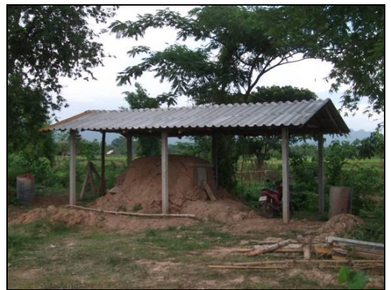
การทำน้ำส้มควันไม้ของกลุ่ม