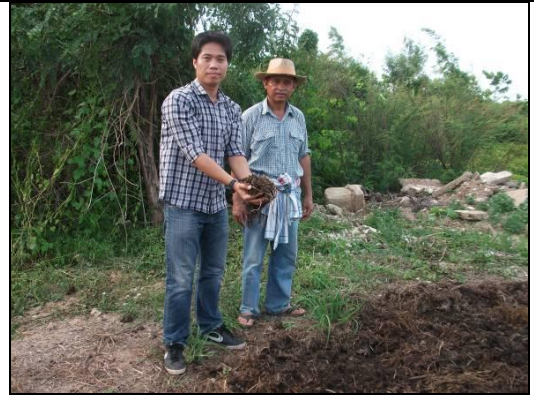
สภาพปุ๋ยหมักของกลุ่มที่หมักเสร็จสมบูรณ์รอการตากแห้ง