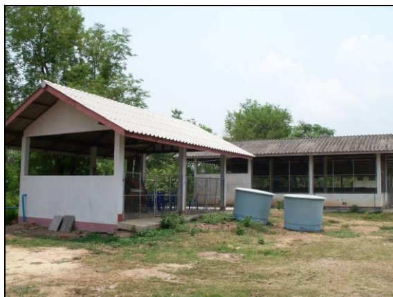
อาคารเก็บวัสดุและอุปกรณ์ของกลุ่มที่ดัดแปลงจากอาคารโรงฆ่าสัตว์เก่าของเทศบาล