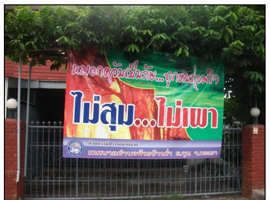
เทศบาลตำบลห้วยข้าวก่ามีการรณรงค์การลดการเผาอย่างจริงจัง