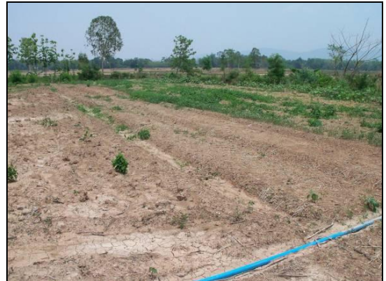
แปลงผักของกลุ่มที่เตรียมสำหรับการปลูกผักผสมผสานตามแนวเศรษฐกิจพอเพียง