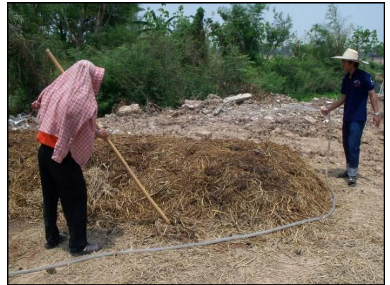
การสาธิตการเติมน้ำรักษาความชื้นให้กับกองปุ๋ย