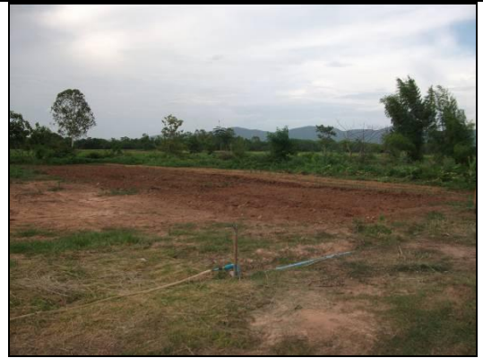
พื้นที่ในฐานที่ได้จัดทำเป็นแปลงปลูกผักอินทรีย์แบบผสมผสาน