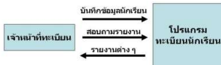
รูป 3.1 กระบวนการทำงานของระบบทะเบียนนักเรียนเดิม

ผู้วิจัยได้ทำการวิเคราะห์การทำงานของระบบทะเบียนนักเรียนแบบเดิม ซึ่งเป็นระบบที่ทางโรงเรียนมงฟอร์ตวิทยาลัยได้จ้างบริษัทมาเขียนโปรแกรม ฐานข้อมูลเป็นออราเคิล ค่าตัวเบสเวอร์ชัน 8.05 สำหรับวินโดวส์เอ็นที และมีออราเคิล เดเวลอปเปอร์ 2000 เป็นส่วนติดต่อกับผู้ใช้ โดยการทำงานนั้นเจ้าหน้าที่ทะเบียนจะทำการบันทึกข้อมูลนักเรียน ได้แก่ ประวัตินักเรียน การเปลี่ยนชื่อ-นามสกุล การลาออก เป็นต้น เข้าสู่ระบบโปรแกรมทะเบียนนักเรียนและให้โปรแกรมแสดงรายงานตามที่ต้องการ (ดังรูป 3.1)