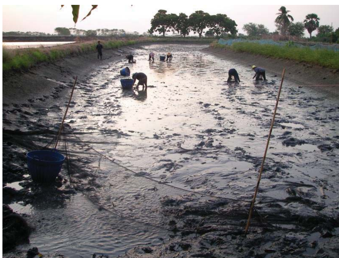
ภาพที่ 9 การล้างบ่อจับกุ้ง

ช่วง 4-5 ปีที่ผ่านมาพวกเปลี่ยนมาใช้วิธีซื้อกุ้งที่เขาอนุบาลแล้วมาเลี้ยงเลยทั้งนี้ไม่ต้องเสียเวลา ยังได้กุ้งป่วยแรกยังดี เพราะว่า กุ้งจะตัวยังไม่ใหญ่ เขาขายเป็นกิโลนะ ร้อยกว่าตัวโล ๆ ละร้อยกว่าบาท ตกตัวละบาทได้ เอามาปล่อย ใช้ใบพัดตีน้ำให้อย่างดีมี นี่ถ้าได้ก้ามทองมาเลี้ยงนะดีเลย แต่เจ้าของบ่อเขาไม่ค่อยจะขายให้สิ ราคามันแพงกว่าไง ก็เลยเลี้ยงไซค์รวมกันเลี้ยงแค่ 3 เดือนก็วิดบ่อจับขายหมดเลย เอาไปส่งแพหรือขายปากบ่อก็ได้ มีคนแย่งซื้อตลอด (มี สระทองขุน 2554)