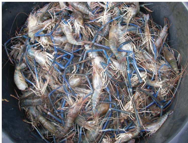
ภาพที่ 4 กุ้งจิกโก

จำนวนที่ต้องการ ในปริมาณที่หนาแน่นพอสมควร เกษตรกรจะเลี้ยงกุ้งไปจนอายุครบประมาณ 4 เดือน แล้วจึงลากกุ้งที่แตกไข่ออกจำหน่ายก่อน จำพวกกุ้งตัวเมียที่เกร็น และกุ้งจิกโกซึ่งเป็นกุ้งเพศผู้ที่เลี้ยงไม่โต เนื้อลึบ ส่วนกุ้งที่ยังไม่โตเต็มที่ก็ปล่อยกลับลงบ่อเช่นเดิมเพื่อเลี้ยงต่อไป