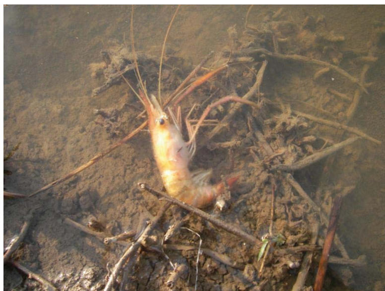
ภาพที่ 22 กุ้งตายเนื่องจากน้ำน้อยและอากาศร้อนจัด

เลี้ยงก้ามกรามไม่ค่อยมีปัญหาหรอกนะ ปัญหาที่จะมีก็คงเป็นเรื่องอากาศนี้แหละ เดี่ยวร้อน เดี่ยวหนาว หน้าหนาวนี้กุ้งไม่กินอาหารเลย น้ำร้อนถ้าน้ำน้อยกุ้งก็อาจตายได้ ต้องเติมน้ำให้ตลอด เดี่ยวนี้เราก็เอาใบพัดตีน้ำให้ตลอด เพิ่มออกซิเจนในน้ำไป กุ้งจะได้ไม่ขึ้น ร้อนจัดๆ บางทีน้ำในคลองแห้ง ไม่มีน้ำ บางบ่อเขาไม่ติดคลองใหญ่ ไม่มีน้ำวิดเข้า ก็อันตรายเหมือนกัน แต่ถ้ามีปัญหาที่ก็วิดจับเลย ไม่แก้หรอก กว่าจะได้ยา กว่าจะได้สังเกต พอดีกุ้งน้อคหมดบ่อ (พิชัย วิจิตรธำรงค์ดี 2554)