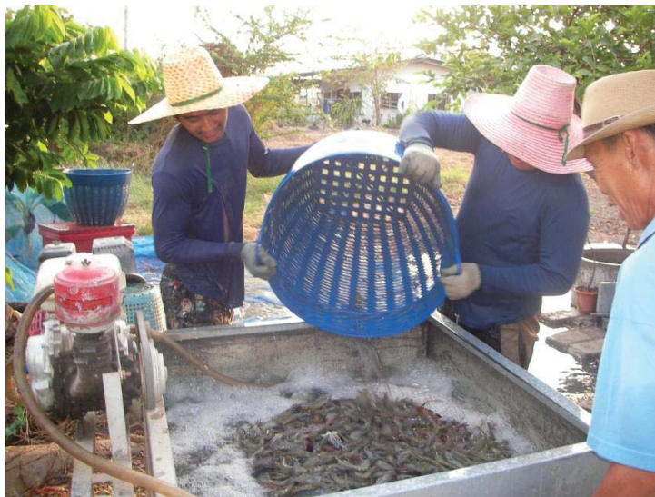
ภาพที่ 11 พักกุ้งลงถังที่ตีเครื่องให้ออกซิเจน เพื่อรอคัดและจำหน่าย

จากการสอบถามถึงชีวิตความเป็นอยู่ของเกษตรกรในช่วงการเลี้ยงแบบพัฒนาพบว่า เกษตรกร มีความเป็นอยู่ที่เป็นที่พึงพอใจของตัวเอง เนื่องจากในช่วงของการเลี้ยงกุ้งแบบพัฒนานี้ เกษตรกรสามารถผลิตกุ้งเพื่อส่งขายในราคาที่สูงขึ้น กุ้งจะมีขนาดตัวโตกว่าการเลี้ยงแบบดั้งเดิมและแบบขยาย เนื่องจากปล่อยกุ้งบาง เกษตรกรมีความประสงค์จะขยายพื้นที่ในการ