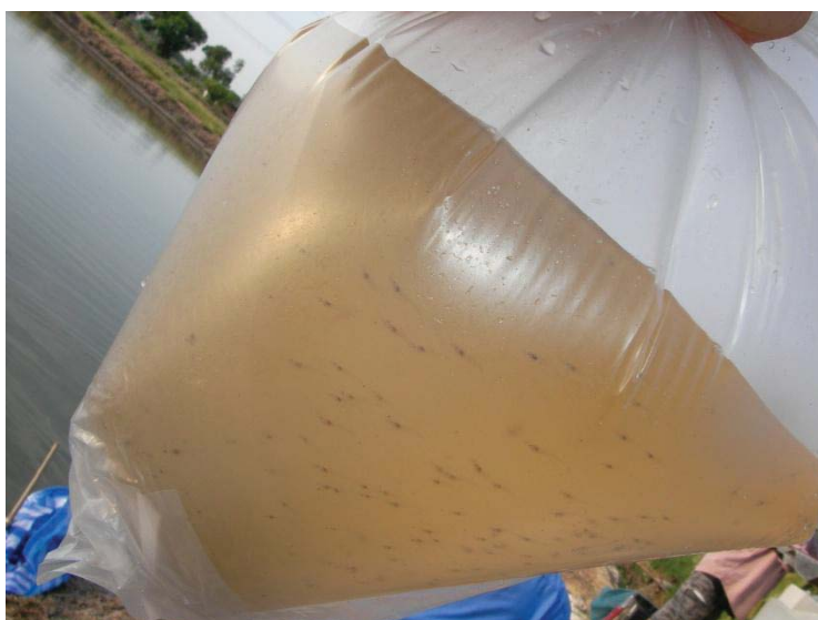
ภาพที่ 3 กุ้งก้ามกรามไซต์พี

ครอบครองของแต่ละราย จากนั้นจะหว่านปูนขาวลงพื้นบ่อเพื่อเป็นการปรับสภาพพื้น และสูบน้ำเข้า ซึ่งการสูบน้ำเกษตรกรจะสูบน้ำจากคลองหรือแม่น้ำเข้าบ่อโดยตรง การสูบน้ำเข้าบ่อโดยวิธีนี้ เกษตรกร จำเป็นจะต้องดูก่อนว่าน้ำในช่วงนั้นเป็นน้ำที่มีการสูบน้ำออกจากบ่ออื่นหรือไม่ เพราะอาจเป็นไปได้ที่จะมีโรคปะปนมากับน้ำ การสูบน้ำเข้าบ่อเพื่อปล่อยกุ้งเล็กอนุบาลจะสูบน้ำสูงประมาณ 80-100 ซม. และใช้ทางมะพร้าวหักครึ่งทำเป็นขั้วเพื่อเป็นที่อยู่ของกุ้งเล็กที่นำมาปล่อย