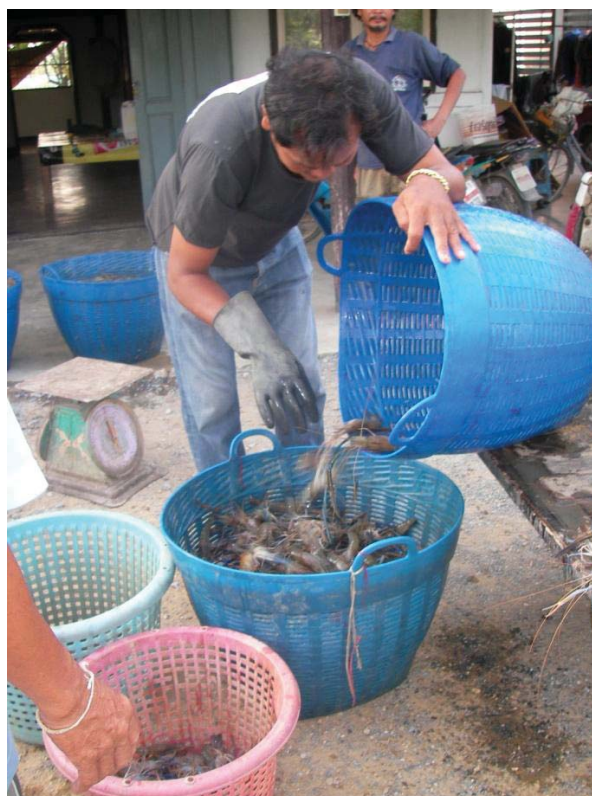
ภาพที่ 18 การตรวจสอบกุ้งก่อนชั่งกิโลสำหรับจำหน่ายปากบ่อ