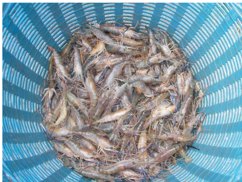
ภาพที่ 20 กุ้งเพศเมียที่ได้จากการเลี้ยงแบบผสม