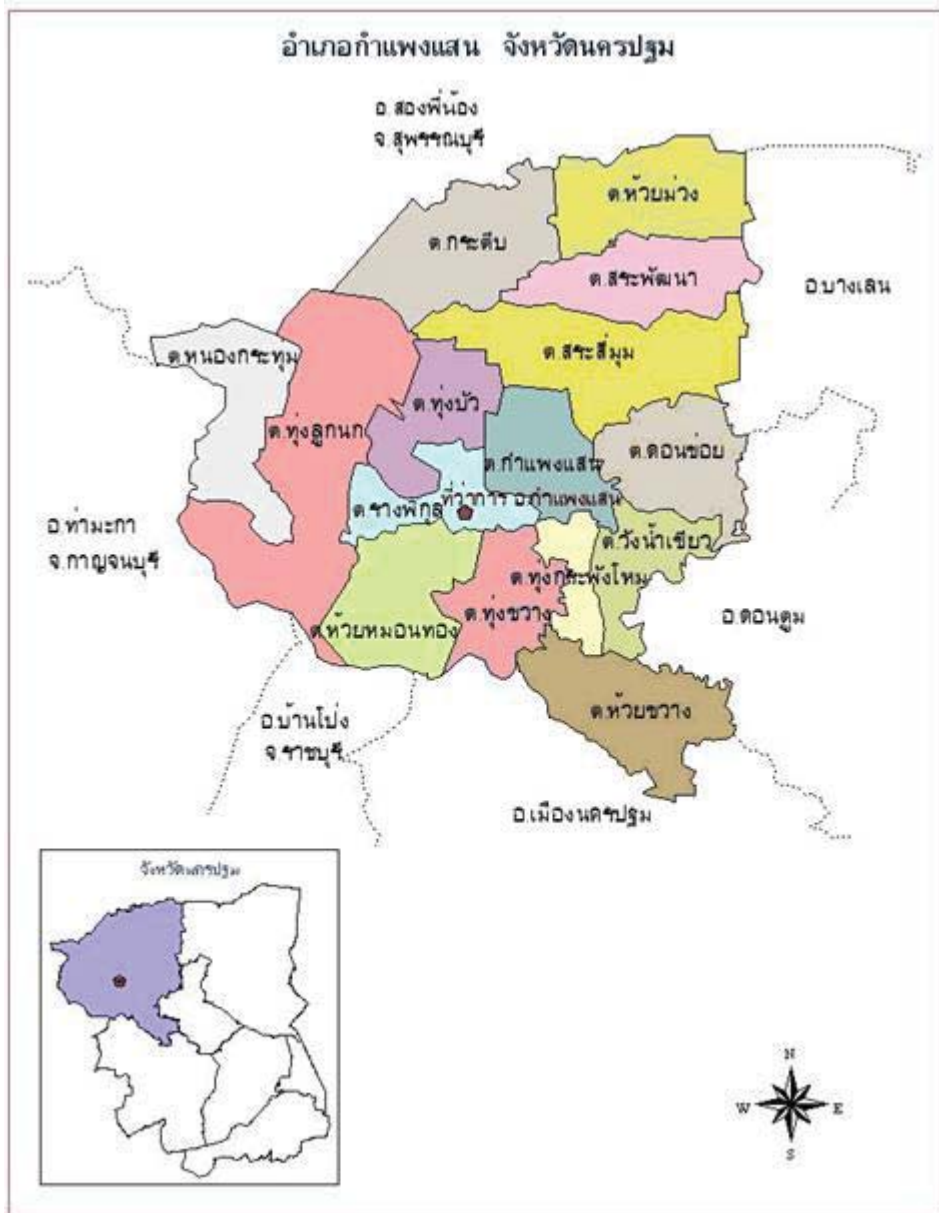
ภาพที่ 1 แผนที่อำเภอกำแพงแสน จังหวัดนครปฐม