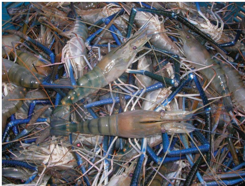
ภาพที่ 19 กุ้งเพศผู้ที่ได้จากการเลี้ยงแบบผสม