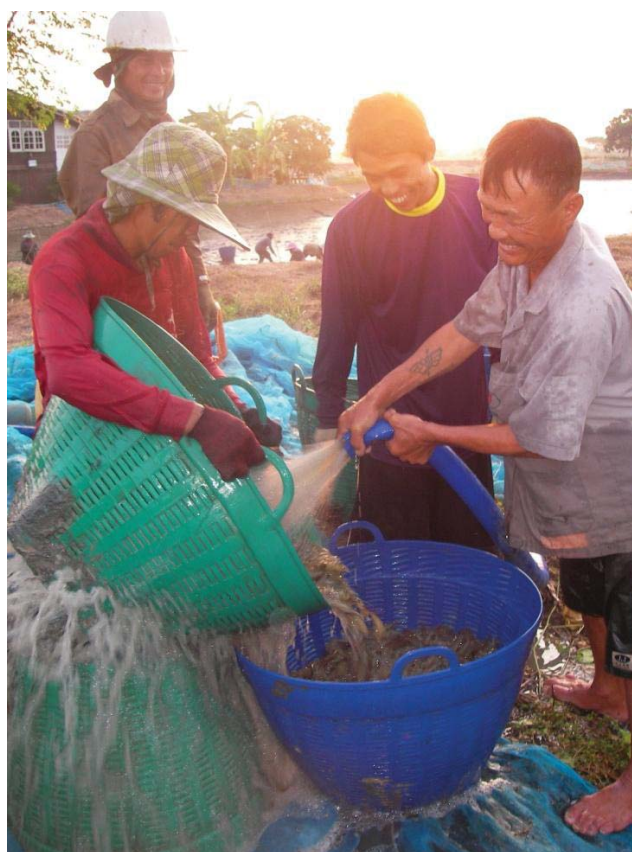
ภาพที่ 16 การล้างทำความสะอาดกุ้งก่อนเทลงถังที่ติดเครื่องให้ออกซิเจน

การจับกุ้งเกษตรกรจะใช้วิธีการเช่นเดียวกับการเลี้ยงแบบพัฒนา คือ เมื่อครบกำหนดจับ 3 เดือน ก็ล้างบ่อเลย โดยไม่ต้องมีการลาก จ้างคนงานมาจับ และจะแยกขายระหว่างกุ้งก้ามกราม และกุ้งขาว โดยกุ้งก้ามกรามจะขายแบบเป็น รูปแบบการซื้อขายกุ้งก้ามกรามยังคงเป็นแบบเดียวกับการขายในแบบพัฒนา คือมีทั้ง การขายปากบ่อและไปขายเองที่ตลาดซื้อขายกุ้ง วิธีการส่งกุ้งไปขาย คือการนำกุ้งใส่ถังที่มีน้ำและใช้เครื่องตีเพื่อเพิ่มออกซิเจนให้กุ้ง ส่วนกุ้งขาวจะขายแบบตาย ต้องแช่น้ำแข็งแล้วส่งไปขายที่แพ ทั้งนี้เนื่องจากกุ้งขาวจะสีซิดเร็ว มันบนหัวแตกง่าย หากนำขึ้นจากบ่อควรต้องแช่น้ำแข็งทันทีเพื่อช่วยทำให้กุ้งขาวยังคงสด หากกุ้งซิดหรือไม่สดราคาก็จะถูกลง