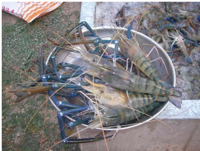
ภาพที่ 7 กุ้งเพศผู้ครบกำหนดจับขาย

การนำมาเลี้ยงต่อ ปัจจุบันแหล่งที่เกษตรกรไปซื้อกุ้งมาเลี้ยงก็คือ หนองอำเภอกำแพงแสน อำเภอบางเลน และจังหวัดสุพรรณบุรี