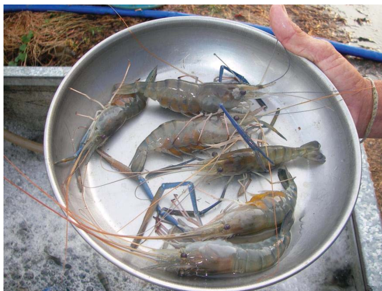
ภาพที่ 8 กุ้งเพศเมียครบกำหนดจับขาย

ระยะเวลาในการเลี้ยงของรูปแบบการเลี้ยงกุ้งก้ามกรามแบบพัฒนานั้น เกษตรกรจะใช้เวลาเลี้ยงประมาณ 3 เดือน กุ้งก็จะโตเต็มที่ที่สามารถจับขายได้ เป็นการลดระยะเวลาในการอนุบาลกุ้งโดยซื้อกุ้งก้ามกรามตัวโตที่มีผู้อนุบาลไว้แล้วมาเลี้ยงเลย