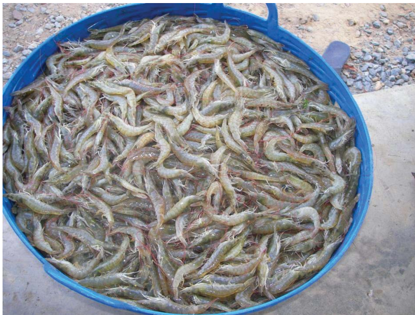
ภาพที่ 21 กุ้งขาวที่ได้จากการเลี้ยงแบบผสม