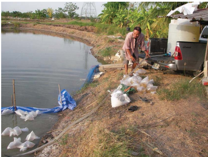
ภาพที่ 12 การลงน้ำเค็มในบริเวณที่ล้อมผ้าใบเพื่อลงกุ้งขาว