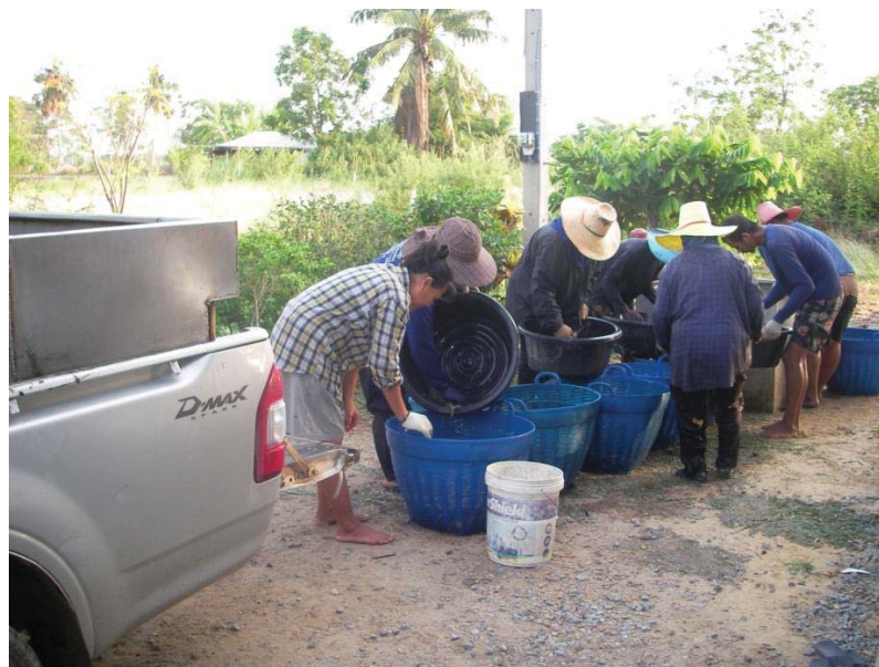
ภาพที่ 17 การคัดแยกเพศกุ้งเพื่อจำหน่ายปากบ่อ