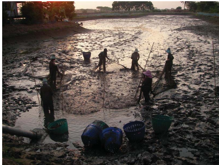
ภาพที่ 10 การล้างบ่อจับกุ้ง 2