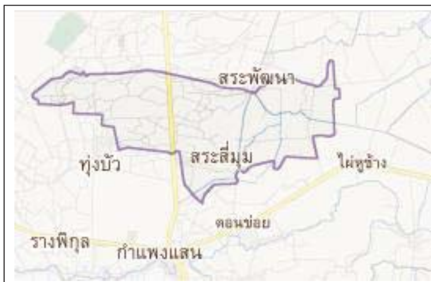
ภาพที่ 2 แผนที่ตำบลสระสีมูม อำเภอกำแพงแสน จังหวัดนครปฐม