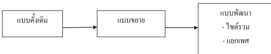
ภาพที่ 23 แผนภาพแสดงรูปแบบการเลี้ยงกึ่งก้ามกรามในช่วงยุคอาชีพ

เป็นการซื้อกึ่งที่มีผู้อนุบาลไว้แล้วประมาณ 2-3 เดือน มาลงในบ่อที่ได้เตรียมไว้ ซึ่งมีอยู่ด้วยกัน 2 แบบ คือ การเลี้ยงพัฒนาแบบไฮดรอม คือการซื้อคละเพศมาลง และการเลี้ยงกึ่งก้ามทอง คือการเลือกเฉพาะกึ่งก้ามทองมาเลี้ยงเพียงอย่างเดียว โดยจะใช้เวลาเลี้ยงประมาณ 3 เดือน แล้วจึงล้างบ่อจับขายทั้งหมด การจำหน่ายก็เปลี่ยนเป็นการขายกึ่งเป็น และมีพ่อค้ามารับซื้อถึงปากบ่อ ในราคาที่ไม่แตกต่างจากแพมากนัก สะดวกต่อเกษตรกรที่ไม่สามารถเดินทางไปจำหน่ายได้