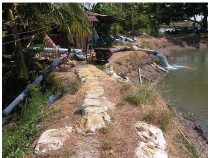
ภาพที่ 5 การสูบน้ำเข้าบ่อโดยไม่มีบ่อพัก

ผู้วิจัยพบว่า เกษตรกรผู้เลี้ยงกุ้งก้ามกรามนั้น ไม่มีบ่อพักน้ำสำหรับบำบัดน้ำก่อนสูบเข้าบ่อและก่อนปล่อยออกสู่อ่างน้ำ ล้าคลอง ซึ่งอาจส่งผลเสียกับเกษตรกรรายอื่นได้ หากเกิดโรคระบาดจากบ่อที่สูบน้ำออกแล้วมีผู้สูบน้ำนั้นเข้าบ่อไป และการเลี้ยงกุ้งที่ใช้ระยะเวลาขนส่งผลเสียต่อบ่อได้ เนื่องจากเศษอาหารและสิ่งปฏิกูลที่ทับถม หมักหมมอยู่บริเวณพื้นบ่อนั้น ก็เป็นแหล่งเชื้อโรคที่สำคัญ ที่อาจส่งผลให้กุ้งไม่โตหรือเป็นโรคได้นอกจากนี้กระบวนการตรวจสอบสภาพพื้นบ่อของเกษตรกรก็ไม่มีมาตรฐาน ทั้งนี้เพราะเกษตรกรใช้วิธีการสังเกตอย่างเดี๋ยว่าพื้นมีเลนมากน้อยขนาดไหน นอกเหนือจากนี้เกษตรกรยังต้องระมัดระวังปลาที่อาจจะมากับน้ำที่สูบน้ำเข้าบ่อด้วย เพราะว่าปลาจะเป็นตัวที่ทำให้เกษตรกรไม่สามารถคาดเดาได้ว่าในบ่อมีกุ้งมากน้อยขนาดไหน เพราะปลาจะแย่งอาหารกุ้งกิน เมื่อเกษตรกรลงเช็ดในบ่ออาจพบว่าอาหารหมด อาจเพิ่มอาหารให้กุ้งมากยิ่งขึ้น ซึ่งแท้ที่จริงแล้วปลากินหมด ส่งผลให้เกษตรกรต้องแบกรับภาระต้นทุนค่าอาหารที่เพิ่มขึ้น