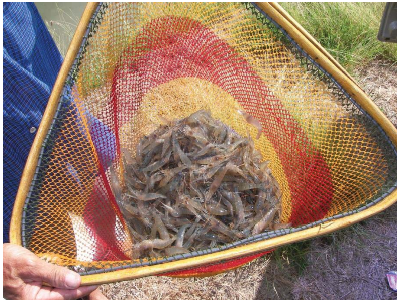
ภาพที่ 15 ขนาดกุ้งก้ามกรามระยะ 2-3 เดือน ที่นำมาปล่อย

การเลี้ยงแบบผสม เกษตรกรเลือกใช้อาหารสำเร็จรูป เนื่องจากสะดวก มีคุณภาพ และประหยัดเวลาในการต้องมาผลิตอาหารเอง เกษตรกรจะให้อาหารกุ้ง 2 มื้อเช่นเดียวกับกับรูปแบบอื่น คือช่วงเช้าและช่วงเย็นมีการเช็คอาหารจากขอเพื่อตรวจสอบว่ากุ้งกินอาหารหมดหรือไม่ ซึ่งอาหาร