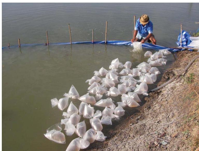
ภาพที่ 13 การปล่อยกุ้งขาววิธีการเลี้ยงแบบผสม