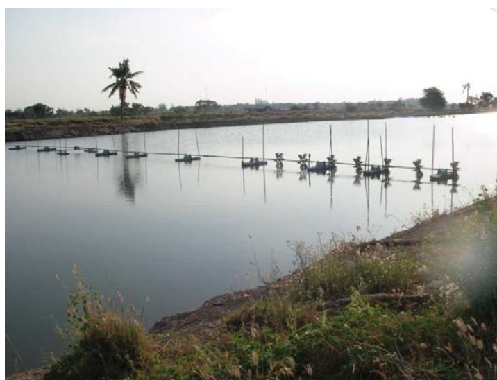
ภาพที่ 6 ใบพัดตีน้ำ

รูปแบบวิธีการเลี้ยงกุ้งก้ามกรามของเกษตรกร ตำบลสระสี่มุม อำเภอกำแพงแสน จังหวัดนครปฐม ได้ปรับเปลี่ยนมาเรื่อยๆ หลังจากการเลี้ยงในแบบขยายแล้วผลผลิตยังไม่ได้ตามที่ต้องการ ประกอบกับการแข่งขันในเรื่องของคุณภาพ ขนาด และความต้องการของตลาดที่มีมากยิ่งขึ้นส่งผลให้เกษตรกรต้องปรับเปลี่ยนรูปแบบวิธีการต่างๆ ในการเลี้ยงให้ได้ผลผลิตที่เป็นที่ต้องการของตลาด และสร้างรายได้ให้กับตนเองมากยิ่งขึ้น จึงหันมาเลี้ยงกุ้งก้ามกราม แบบพัฒนา ซึ่งการเลี้ยงกุ้งก้ามกรามแบบพัฒนานั้น ผู้วิจัยแบ่งออกเป็น 2 แบบ ด้วยกัน คือ การเลี้ยงแบบคละเพศและการเลี้ยงเพศผู้อย่างเดียว โดยเลือกเฉพาะกุ้งก้ามทอง มาเลี้ยง ซึ่งรูปแบบและวิธีการเลี้ยงมีลักษณะเหมือนกันคือ เกษตรกรยังใช้วิธีการเตรียมบ่อในแบบเดียวกับการเลี้ยงกุ้งแบบดั้งเดิมและแบบขยาย คือ มีการปรับพื้นบ่อ หว่านปูน และสูบน้ำเข้าบ่อ เกษตรกรบางรายเริ่มมีการนำใบพัดเครื่องตีน้ำมาช่วยในการเพิ่มออกซิเจนในน้ำเพราะนอกจากเกษตรกรจะใช้วิธีการถ่ายเทน้ำโดยการสูบน้ำเข้าสูบน้ำออกเพื่อลดปัญหาเรื่องน้ำเสียก็นำวิธีเพิ่มออกซิเจนในน้ำเข้ามาช่วย