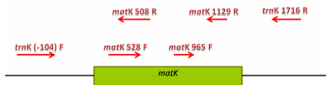
ภาพที่ 2 โครงสร้างยีน matK และตำแหน่งไพรเมอร์