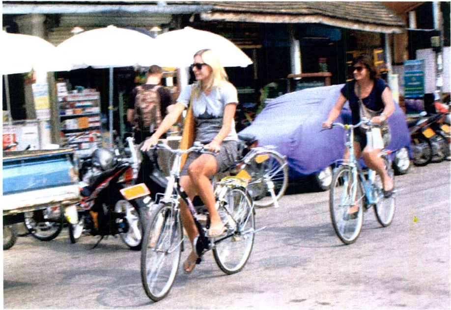
ภาพ 23 การท่องเที่ยวโดยจักรยานในเมืองหลวงพระบางเหมือนที่ชุมชนเมืองเก่าสุโขทัย