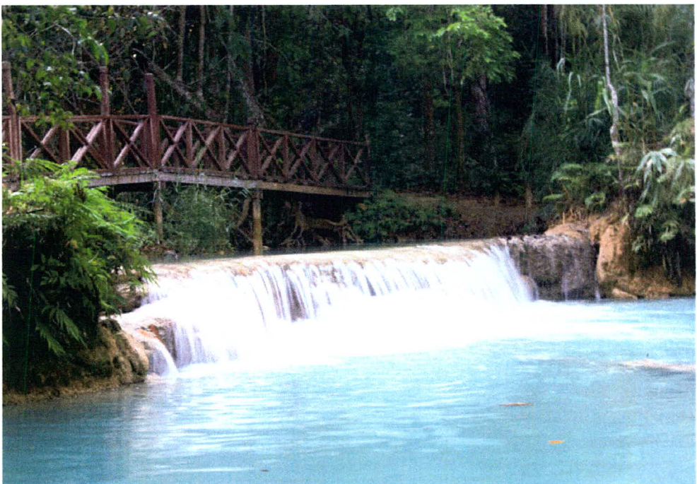
ภาพ 11 น้ำตกตาดกวางสี