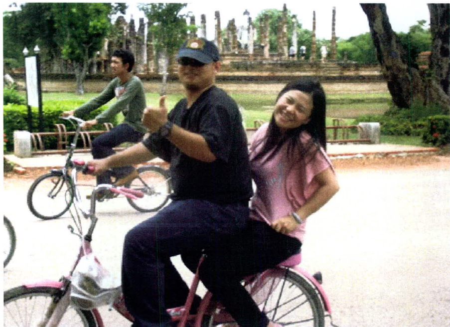
ภาพ 24 การท่องเที่ยวโดยจักรยานในเมืองเก่าสุโขทัย