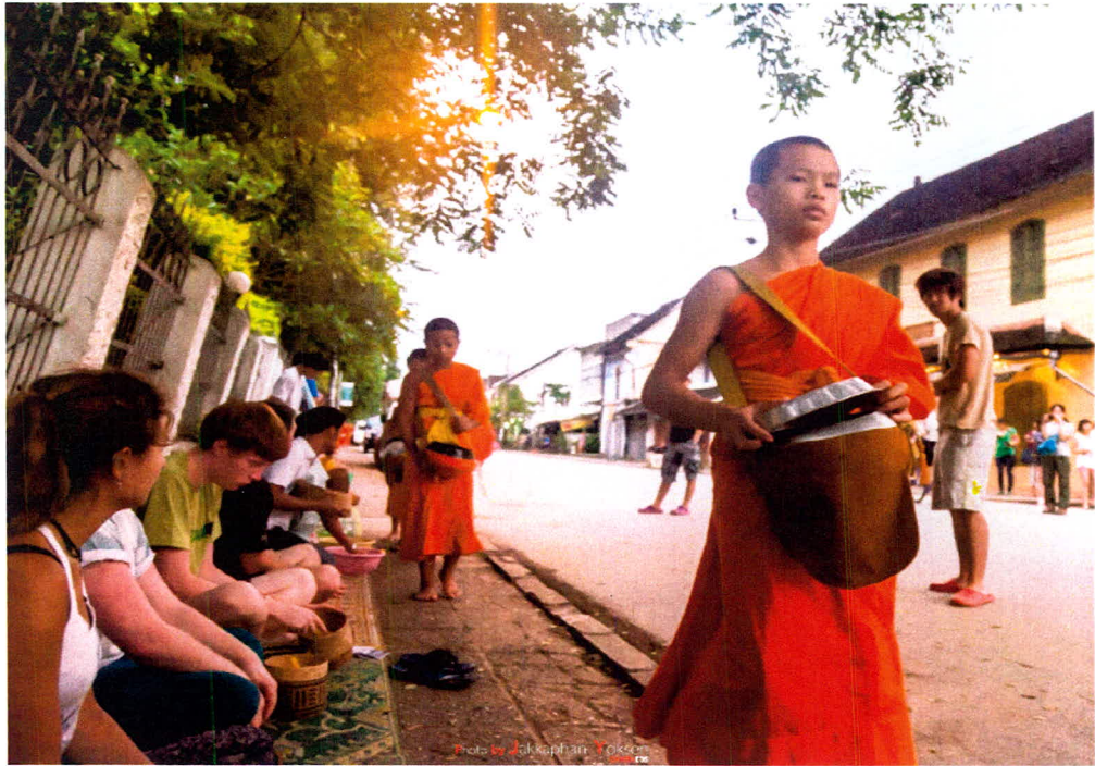
ภาพ 21 ตักบาตรข้าวเหนียว