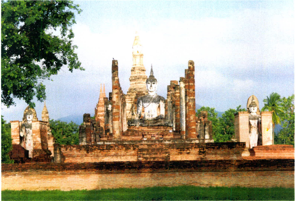
ภาพ 15 สุโขทัยเมืองเก่ามรดกโลก