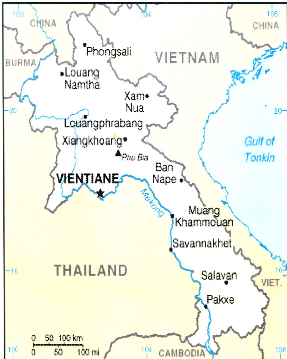
ภาพ 2 แผนที่ประเทศ สปป.ลาว

ศาสนา ประชาชนลาวมากกว่าร้อยละ 90 ส่วนใหญ่นับถือศาสนาพุทธนิกายเถรวาท เหมือนกับประชาชนชาวไทยและถือปฏิบัติตามหลักธรรมคำสั่งสอนอย่างเคร่งครัด อีก 10 เปอร์เซ็นต์ ที่เหลือนับถือศาสนาคริสต์และอิสลาม โดยเฉพาะศาสนาคริสต์ ฝรั่งเศสเจ้าอาณานิคมเป็นผู้นำเข้ามาเผยแพร่ในช่วงที่มีการปกครองประเทศลาว