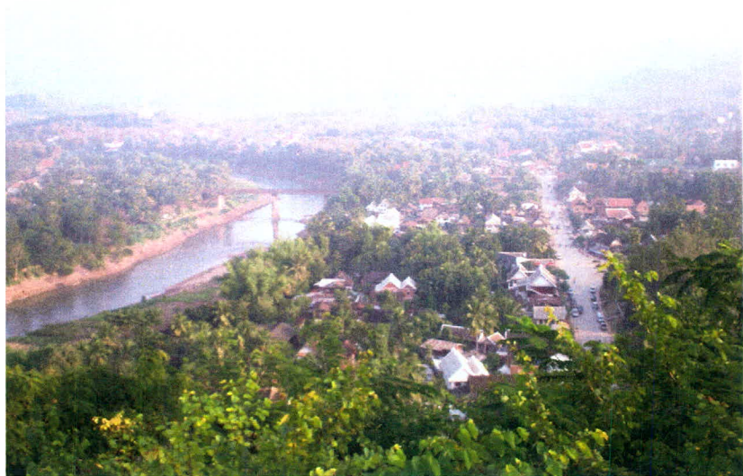
ภาพ 6 จุดชมวิวบนธาตุภูมิศรี