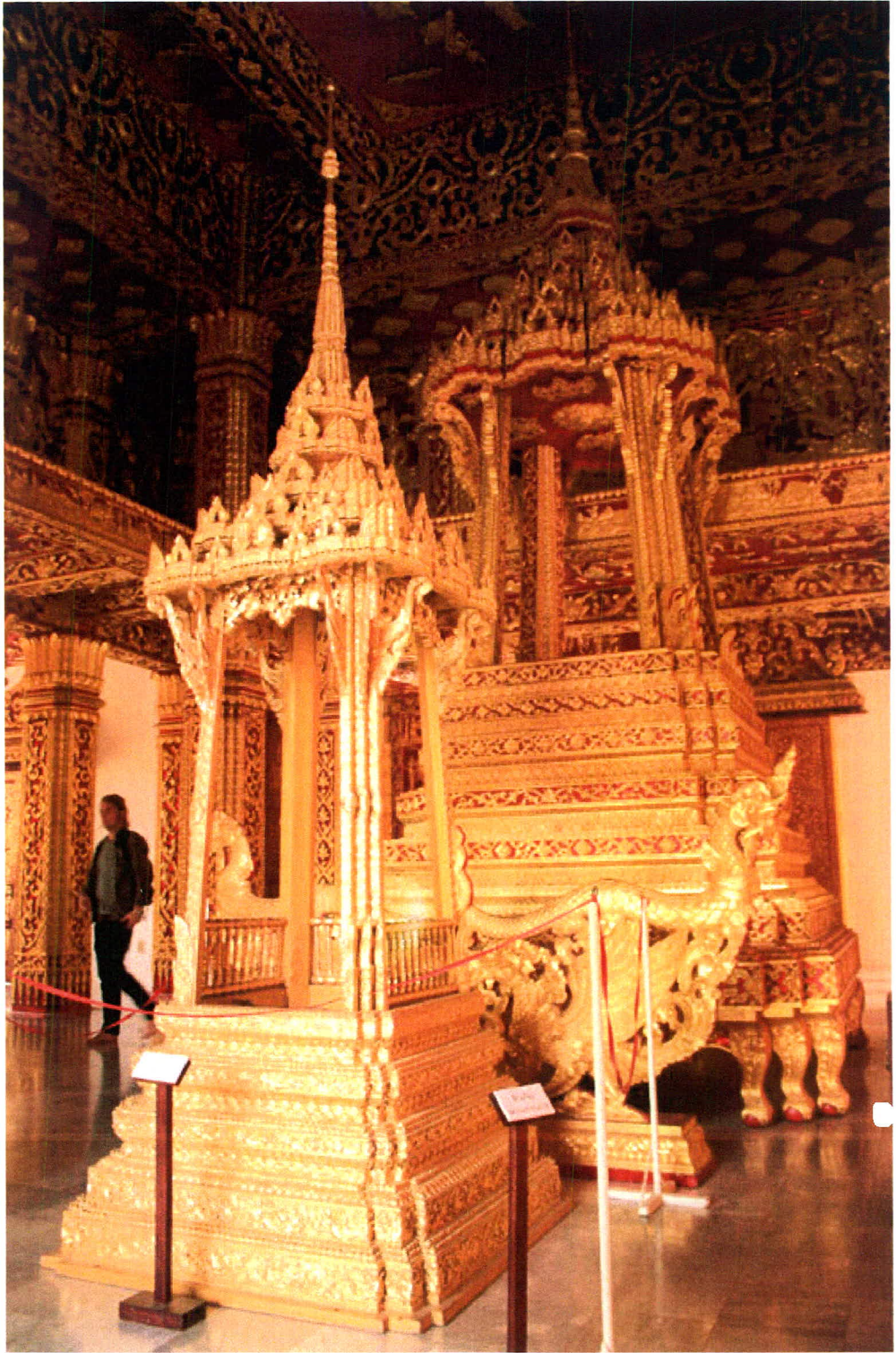
ภาพที่ 9 ศิลปะอาณาจักรลานช้าง