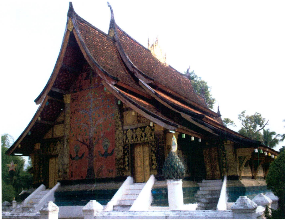
ภาพ 3 วัดเชียงทอง แหล่งท่องเที่ยวทางวัฒนธรรมที่สำคัญ