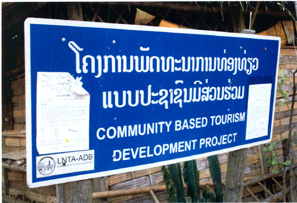
ภาพ 12 แนวคิดการนำชุมชนที่อยู่ใกล้เคียงน้ำตกตาดกวางสีมีส่วนร่วมด้านการท่องเที่ยว