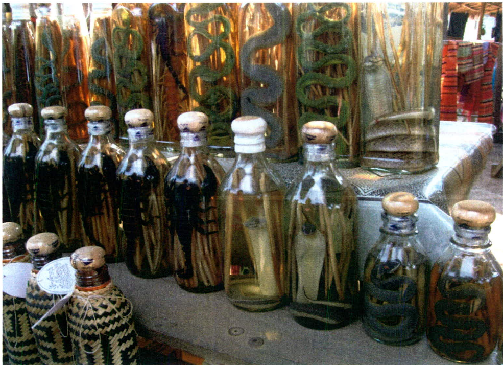
ภาพ 13 บ้านช่างไห ผลิตเหล้า