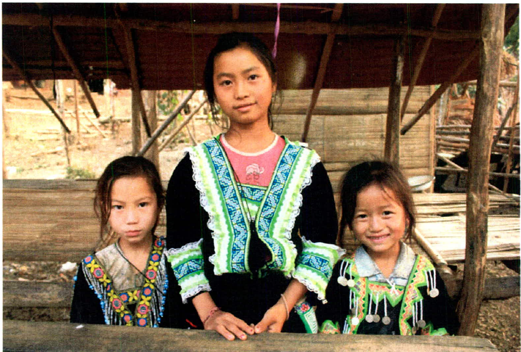
ภาพ 22 วิถีชีวิตกลุ่มชาติพันธุ์ลาว