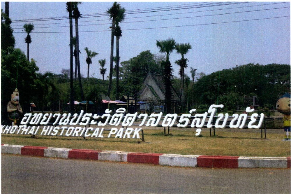
ภาพ 16 หน้าอุทยานประวัติศาสตร์สุโขทัยเมืองเก่า