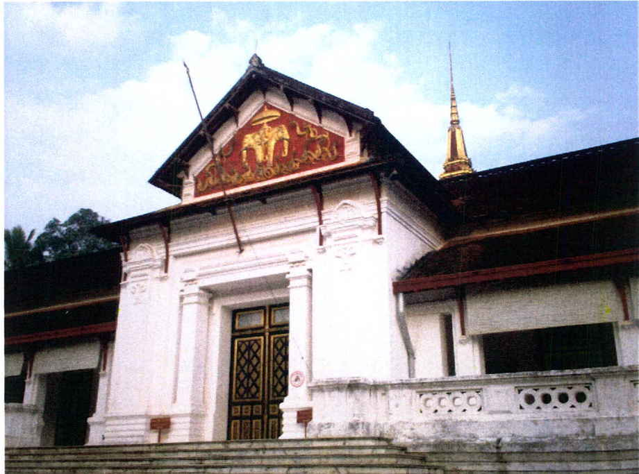
ภาพ 7 วังเจ้ามหาชีวิตลาว หรือพิพิธภัณฑ์แห่งชาติลาว