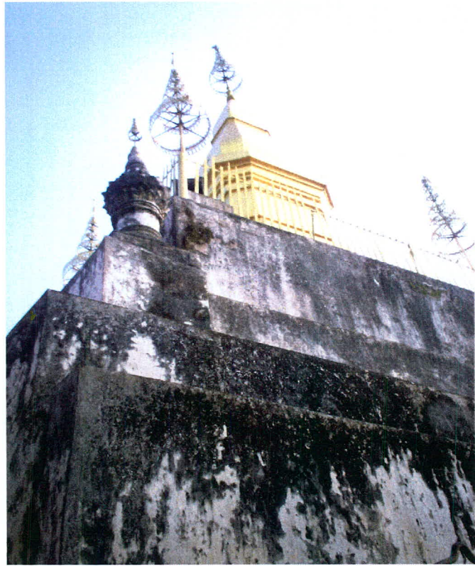
ภาพ 5 ธาตุภูมิศรี