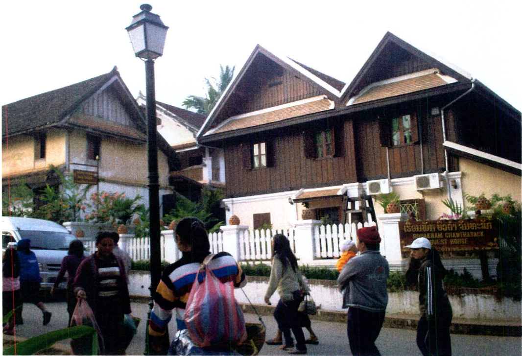
ภาพ 17 เอือนพัก (บ้านพัก) ที่ถูกออกแบบภายใต้เงื่อนไขมรดกโลก