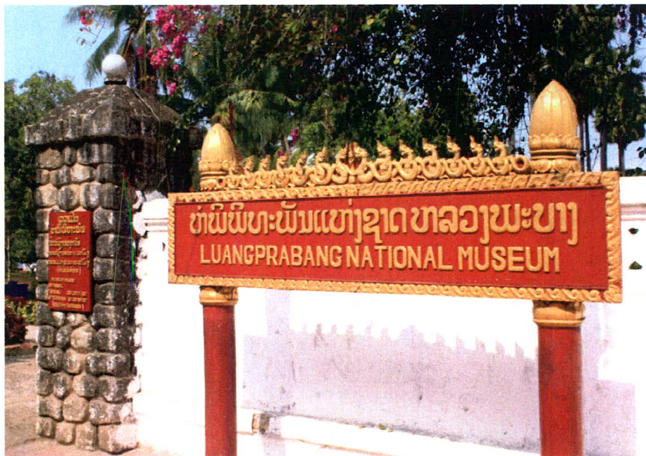
ภาพ 8 วังเจ้ามหาชีวิตลาว หรือพิพิธภัณฑ์แห่งชาติลาว