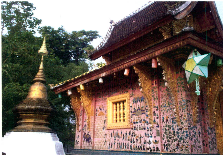
ภาพ 4 ศิลปะการแกะสลักกระจกของวัดเชียงทอง