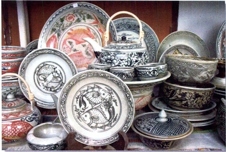
ภาพ 20 สังคโลก สินค้าในชุมชนเมืองเก่า