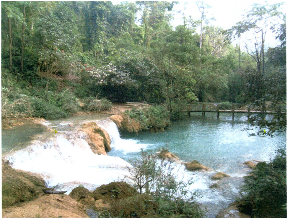
ภาพ 10 น้ำตกตาดกวางสี