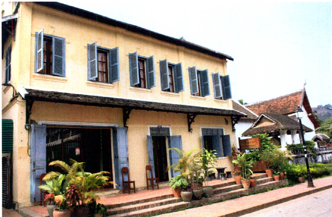
ภาพ 18 เอือนพัก (โรงแรม) ในเมืองหลวงพระบาง