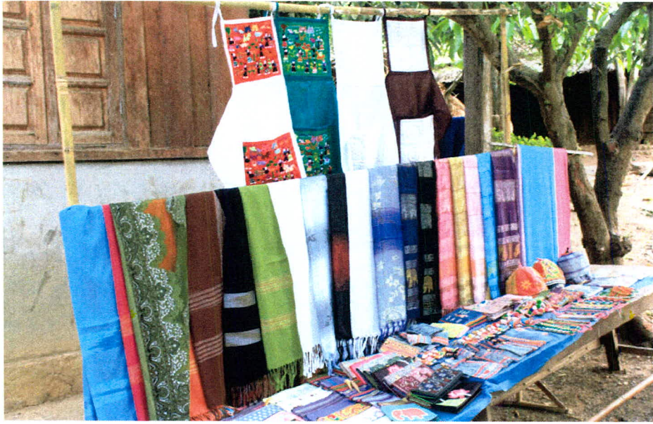
ภาพ 19 สินค้าในชุมชนหลวงพระบาง