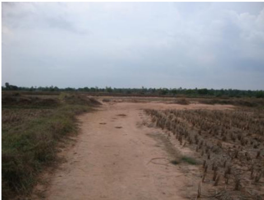
รูปที่ 5 บริเวณขอบแปลงนาที่มักพบการกระจายของดินเค็มเป็นหย่อมๆ