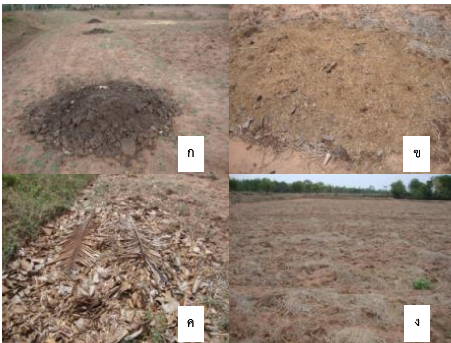
รูปที่ 6 วัสดุบำรุงดินที่เกษตรกรบ้านหนองคูใส่ในนาเพื่อเตรียมไถกลบ (ก) ปุ๋ยคอก (ข) แกลบ (ค) ใบไม้แห้ง (ง) ฟางข้าวในที่นาที่มีการไถกลบ