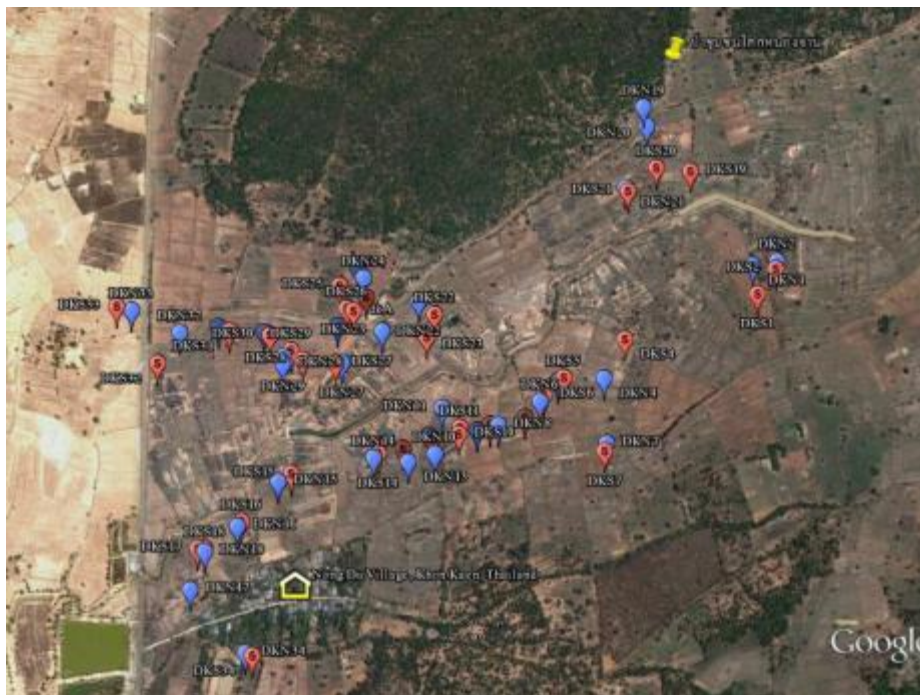
รูปที่ 4 จุดเก็บตัวอย่างดินบ้านหนองคู: หมุดสีแดง = จุดเก็บตัวอย่างดินจากแปลงที่เกษตรกรบอกว่ามีดินเค็ม และหมุดสีฟ้า = จุดเก็บตัวอย่างที่ไม่มีดินเค็ม (Google Earth, 2013)

ซึ่งที่นาในภาคตะวันออกเฉียงเหนือมักพบโปงและมัตินไม้หลายชนิดหลงเหลืออยู่ บริเวณที่มีคราบเกลือส่วนใหญ่เป็นพื้นที่ว่างเปล่าไม่พบพืชใดๆ ขึ้นได้เลย (รูปที่ 5) หรือพบเฉพาะพืชที่ชอบเค็มหรือพืชทนเค็มขึ้นเป็นกลุ่ม ได้แก่ หนามพุงดอ ( Azima sarmentosa ) หนามแดง ( Maytenus diversifolia ) ชลู่ ( Pluchea indica ) ธนไชย ( Buchanania siamensis ) สะแกนา ( Combretum quadrangulare ) สะเดา ( Azadirachta indica ) และกระถินณรงค์ ( Acacia auriculiformis ) นอกจากนี้ยังพบต้นไม้ดั้งเดิมที่หลงเหลืออยู่ในที่นาและกล้าไม้ที่เกษตรกรนำมาปลูกตามคันนาหรือบริเวณใกล้เถียงนา ได้แก่ เหยิง ยางนา หนามแท่ง ประดู่ มะกอก มะพร้าว สะเดา กระเจี๊ยบมอญ มะรุม มะเขือเทศ เป็นต้น