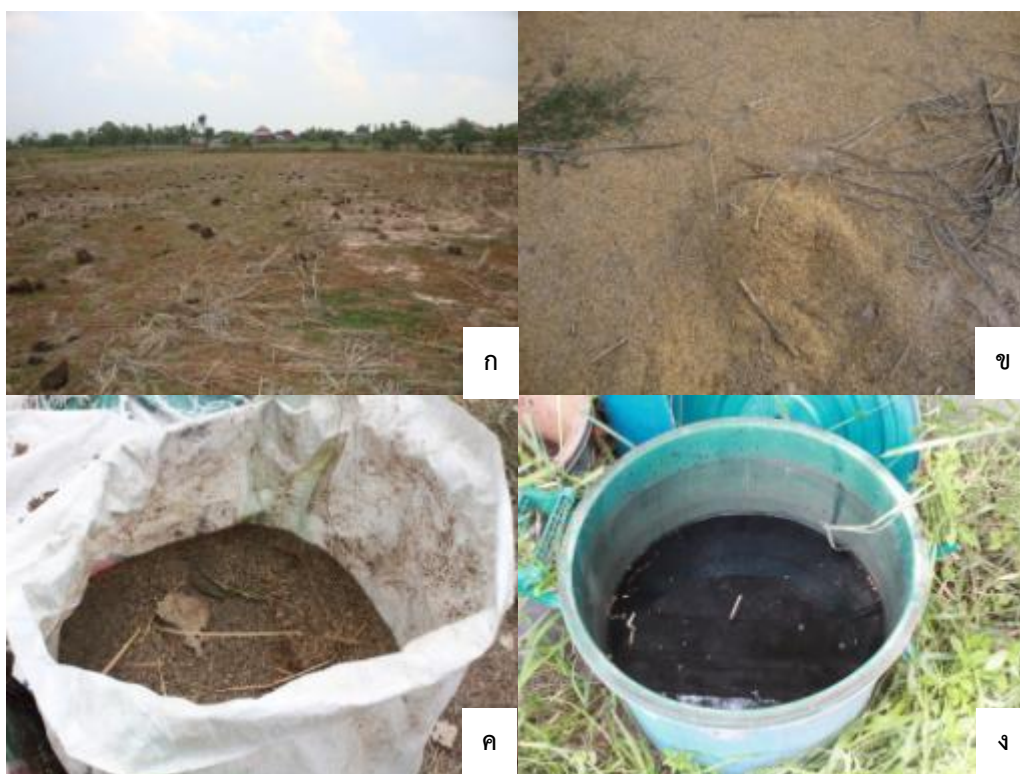
รูปที่ 8 วัสดุบำรุงดินที่เกษตรกรตำบลหนองสิมนำมาใส่ในนา (ก) ปุ๋ยคอก (ข) แกลบ (ค) ปุ๋ยซีแมลงสะตั้ง (ง) น้ำหมักชีวภาพ

เพียงพอ (รูปที่ 8) เกษตรกรส่วนใหญ่ (ร้อยละ 64) เริ่มไถตะในเดือนพฤษภาคม และส่วนใหญ่ (ร้อยละ 73) จ้างรถไถแบบนั่งขับ ใช้เวลาเฉลี่ยเพียง 2.45 วัน แต่ที่เกษตรกรบางรายยังคงมีการไถตะโดยใช้แรงงานในครัวเรือน เนื่องจากช่วยประหยัดค่าใช้จ่าย เพราะมีต้นทุนน้อยกว่าคนที่จ้างไถ -170.15 บาท/ไร่ จากการวิเคราะห์ต้นทุนของขั้นตอนการเตรียมพื้นที่และการไถเตรียมดิน คิดเป็นมูลค่าเฉลี่ย 166.70 บาท/ไร่ หรือร้อยละ 8 ของมูลค่าต้นทุนในการทำนาทั้งหมด