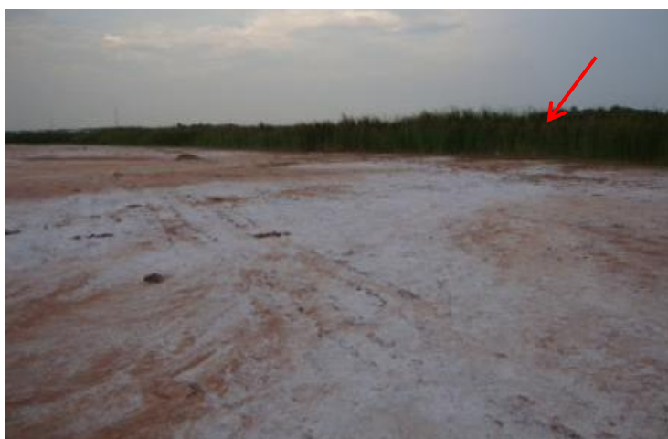
รูปที่ 7 การแพร่กระจายของดินเค็มบริเวณหนองบ่อ และแนวของต้นธูปฤาษี (ลูกศรชี้)

จากการสำรวจพื้นที่และเก็บตัวอย่างดินจากแปลงนาของเกษตรกร 43 ครัวเรือน ในทั้ง 5 หมู่บ้าน พบว่าพื้นที่ทั่วไปมีลักษณะเป็นที่ราบลูกคลื่นลอนลาด ความสูงเฉลี่ย 175.36 เมตรจากระดับน้ำทะเลปานกลาง มีหนองน้ำธรรมชาติในพื้นที่ คือ หนองบ่อ (48Q 299349mE UTM 1772923mN) และอ่างเก็บน้ำเอกกษัตริย์สุนทร (48Q 295774mE UTM 1770727mN) ซึ่งเป็นแหล่งน้ำชลประทานของชุมชน พื้นที่รอบๆ หนองบ่อพบการแพร่กระจายของดินเค็มที่ปรากฏเป็นคราบเกลือสีขาวครอบคลุมพื้นที่เป็นบริเวณกว้าง ไม่พบพืชชนิดใดเจริญเติบโตได้เลยนอกจากกระถินณรงค์ โดยชาวบ้านบอกว่าเป็นความพยายามของกรมพัฒนาที่ดินที่นำมาปลูกเพื่อฟื้นฟูปัญหาดินเค็ม และพบต้นธูปฤาษีขึ้นอย่างหนาแน่นบริเวณขอบหนอง (รูปที่ 7)