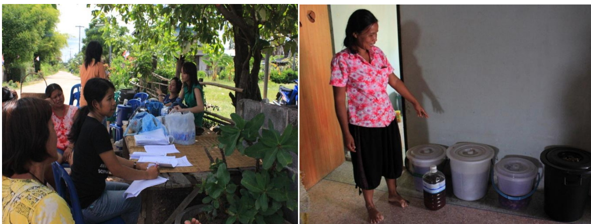
รูปที่ 3 การสัมภาษณ์ข้อมูลอาศัยแบบสอบถาม (ซ้าย) และการสำรวจครัวเรือน--การทำปุ๋ยชีวภาพ (ขวา)

นอกจากนี้ยังได้สำรวจสภาพครัวเรือนเกษตรกรเพื่อดูกิจกรรมต่างๆ เกี่ยวกับการเพาะปลูกและดูแลที่นา เช่น การทำปุ๋ยชีวภาพ ปุ๋ยหมัก เศษวัสดุเหลือใช้จากการเกษตรและกิจกรรมในครัวเรือน รวมทั้งบรรจุภัณฑ์ที่เกษตรกรใช้เก็บผลผลิตข้าว และได้ตรวจวัดน้ำหนักถุงหรือถังใส่ข้าวเปลือกเพื่อใช้ปรับค่าปริมาณน้ำหนักผลผลิตข้าวให้เป็นมาตรฐานเดียวกันมากที่สุด รูปที่ 3 แสดงการสัมภาษณ์ข้อมูลกับเกษตรกรในชุมชนบ้านหนองคู ซึ่งตัวแทนครัวเรือนเกษตรกรมารวมกันบริเวณศาลากลางหมู่บ้านเพื่อให้ข้อมูล