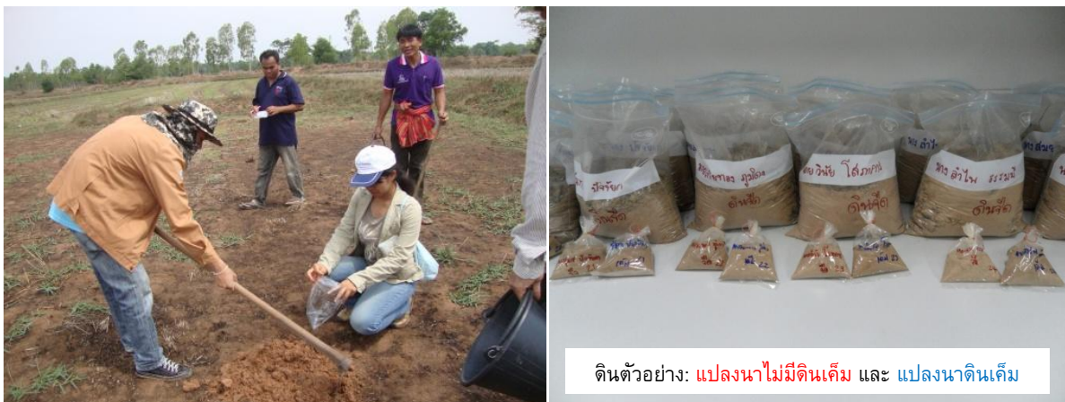
รูปที่ 2 การเก็บดินตัวอย่าง (ซ้าย) และตัวอย่างดินที่เตรียมสำหรับการวิเคราะห์คุณลักษณะ (ขวา)

การสำรวจพื้นที่และเก็บตัวอย่างดินดำเนินการในช่วงฤดูแล้ง (ระหว่างเดือนกุมภาพันธ์ถึงเมษายน) ด้วยความร่วมมือจากผู้นำชุมชนและเกษตรกรเจ้าของพื้นที่ โดยผู้นำชุมชนได้จัดทำรายชื่อครัวเรือนที่ประสบปัญหาดินเค็ม แจ้งประชาสัมพันธ์ให้เกษตรกรทราบถึงการดำเนินงานของโครงการ และเลือกตัวแทนครัวเรือนที่ประสงค์จะร่วมงานวิจัย ในการสำรวจและเก็บตัวอย่างดินนักวิจัยได้ออกสำรวจร่วมกับผู้นำชุมชนหรือเกษตรกรเจ้าของที่นา ด้วยวิธีการเก็บดินตัวอย่างแบบรวม (Composite soil sampling) ทั้งในแปลงนาที่มีดินเค็มและไม่พบการแพร่กระจายของดินเค็ม บันทึกพิกัด UTM ของแปลงนาที่เก็บดินตัวอย่างและระดับความสูงจากน้ำทะเลปานกลาง รวมทั้งส่งคัมพิชในบริเวณใกล้เคียง ดินตัวอย่างที่เก็บมาถูกนำมาผึ่งลมจนแห้งสนิท แล้วร่อนผ่านตะแกรงขนาด 2 มิลลิเมตร เก็บดินตัวอย่างที่ร่อนในถุงพลาสติกเพื่อการวิเคราะห์คุณลักษณะดินในห้องปฏิบัติการต่อไป (รูปที่ 2)