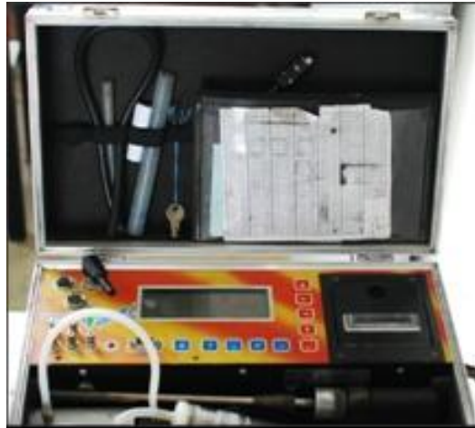
รูปที่ ก.17 อุปกรณ์วัดไอเสีย (Exhaust Analyzer)