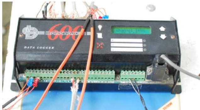
รูปที่ ก.15 Temperature Recorder (DT 600)