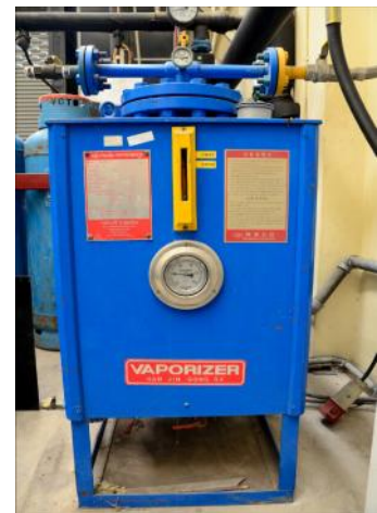
รูปที่ ก.13 ระบบจ่ายเชื้อเพลิงแก๊ส (Gas fuel supplier)