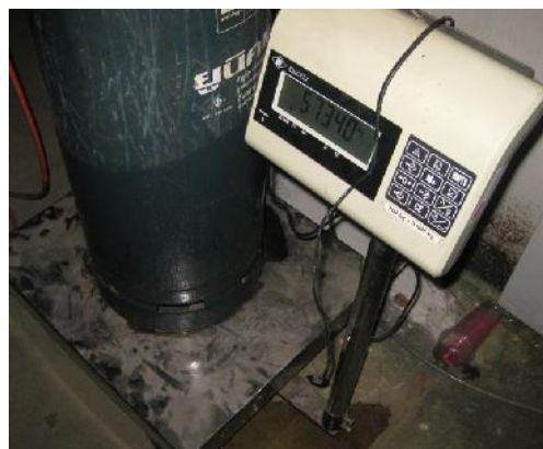
รูปที่ ก.19 เครื่องชั่งน้ำหนัก