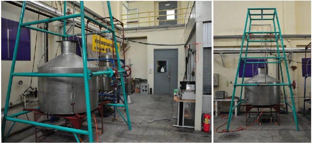
รูปที่ ก.21 หม้อต้มน้ำและ Hood สำหรับวัดไอเสีย