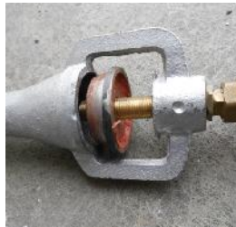
รูปที่ ก.6 อุปกรณ์ปรับอากาศ (Air adjuster)