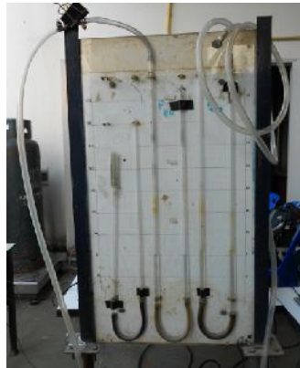
รูปที่ ก.18 มานอมิเตอร์ (Manometer)