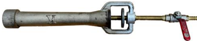
รูปที่ ก.5 ท่อผสม (Mixing tube)