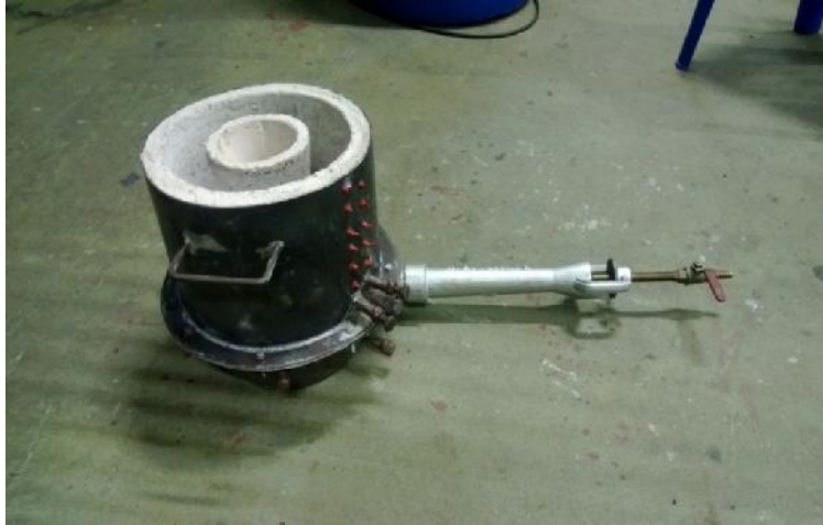
รูปที่ ก.1 เตาเผาวัสดุพูนแบบวงแหวน