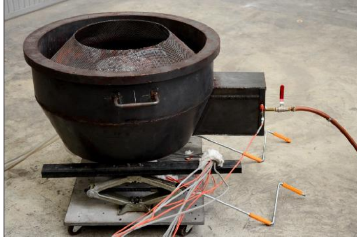
รูปที่ ก.11 อุปกรณ์อุ่นอากาศส่วนแรก (PRRB)