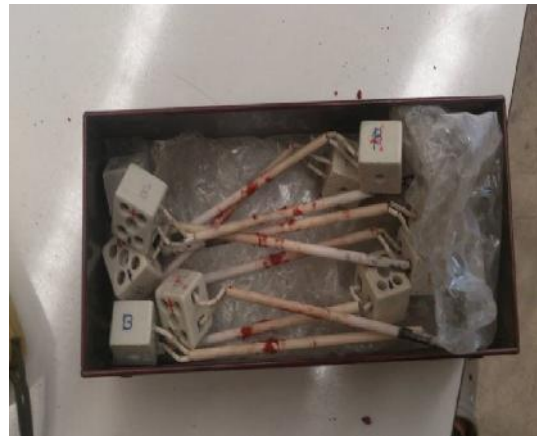
รูปที่ ก.16 Thermocouple