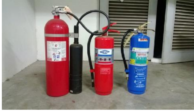
รูปที่ ก.20 อุปกรณ์เพื่อความปลอดภัยเมื่อเกิดเหตุฉุกเฉิน