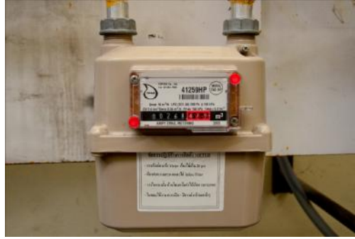
รูปที่ ก.14 Gas flow meter