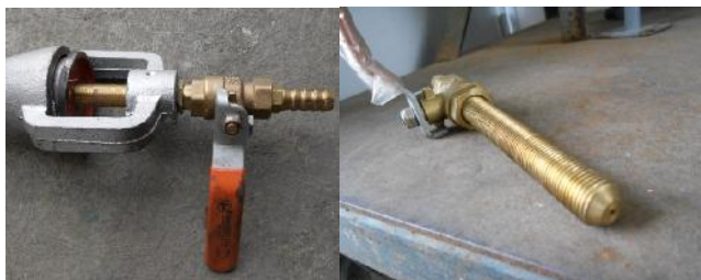
รูปที่ ก.7 หัวฉีดเชื้อเพลิง (Fuel Injector, Nozzle)