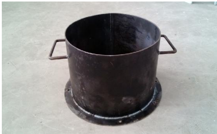
รูปที่ ก.2 ห้องเผาไหม้ (Combustion Chamber)