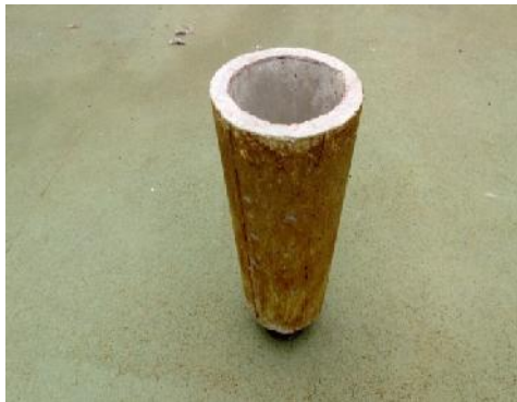
รูปที่ ก.3 แกนกลางของห้องเผาไหม้ (Annular air inlet)