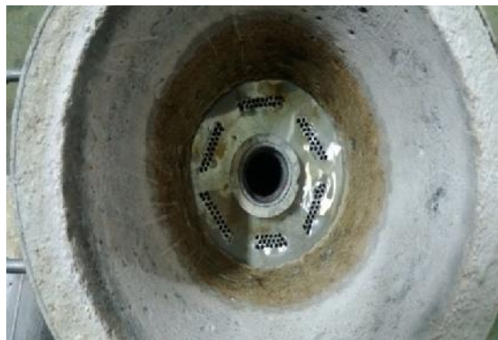
รูปที่ ก.10 แผ่นสแตนเลสทางเข้าของ Mixture