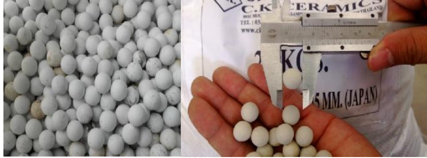
รูปที่ ก.8 วัสดุพอรูน (Porous Medium, PM)