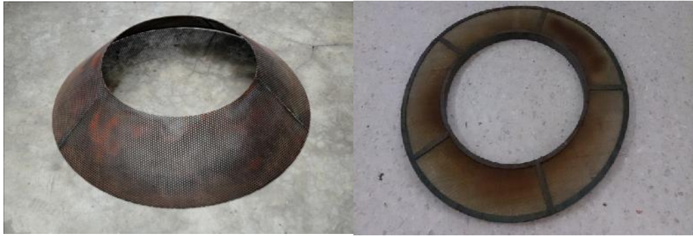
รูปที่ ก.12 Porous emitter และ Porous absorber