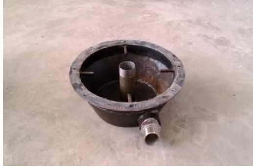
รูปที่ ก.4 ห้องผสม (Mixing Chamber)