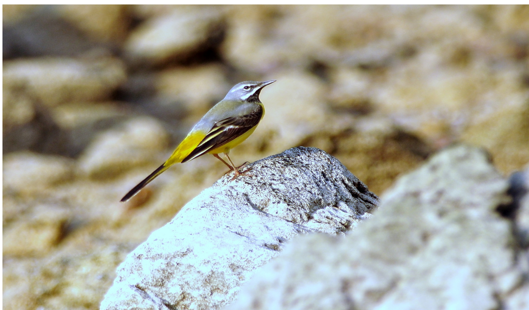
ภาพที่ 7 แสดงนกเด้าลมหลังเทา