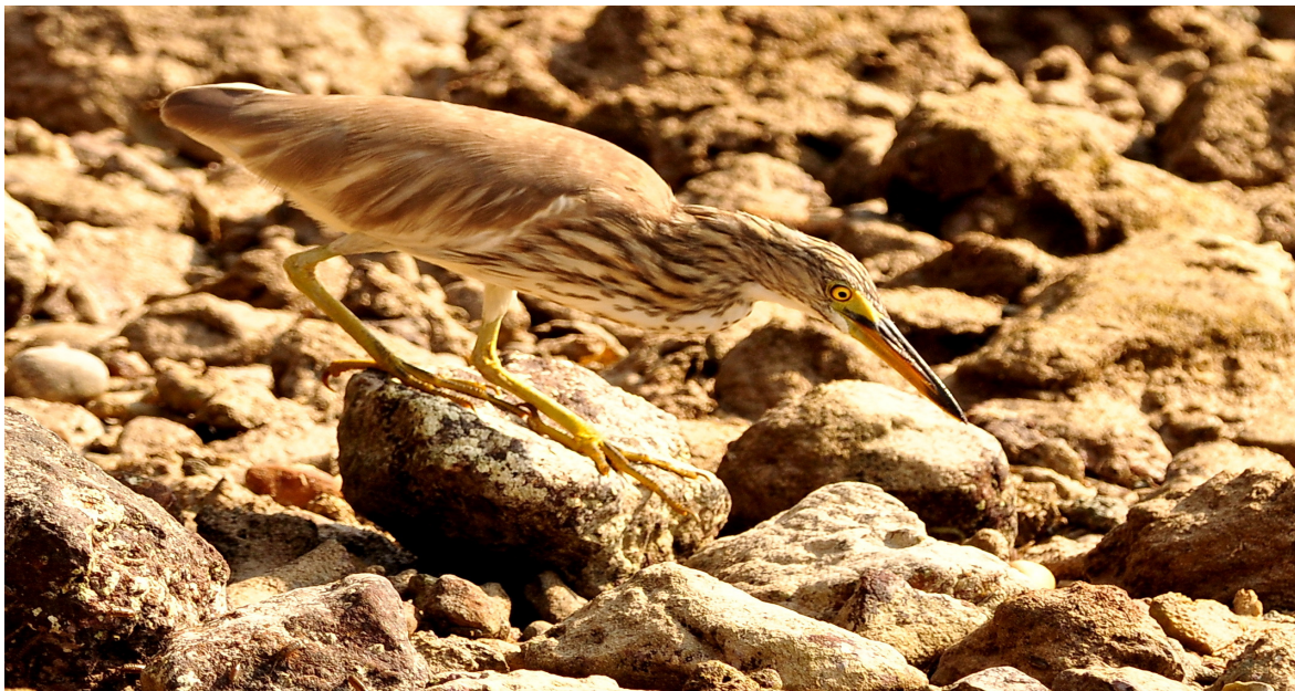
ภาพที่ 6 แสดงนกยางกรอก