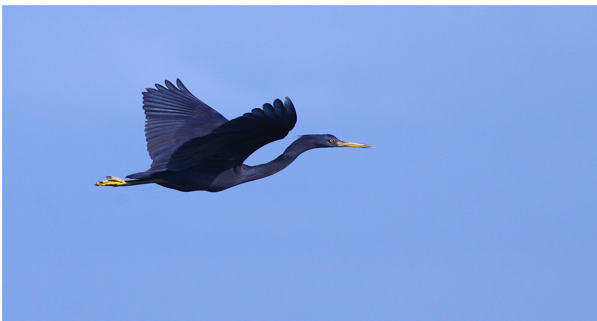
ภาพที่ 5 แสดงนกยางทะเล