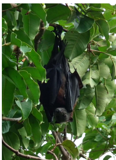
ภาพที่ 13 แสดงค้างคาวแม่ไก่เกาะ Pteropus hypomelanus พร้อมลูกเกาะอยู่ที่อก

จากการสอบถามข้อมูลจากคนในพื้นที่และจากการสำรวจเบื้องต้นพบว่า ฝูงค้างคาวแม่ไก่เกาะดังกล่าวจะอาศัยอยู่บนเกาะทะเลเป็นประจำ โดยในเวลากลางคืนค้างคาวบางส่วนจะหากินผลไม้ที่อยู่บนเกาะทะเลและบางส่วนจะบินออกไปหากินในบริเวณอื่น และยังพบว่าค้างคาวแม่ไก่เกาะหลายตัวที่พบในช่วงเวลาที่สำรวจมีลูกเกาะอยู่ที่อก แสดงว่าพื้นที่บนเกาะทะเลเป็นทั้งแหล่งที่อยู่อาศัยและขยายพันธุ์ของค้างคาวชนิดนี้