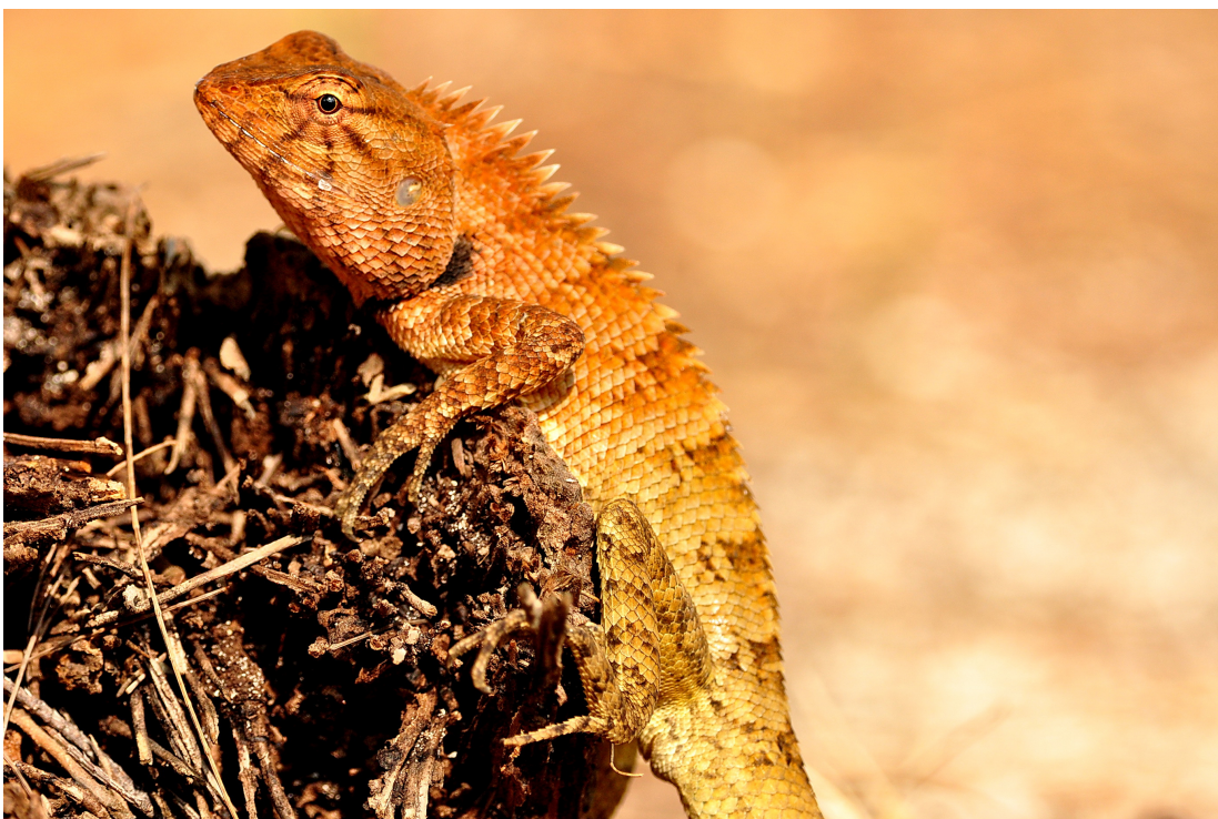
ภาพที่ 4 แสดงกิ้งก่าคอแดง