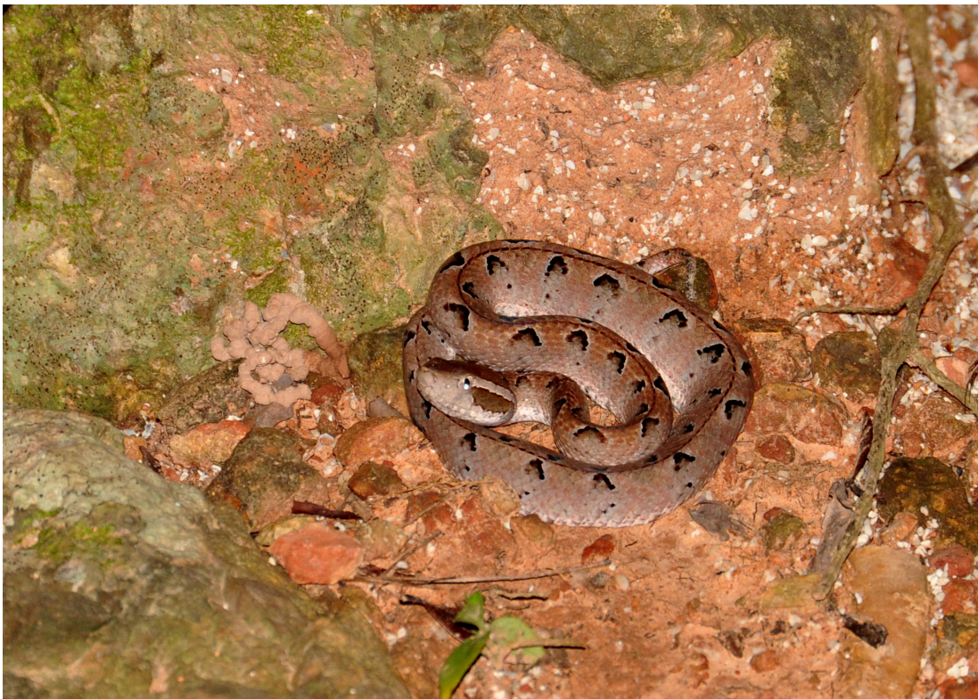
ภาพที่ 3 แสดงงูกะปะ