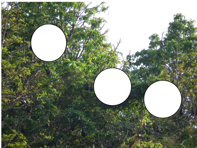
ภาพที่ 12 แสดงฝูงค้างคาวแม่ไก่เกาะ Pteropus hypomelanus ที่อาศัยอยู่บนเกาะทะเล

ค้างคาวทั้งสองชนิดที่พบจัดอยู่ในวงศ์ค้างคาวกินผลไม้ (Family Pteropodidae) โดยค้างคาวแม่ไก่เกาะจัดว่าเป็นค้างคาวที่มีขนาดใหญ่มาก มีความยาว forearm 120-145 มิลลิเมตร มีน้ำหนักมากได้กว่า 200 กรัม ส่วนค้างคาวขอบหูขาวกลางที่พบมีความยาว forearm 61.1-71.8 มิลลิเมตร น้ำหนัก 27.0-48.5 กรัม