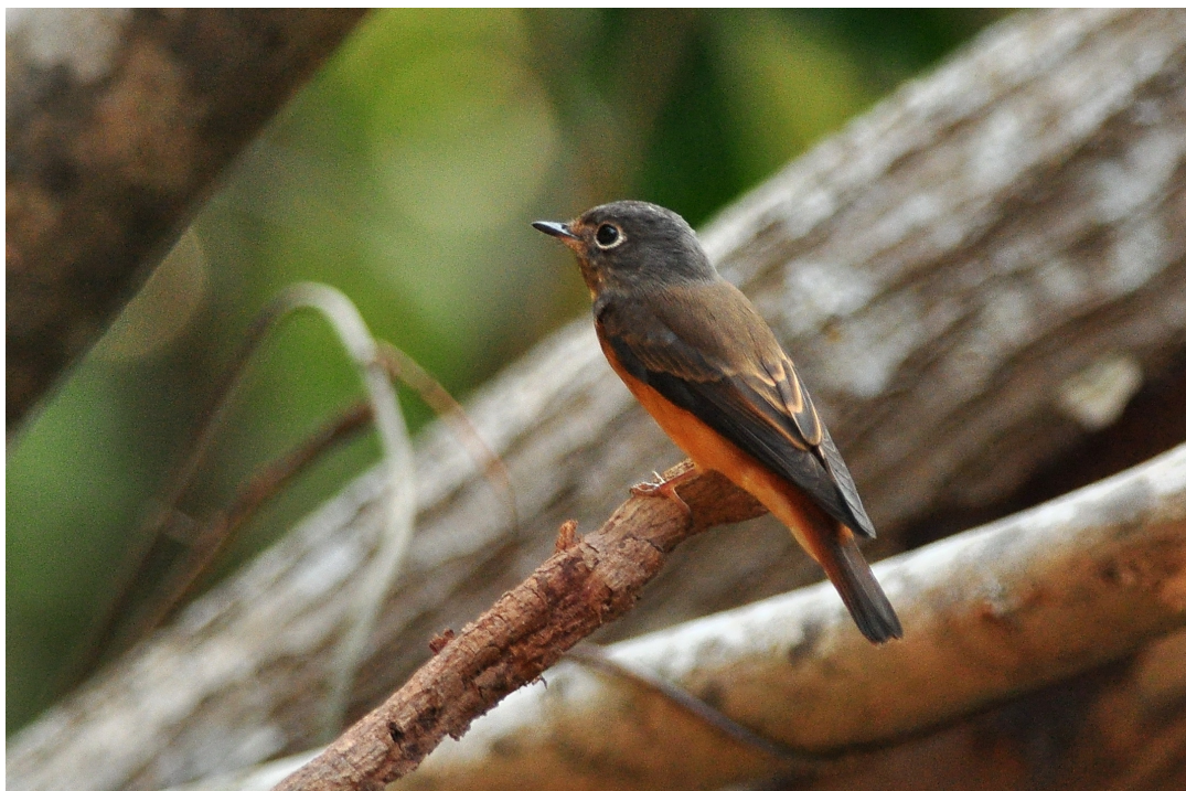
ภาพที่ 8 แสดงนกจับแมลงสีน้ำตาลแดง