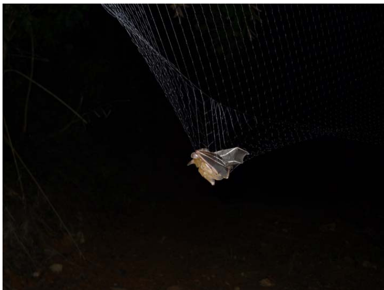
ภาพที่ 10 แสดงตาข่ายที่ใช้ในการดักค้างคาว