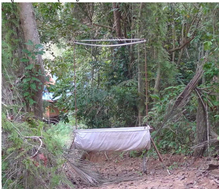
ภาพที่ 9 แสดง Harp trap สำหรับดักค้างคาว

จากการสำรวจความหลากหลายของค้างคาวในพื้นที่เกาะทะเล อำเภอบางสะพานน้อย จังหวัดประจวบคีรีขันธ์ ในระหว่างวันที่ 13-16 มีนาคม 2554 โดยการวาง harp trap และตาข่ายสำหรับดักค้างคาว สามารถจับค้างคาวได้ 1 ชนิด คือ ค้างคาวขอบหูขาวกลาง Cynopterus sphinx จำนวน 4 ตัว และจากการเดินสำรวจในเวลากลางวัน พบค้างคาวแม่ไก่เกาะ Pteropus hypomelanus อยู่รวมกันเป็นกลุ่มใหญ่บริเวณ