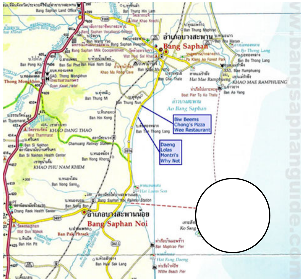
ภาพที่ 1 แสดงแผนที่เกาะทะลุ