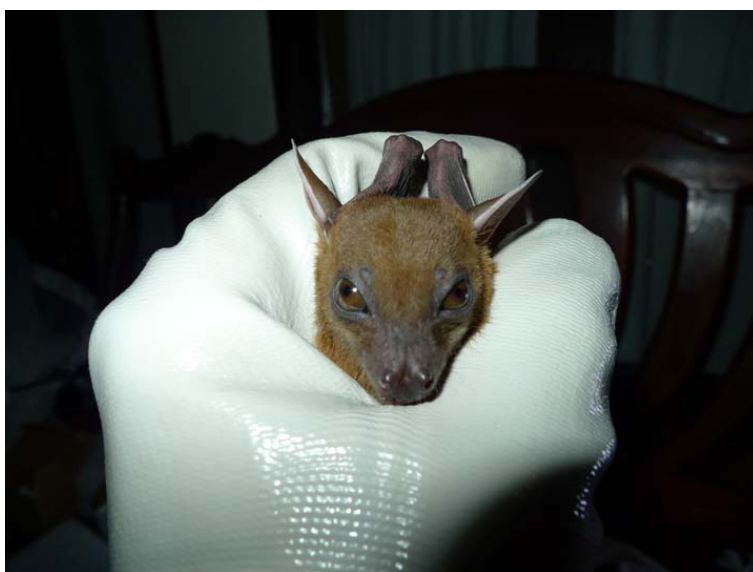
ภาพที่ 11 แสดงค้างคาวขอบหูขาวกลาง Cynopterus sphinx