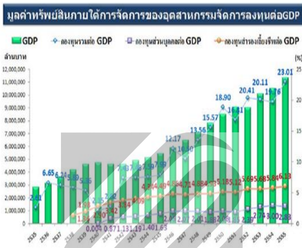
ภาพที่ 2.2 มูลค่าทรัพย์สินภายใต้การจัดการของอุตสาหกรรมจัดการลงทุนต่อ GDP ปี 2535-2555 ที่มา : สมาคมบริษัทจัดการลงทุน