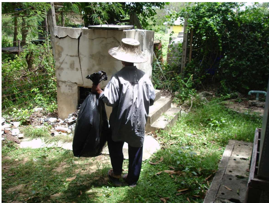
การเคลื่อนย้ายมูลฝอยติดเชื้อ