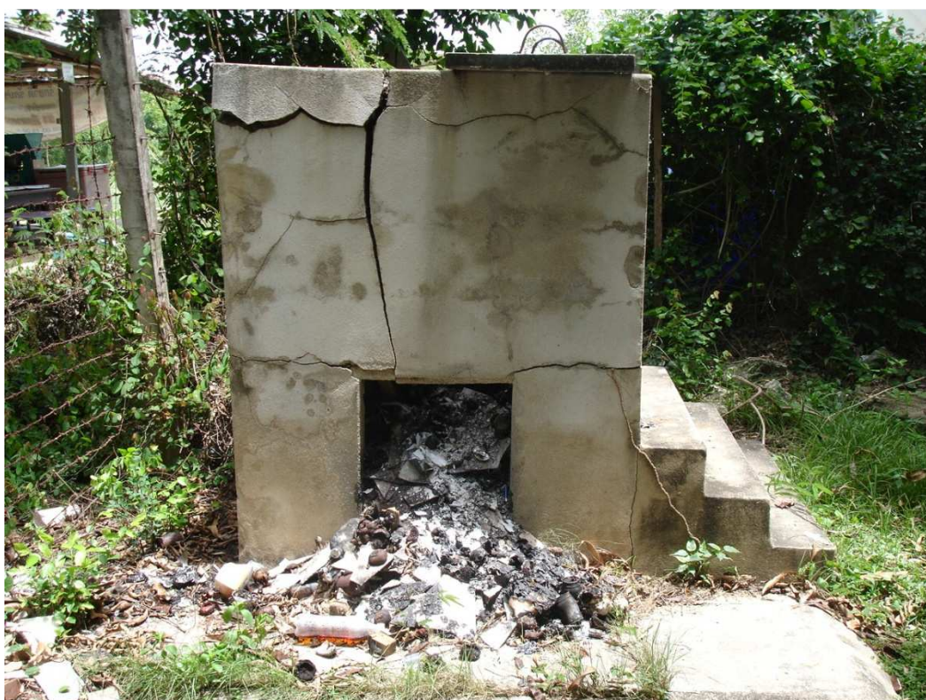
เตาเผามูลฝอยไม่ได้มาตรฐาน