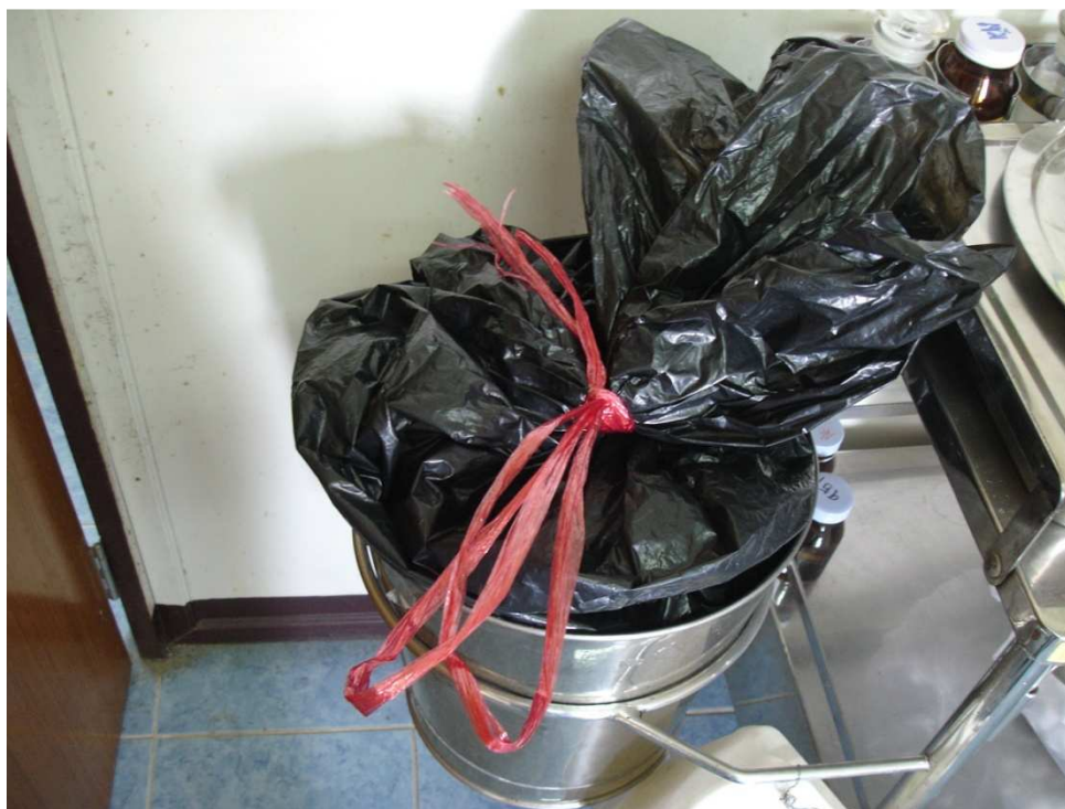
การจัดเก็บรวบรวมมูลฝอยติดเชื้อ