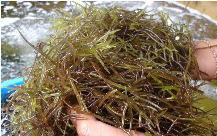
ภาพที่ 1 สาหร่ายกวาง ( Solieria robusta (Greville) Kylin)

ศูนย์วิจัยและพัฒนาประมงชายฝั่งสมุทรสงคราม มีสาหร่ายกวาง ( Solieria robusta ) เจริญอยู่ในบ่อพักน้ำเป็นจำนวนมาก ข้อมูลการศึกษาวิจัยประโยชน์ของสาหร่ายกวางยังมีน้อย ผู้วิจัยจึงสนใจนำมาใช้ในการศึกษาทดลองยับยั้งและป้องกันเชื้อไวรัสตัวแดงดวงขาวในกุ้งกุลาดำในครั้งนี้