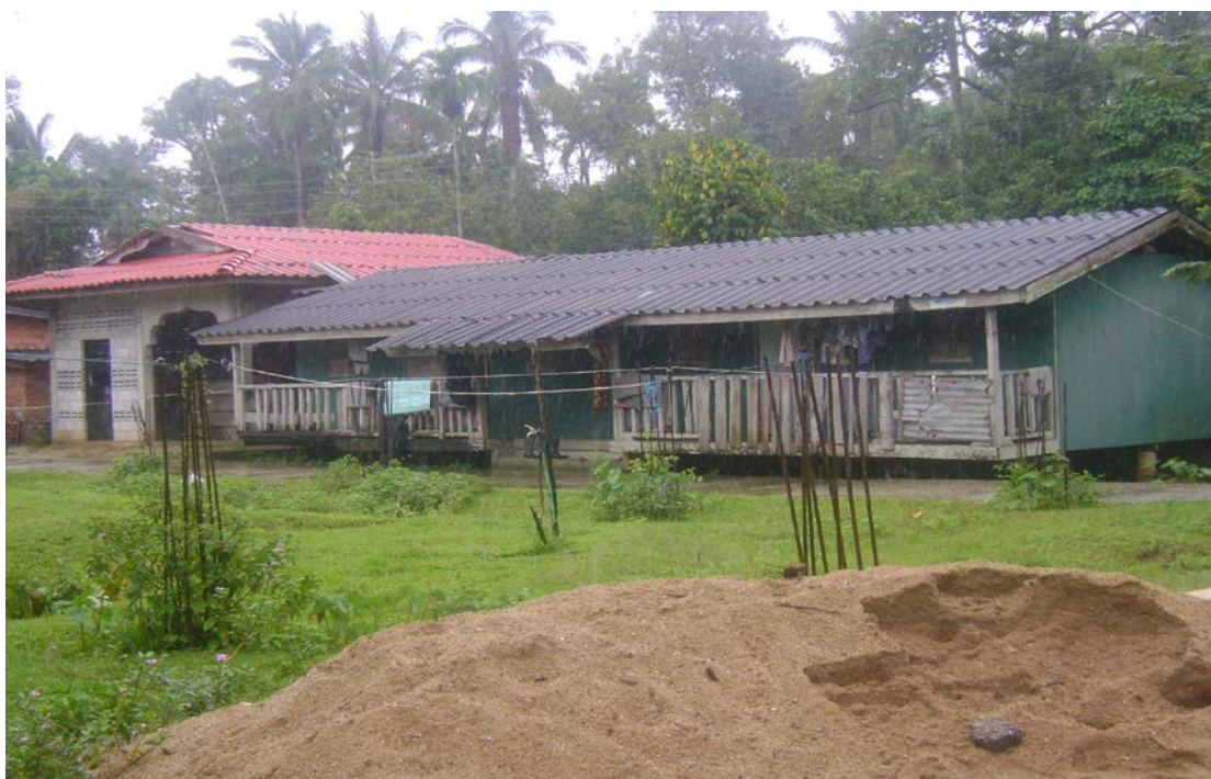
ภาพที่ 9 ลักษณะที่พักอาศัยของผู้สูงอายุใน “ปอเนาะอาเยาะสุ” เทศบาลนุกะตา ตำบลโละจูด อำเภอเวียง จังหวัดนราธิวาส

ถ้านับย้อนเวลากลับไป “ปอเนาะดาแล” แห่งนี้สร้างมานานพอสมควร เพราะเป็น “ปอเนาะ” ที่มีการสืบทอดจากบรรพบุรุษ อย่างไรก็ตาม “ปอเนาะ” แห่งนี้ยังมีผู้สูงอายุมาขออาศัยอยู่เพิ่ม แต่เนื่องจากที่พักอาศัยมีไม่เพียงพอต่อผู้สูงอายุที่เข้ามา ปัจจุบัน (2553) เหลือผู้สูงอายุอาศัยอยู่ 3 คน และอีกหนึ่งครอบครัวที่ขออาศัยอยู่ด้วย ผู้สูงอายุมีลูกมาเยี่ยมทุกสัปดาห์ คอยให้ความช่วยเหลือทางด้านต่าง ๆ ผู้สูงอายุส่วนใหญ่ยังมีร่างกายแข็งแรง สามารถช่วยเหลือตัวเองได้ เช่น หุงข้าวเองได้ การที่ผู้สูงอายุได้เข้ามาอยู่ใน “ปอเนาะดาแล” แห่งนี้ เพราะว่าได้เรียนรู้เกี่ยวกับวิถีปฏิบัติธรรม พร้อมกับปฏิบัติศาสนกิจเพื่อสะสมผลบุญในบั้นปลายของชีวิต