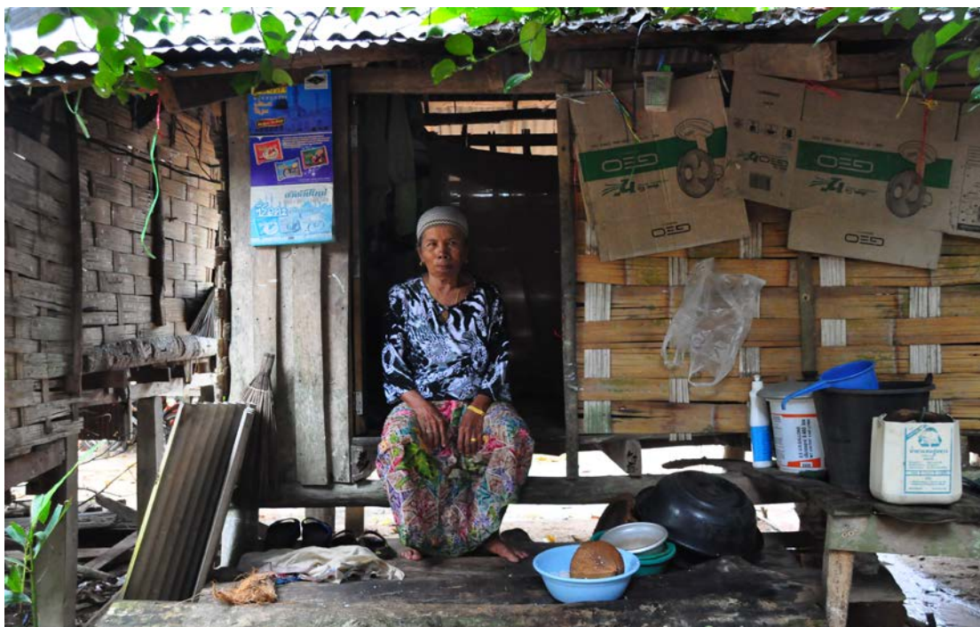
ภาพที่ 5 ผู้สูงอายุอาศัยอยู่ใน “ปอเนาะดาแล” ที่เป็นสวนหนึ่งของ “ปอเนาะ สอลาฮุดดีน ตำบลโคกโพธิ์ อำเภอโคกโพธิ์ จังหวัดปัตตานี

ในหลาย “ปอเนาะ” อาจจะมีผู้เฒ่าผู้แก่ คนยากไร้ คนพิการ หรือคนที่ไม่มีความรู้พื้นฐาน เด็กกำพร้า หรือบุคคลที่เข้ารับศาสนาอิสลามที่เรียกว่ามุสลิมใหม่ ๆ ฯลฯ อาจจะทำอาศัยอยู่ร่วมในบริเวณปอเนาะ(ส่วน)ใน หรือจะเรียกในภาษาท้องถิ่นว่า “ปอเนาะดาแล” ด้วย ดังนั้นภาระความรับผิดชอบและบทบาทของสถาบันการศึกษาปอเนาะไม่เพียงเป็นการบริการการศึกษาศาสนาเพียงอย่างเดียว แต่โต๊ะครูอาจจะเป็นผู้ดูแลและอนุเคราะห์ให้สถานที่สร้างที่พักพิงของผู้ด้อยโอกาสของชุมชนเกือบทุกประเภทด้วย