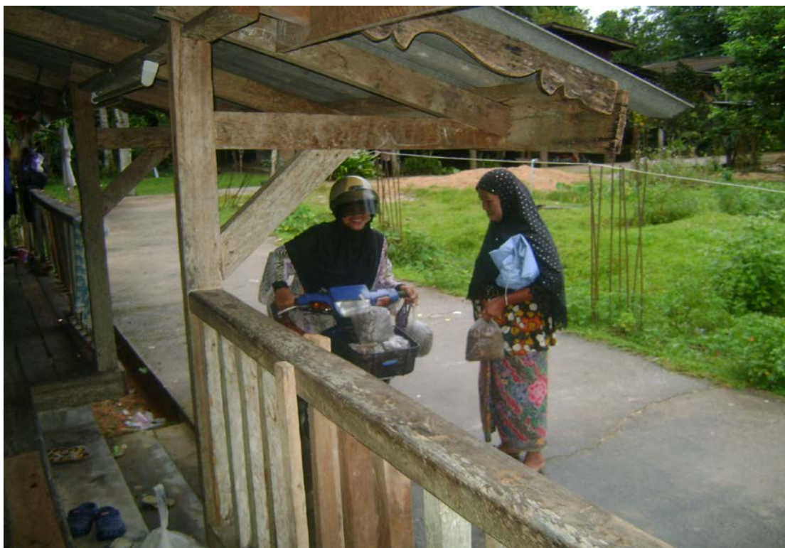
ภาพที่ 15 ชาวบ้านมีน้ำใจเอื้อเฟื้อ แบ่งปันอาหารให้กับผู้สูงอายุที่อยู่ใน “ปอเนาะดาแล” เทศบาลบุเกะตา อำเภอแว้ง จังหวัดนราธิวาส

ให้ความช่วยเหลือ เช่น มีเทศบาล และองค์การบริหารส่วนตำบล ได้จัดทำโครงสร้างพื้นฐาน มีการสร้างถนนคอนกรีต ที่พักอาศัย และอื่น ๆ ดังรายละเอียดที่จะกล่าวต่อไปนี้