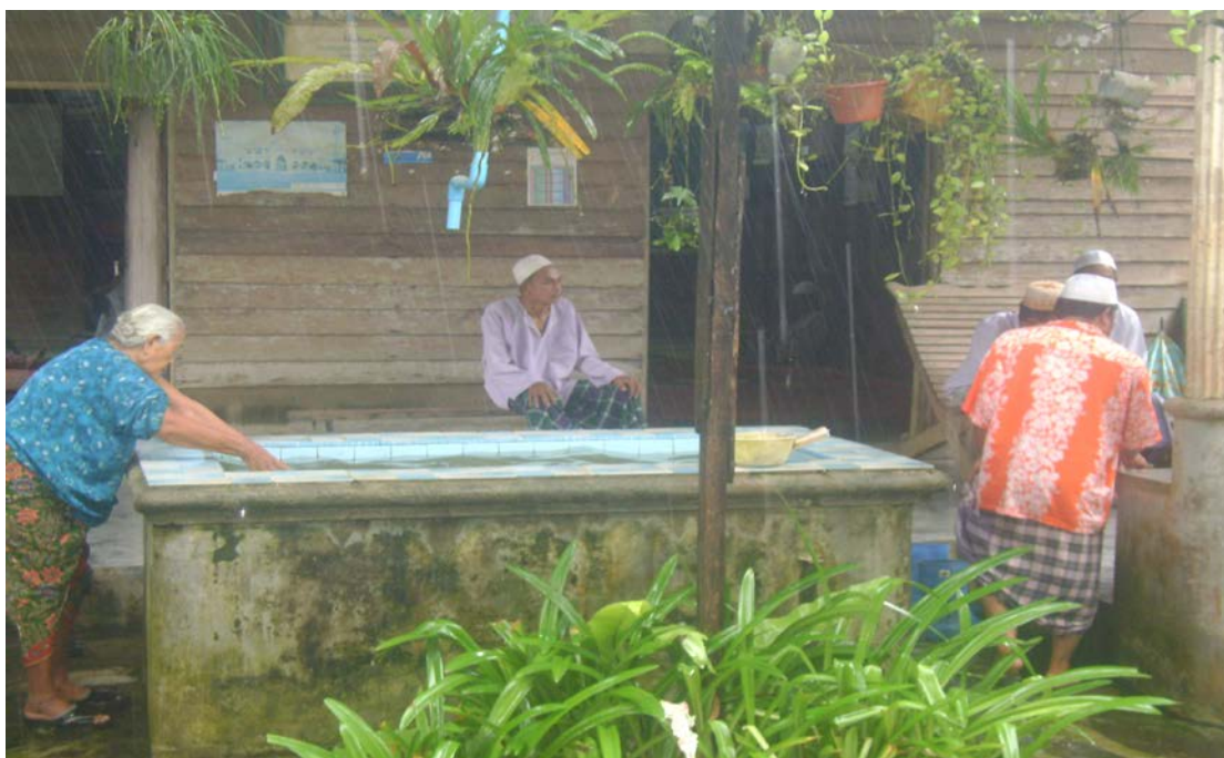
ภาพที่ 7 ผู้สูงอายุกำลังอาบน้ำละหมาด และมีชาวบ้านกำลังนั่งรอเวลาละหมาดร่วมกันที่ “บาลาซาอะฮู” ใน “ปอเนาะอาเยะฮู” อำเภอเวียง จังหวัดนราธิวาส

ลักษณะของ “ปอเนาะคาแล” เป็นกระท่อมไม้ชั้นเดียว ปลูกกันเป็นหลัง ๆ หรือ ก่ออิฐ เป็นแถวเรียงกันหลายห้อง ในชีวิตประจำวันของผู้สูงอายุ ที่อยู่ใน “ปอเนาะคาแล” จะรับผิดชอบ อาหารการกินดี วยตนเอง หุงข้าวทำกับข้าวด้วยตนเอง เวลาหุงข้าวครั้งหนึ่ง ผู้สูงอายุสามารถ รับประทานได้ถึง 3 มื้อ หรือผู้สูงอายุบางคนยังซักเสื้อผ้าเอง การที่ผู้สูงอายุสามารถช่วยเหลือตนเอง เป็นสิ่งที่แสดงให้เห็นว่าผู้สูงอายุยังมีสภาพร่างกายที่แข็งแรงอยู่ ใน “ปอเนาะคาแล” มีทั้งคนที่มี ฐานะปานกลาง และมีทั้งที่มีฐานะยากจน ส่วนใหญ่แล้วผู้สูงอายุมีฐานะยากจน การที่ผู้สูงอายุมาอยู่ ใกล้เคียงกัน ในกระท่อมไม้โดยไม่มีสิ่งอำนวยความสะดวกมากมาย ทำให้ผู้สูงอายุต้องมาช่วยเหลือกัน เห็นอกเห็นใจกัน ปล่อยวางจากทรัพย์สิน แต่ทุกคนที่มาอยู่ ณ ที่นี้มาอยู่ เสมอเหมือนกันภายใต้หลัก ศาสนาอิสลาม