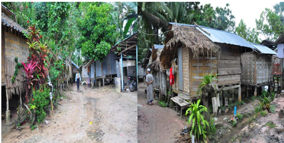
ภาพที่ 3 ลักษณะของกระท่อมเล็ก ๆ เป็นที่พักอาศัยของนักเรียนใน “ปอเนาะ” สามจังหวัดชายแดนภาคใต้