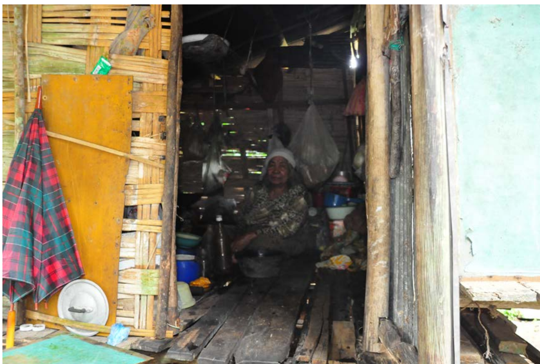
ภาพที่ 6 ผู้สูงอายุอาศัยอยู่ “ปอเนาะคาแล” ในสามจังหวัดชายแดนใต้

ต่อมา “ปอเนาะคาแล” ได้หมายรวมถึงปอเนาะที่จัดไว้สำหรับผู้สูงอายุได้มาพักอาศัยเป็นครั้งคราว หรือประจำ พร้อมกับเรียนรู้อาณา ดังเช่น “ปอเนาะคาแล” ในเขตอำเภอเวียง จังหวัดนราธิวาส ซึ่งเป็นพื้นที่ศึกษา ได้แก่ “ปอเนาะคาแล” ในบ้านควา ตำบลเวียง “ปอเนาะคาแล” ในบ้านจือแร ตำบลแม่ตง และ “ปอเนาะคาแล” ในเทศบาลบูกะตา ตำบลโต๊ะจูด โดยมีโต๊ะครูเป็นผู้ดูแล ปอเนาะประเภทนี้จึงเป็น “ปอเนาะ” สำหรับผู้สูงอายุอย่างเดียว เหตุผลเพราะว่าโต๊ะครูมีอายุมาก ไม่สามารถที่จะดูแลนักเรียนเป็นจำนวนมากได้ จึงเปิดสอนเฉพาะผู้สูงอายุ และบางพื้นที่เดิมเป็น “ปอเนาะ” สอนเด็กนักศึกษาทั่วไป ต่อมาถูกปิดการเรียนการสอนเนื่องจากไม่ได้ไปขึ้นทะเบียน จากนั้นผู้สูงอายุที่มีความต้องการเรียนรู้อาณา จึงได้ไปขอให้โต๊ะครูเปิดปอเนาะอีกครั้งเพื่อสอนผู้สูงอายุ