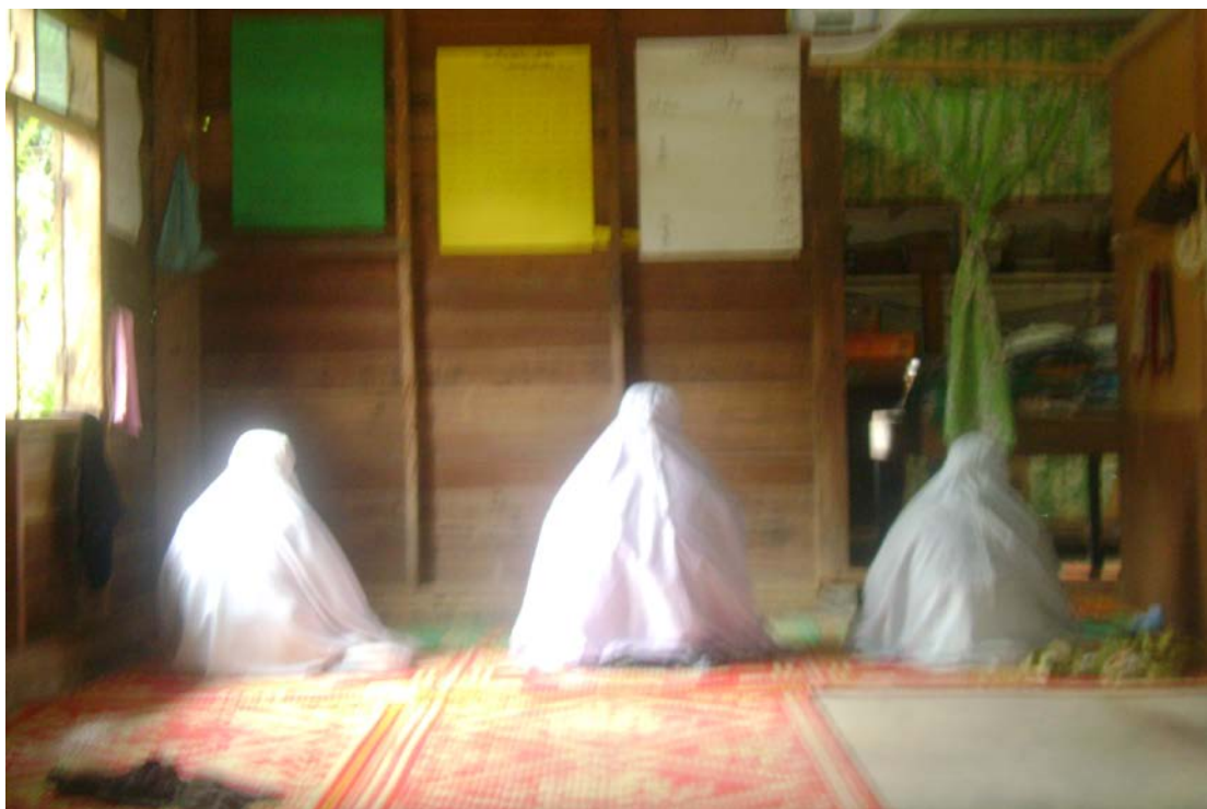
ภาพที่ 11 ผู้สูงอายุกำลังปฏิบัติศาสนกิจ (ละหมาด) ใน “ปอเนาะดาแล” ตำบลเวียง อำเภอเวียงจังหวัดนราธิวาส

เป็นพื้นที่ของโต๊ะครูเดิม ส่วน “ปอเนาะดาแล” ในบ้านจือแร เป็นพื้นที่ที่ชาวบ้านได้บริจาคให้เพื่อสร้างสถานที่สอนศาสนา