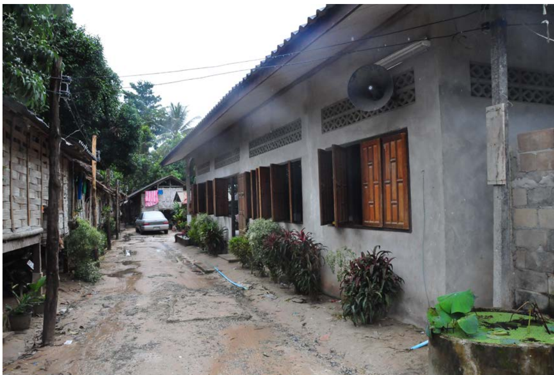
ภาพที่ 2 ลักษณะของ “บาลาเซาฮู” ซึ่งเป็นที่ปฏิบัติศาสนกิจและสถานที่เรียนของนักเรียนใน “ปอเนาะ” สามจังหวัดชายแดนภาคใต้