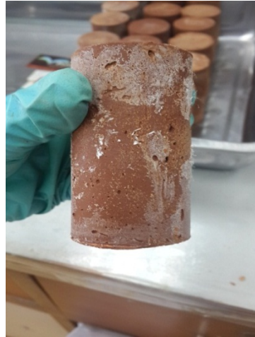
ก้อนตัวอย่างที่ ความเข้มข้น \text{Na}_2\text{O}/\text{SiO}_2 = 0.3