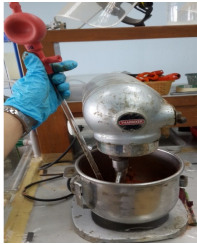
ขั้นตอนการผสมตัวอย่าง