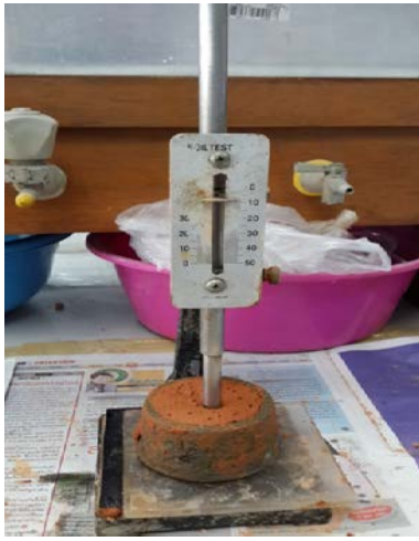
การหาปริมาณน้ำที่เหมาะสม