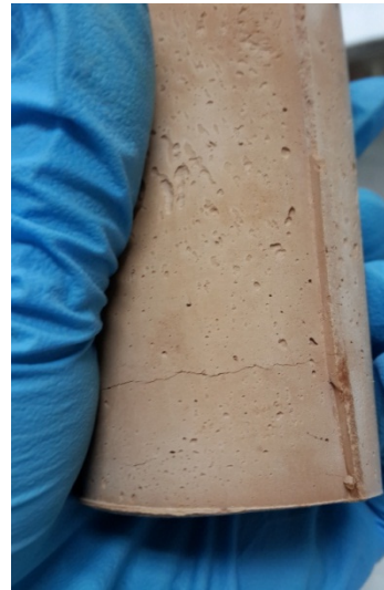
ก้อนตัวอย่างหลังจากออกจากตู้อบไฟฟ้า