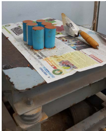
โต๊ะสั้นตัวอย่างเพื่อลดฟองอากาศ