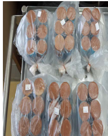
หุ้มตัวอย่างก่อนนำไปบ่มในตู้บ่มไฟฟ้า