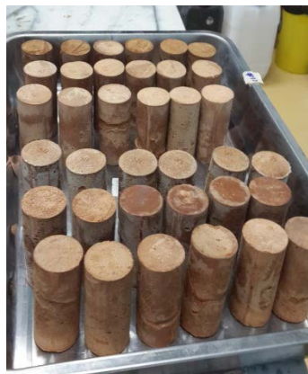
ตัวอย่างที่หลังครบอายุบ่ม