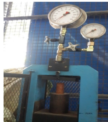
เครื่องทดสอบกำลังอัด