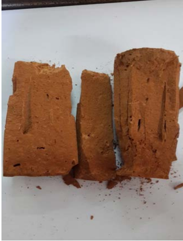
ก้อนตัวอย่างที่ทดสอบกำลังอัดแล้ว