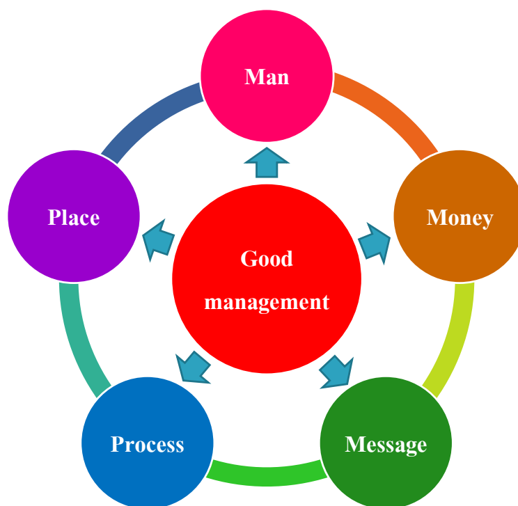
แผนภูมิ 4.3 3M2P Model การบริหารจัดการที่ดีมีประสิทธิภาพของโครงการสหวิทยาเพื่อการพัฒนาท้องถิ่น

จากการระดมสมองคิดยุทธศาสตร์ และกลยุทธ์การบริหารจัดการดังกล่าว จึงมีข้อเสนอรูปแบบการบริหารจัดการที่คาดหวังว่าจะแก้ปัญหาต่างๆ ให้ลุล่วงโดยเสนอรูปแบบการบริหารจัดการใหม่ that คาดหวังว่า จะมีประสิทธิภาพและศักยภาพสร้างความเป็นเลิศในการบริหารจัดการรูปแบบดังกล่าว เรียกว่า 3M2P Model ดังนี้