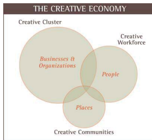
ภาพที่ 2 องค์ประกอบของเศรษฐกิจสร้างสรรค์