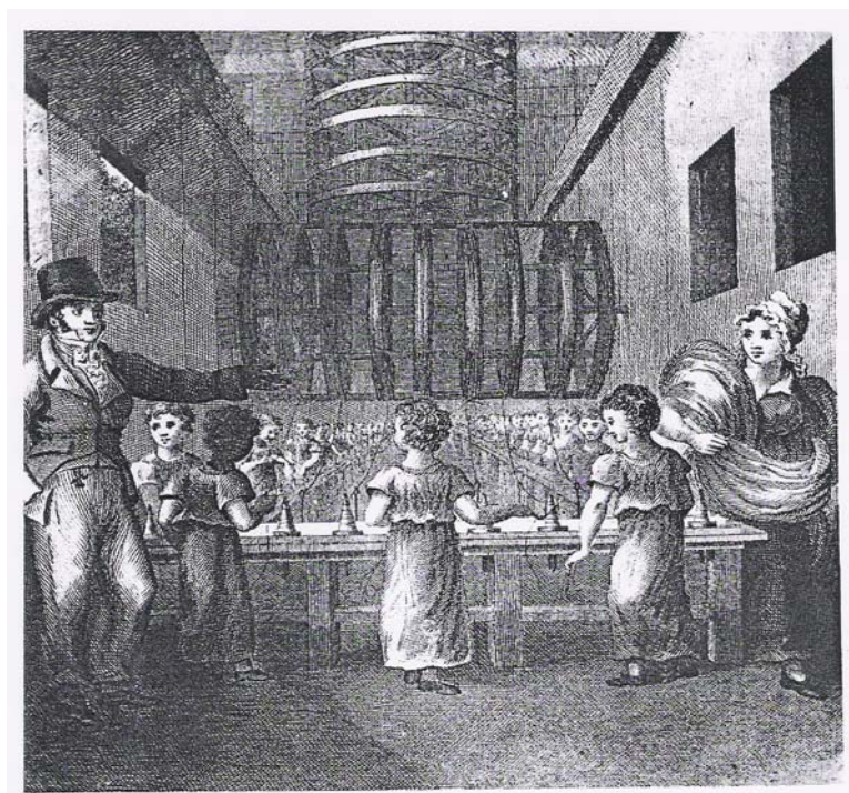
ภาพที่ 3.3 การทำงานของเด็กในห้องปั่นด้ายฝ้าย

ที่มา: Penelope Davies, Children of the Industrial Revolution , (London: Wayland Pub., 1972), p. 22.